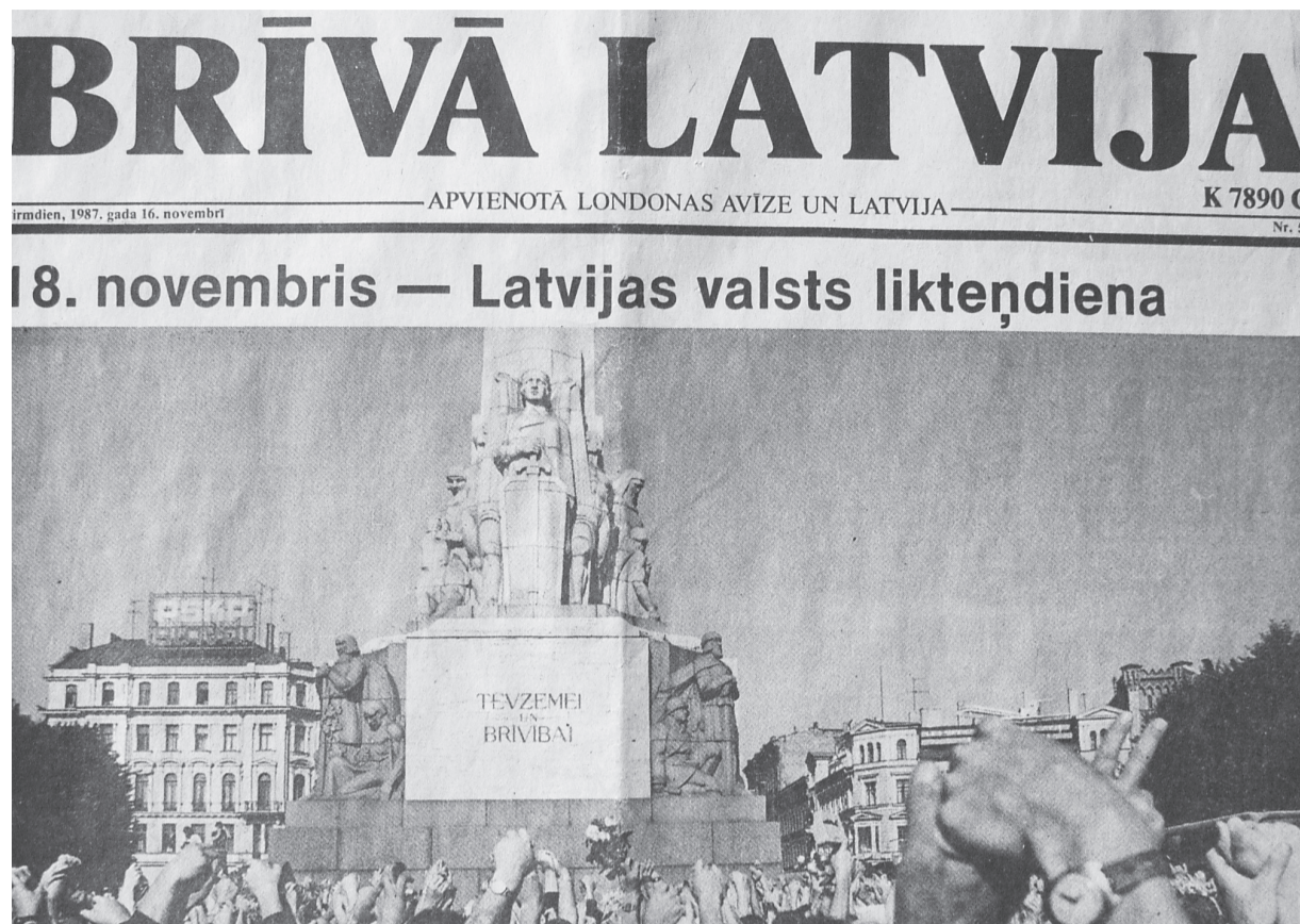
Sergeja Akurātera foto BL - 1987. gada 16. novembris