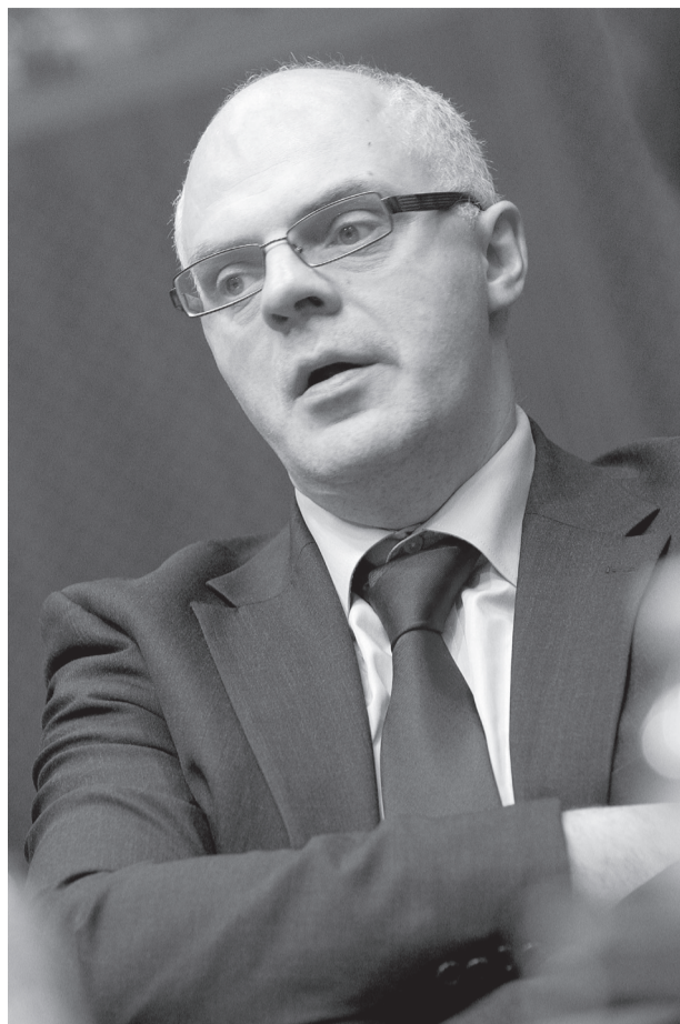
Latvijas Republikas Izglītības un zinātnes ministrs Roberts Ķīlis