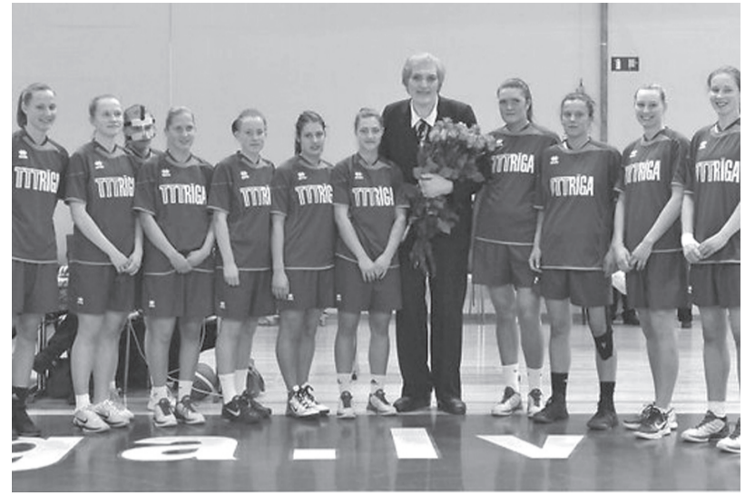
Uljana Semjonova jubilejas reizē kopā ar TTT jaunajām basketbolistēm

Laikā no 1988. līdz 1992. gadam Semjonova bija Latvijas Olimpiskās komitejas viceprezidente. 1993. gada 10. maijā Uljana Semjonova kā pirmā eiropiete tika izvirzīta uzņemšanai basketbola slavas zālē Springfeldā, ASV, kur tajā pašā gadā tika uzņemta.