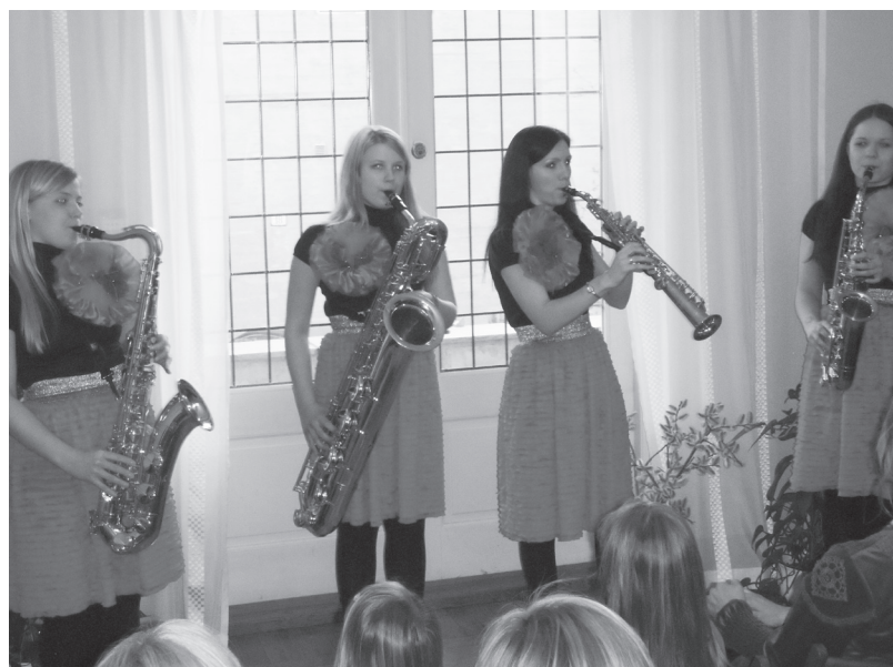
Mūzicē saksofonu kvartets n(ex)t move