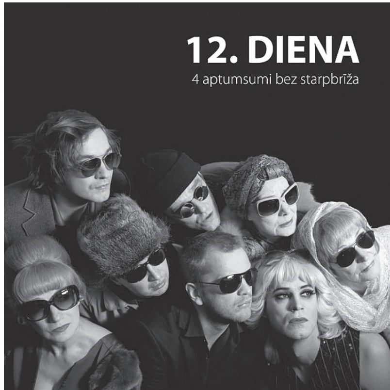
„12. diena” – Dailes teātra izrādes plakāts