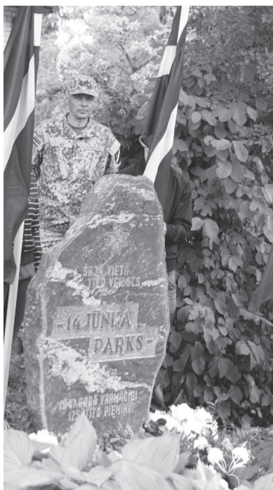
14. jūnijā notiek atceres sarīkojumi 1941. gada 14. jūnija komunistiskā genocīda upu piemiņas vietās

1941. gada 14. jūnijā no Latvijas izsūtīto personu lietas sakopotas Latvijas Valsts vēstures arhīva fondos „Latvijas PSR VDK par sevišķi bīstamiem pretvalstiskiem noziegumiem apsūdzēto personu krimināllietas (1940-1985)”. Latvijas PSR Iekšlietu tautas komisariātā un Valsts drošības tautas komisariātā „sociāli bīstamo elementu” sarakstus izsūtīšanai veidoja, izmantojot Latvijas Republikas valsts iestāžu, organizāciju, likvidēto biedrību arhīvus, preses izdevumus, Valsts statistikas pārvaldes pārskatus, kā arī ar PSRS pasu izsniegšanu saistītos