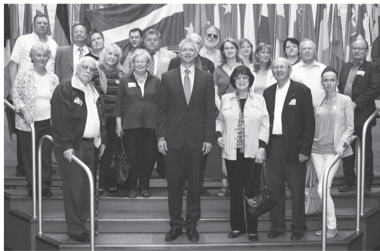
Daugavas Vanagu pārstāvji Eiropas Parlamentā

Īsajā uzrunā, ko viesiem veltīja deputāts Kariņš sēdes starplaikā, viņš puda lielu cerību par Latvijas nākotni, augstu vērtēŗot latvieŗu jaunatni.