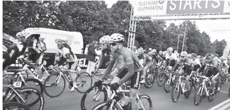
Rīgas velomaratona distancē vajadzēja pavadīt vairāk nekā četras stundas

Rīgas starptautiskajā velomaratonā dažāda gaŗuma trasēs startēja dalībnieki vairāk nekā no 50 valstīm. Profesionālie riteņbraucēji cīņās par uzvaru Rīgas Grand