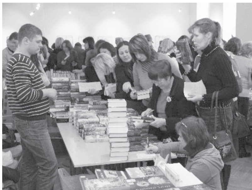
Talsu jaunieši Grāmatu svētkos

toriem, tulkotājiem un izdevējiem pasniedzam „Lielo lasītāju balvu”. 2011. gadā konkursā spēja piedalīties tikai 548 no 874 publiskajām bibliotēkām.