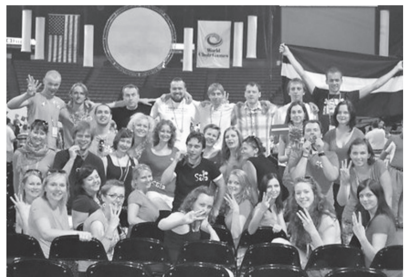
Koņa Sōla dalībnieki

Visvairāk punktu koris izpelnījās sakrālās mūzikas kategorijā, kuŗā vairāki vērtētāji Latvijas dziedātājiem deva augstāko iespējamo vērtējumu. Jo augstāk šis koņa sasniegums vērtējams tāpēc, ka bija jāsaņem tā sauktajā “čempionu grupā”. Koņus šai grupai izvēlas Pasaules koņu olimpiadas mākslinieciskā padome, un šajā grupā vāju koņu nav, bet konkurence ir ļoti sīva. Mūsu koris iemantoja publikas simpatijas. Visos koncertos un arī konkursā, kad dziedāja Sōla , klausītāji kori sveica ar aplausiem, stāvot kājās. Koņa māksli-