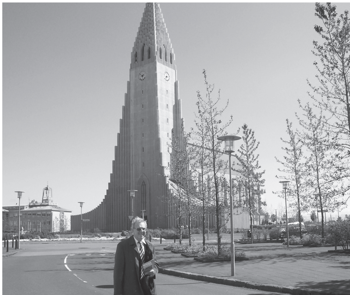
Archibīskaps Elmārs Ernsts Rozītis pie Reikjavīkas katedrāles Hallgrimskirka, kurā notika bīskapes konsekrācijas dievkalpojums