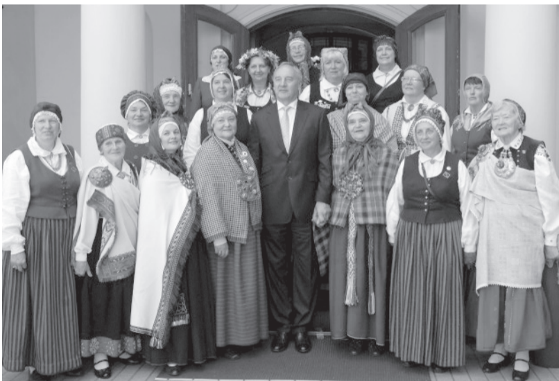
Valsts prezidents Andris Bērziņš tiekas ar festivāla Baltica 2012 grupu vadītājiem

Visu tautas tradīciju kopēju prasme tika demonstrēta gan Rīgā, gan ārpus galvaspilsētas – Īkskilē, Ķekavā, Turaidā, Siguldā, Barkavā, Cesvainē, Ērgļos, Koknesē, Ļaudonā un Madonā. Ar dziesmām un tautas melodijām visu paaudžu tautas garamantu kopēji un glabātāji apliecināja piederību pie savas tautas saknēm, jo tas dažādu tautu pārstāvjiem ļauj atplaukt krāšņā daudzveidībā.