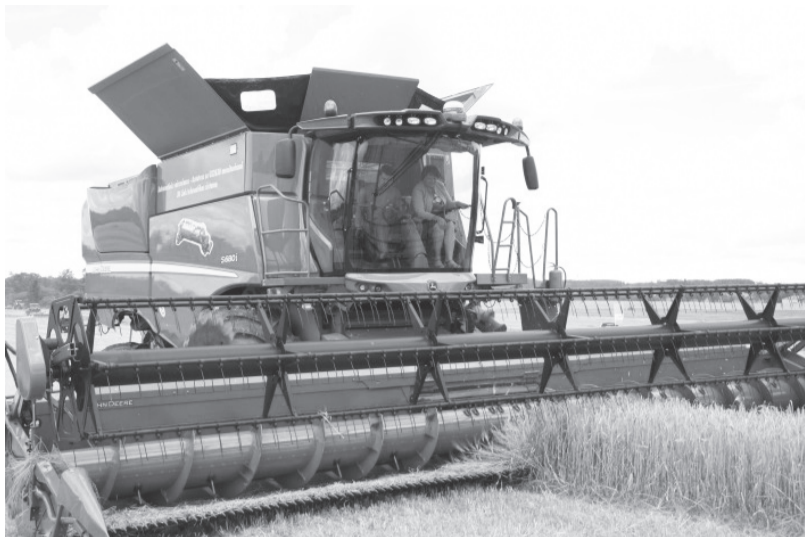
Zemkopības ministre Laimdota Straujuma izmēģina ērto kabīni, lai novērtētu kombaina darba procesu no tā vadītāja augstumiem

Zemgale sensenī uzskatīta par Latvijas maizes klēti, kur ir visvairāk graudaugu lauku. Lielākā lauksaimnieciskās produkcijas ražotāja - Codes pagasta SIA