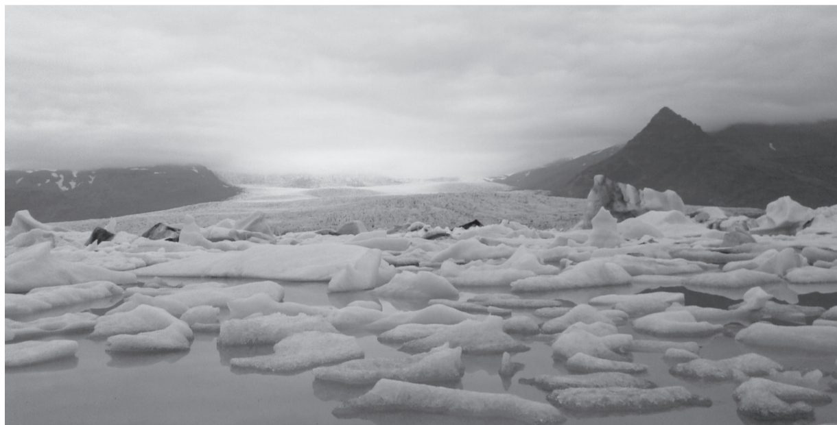
Ledus ceļā uz okeanu

Luterāņu Baznīca Islandē ir arī tautas Baznīca, to varēja redzēt gan bīskapes konsekrācijas dievkalpojumā, gan svinīgajos sarīkojumos, kuŗos daudzas sievietes bija ieradušās skaistos, ar zelta diegiem grezni izšūtos tautastērpos; galvā melna samta cepurīte, kuŗas labajā pusē sudraba ietvarā kā melna bize līdz pat plecam nokarājas smalku zīda diegu pušķis. Šajos tērpos sievietes izskatās skaistas un cēlas, varbūt tikpat pievilcīgas kā latviešu sievietes savos tautastērpos.