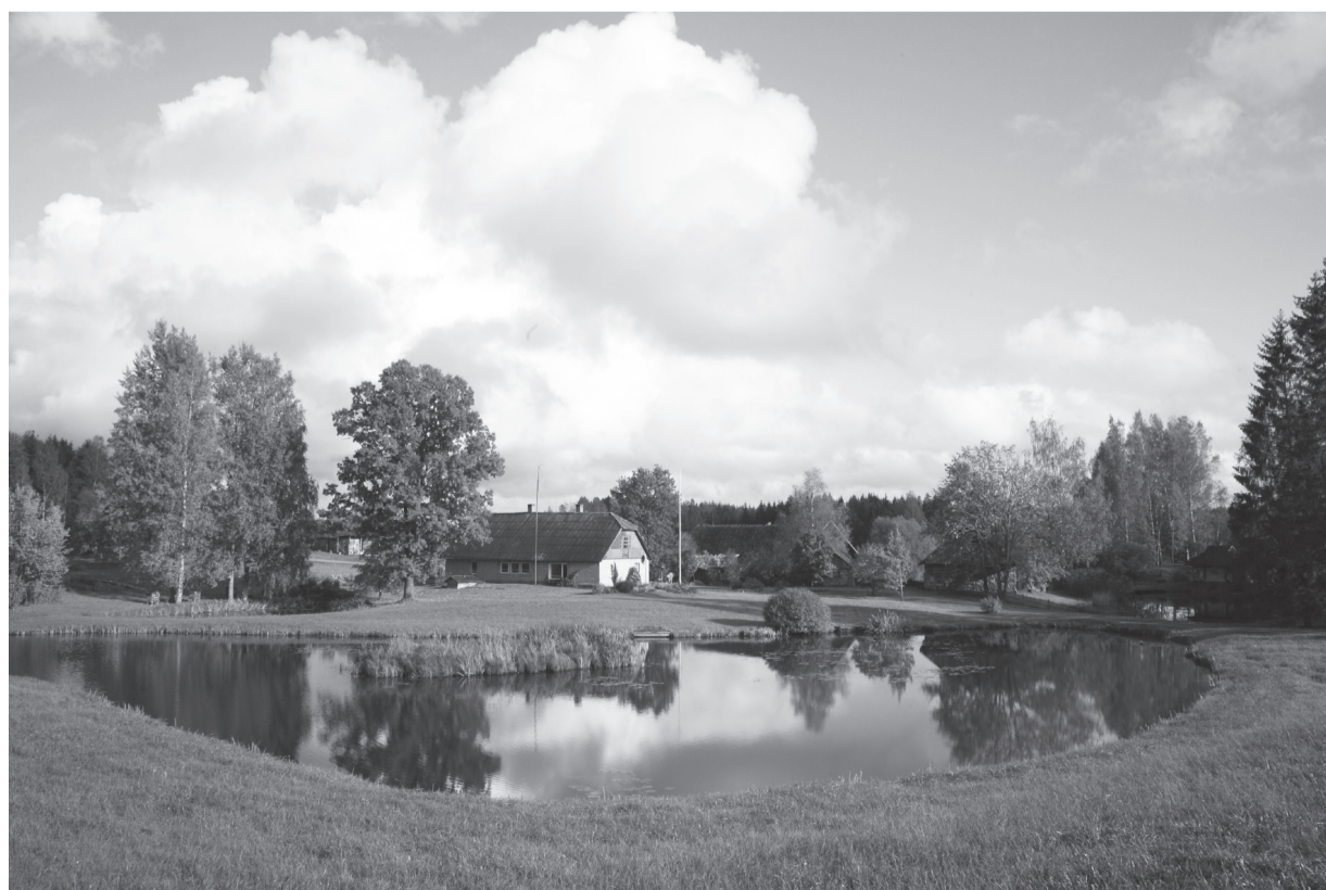
Dolmaņu ģimenes dārzs "Lielkrūzēs"