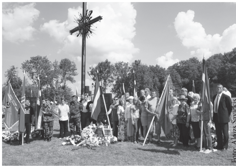
Latvijas pārstāvji Igaunijas leģionāru salidojumā Sillamē. Vietā, kur notika Otrā pasaules kara asiņainākās kaujas Igaunijas teritorijā

Igaņu leģiona veterāni un Igaņu leģiona draugu kluba pārstāvji ir bijuši Latvijā rīkotajos leģionāru salidojumos 16.