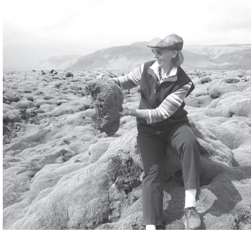
Lavas lauki apauguši ar biezu sūnu un ķērpju kārtu

Laikam nebūs neviena, kuŗš Islandi atstās vienaldzīgs. Man šķiet, ka pat vistrulākajam un skaļākajam pasaules tūristam, redzot, kā apvienojas dabas skarbums, kur vienīgā dzīvības zīme kilometriem tālu ir divi vai trīs jēriņi, kuŗiem nav pat ne mazākā krūmiņa vai aizvēja, kur paslēpties no lietusa, vai arī traušlās puķītes izdedžu lauku vidū, kas zied, it kā tikai pasaules Radītājam par prieku, zinot, ka neviens cits par to ziedēšanu nepriecāsies, jo cilvēks tur nokļūt nespēj, - un dabas daiļums, ko rada neskaitāmie ūdenskritumi, neparasti skaistie putni okeana krastā, kuŗi, savus bērnus sargā-