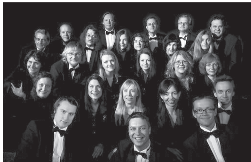
Radio koris pārstāv Latvijas mūziķus Zalcburgas festivālā