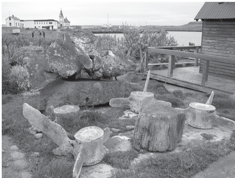
Atpūtas vieta, kur krēslī darināti no vaļa kauliem

Ir jāredz un jādzird, kā klusumā pil kūstošā ledus lāses un kā ūdens straume nes ledus gabalus jūras plašumos. Tad var saprast Bjorkas melodijas un viņas tērpus.