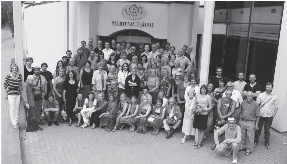
Valmieras teātra saime, 90. sezonu iesākot

teātris un Liepājas teātra saime, kas ar savām izrādēm jau augustā iepazīstinās Rīgas skatītājus.