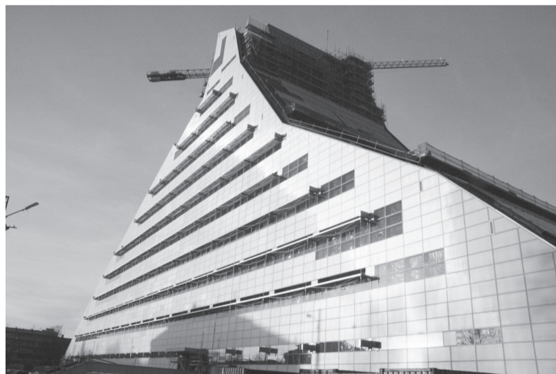
Nacionālās bibliotēkas būvlaukumā vēl daudz darāmā

Tikām Kultūras ministrija publicējusi skaitļus, kas raksturo Latvijas teātru darbību visa 2011. gada laikā. Šajā ziņojumā teikts, ka pagājušā gada laikā mūsu teātru izrādes apmeklējuši 748 915 skatītāji. Visvairāk apmeklētāju šai posmā bijis Nacionālajam teātrim – 204 500, savukārt gada laikā visvairāk izrāžu – 589 – Leļļu teātrim.