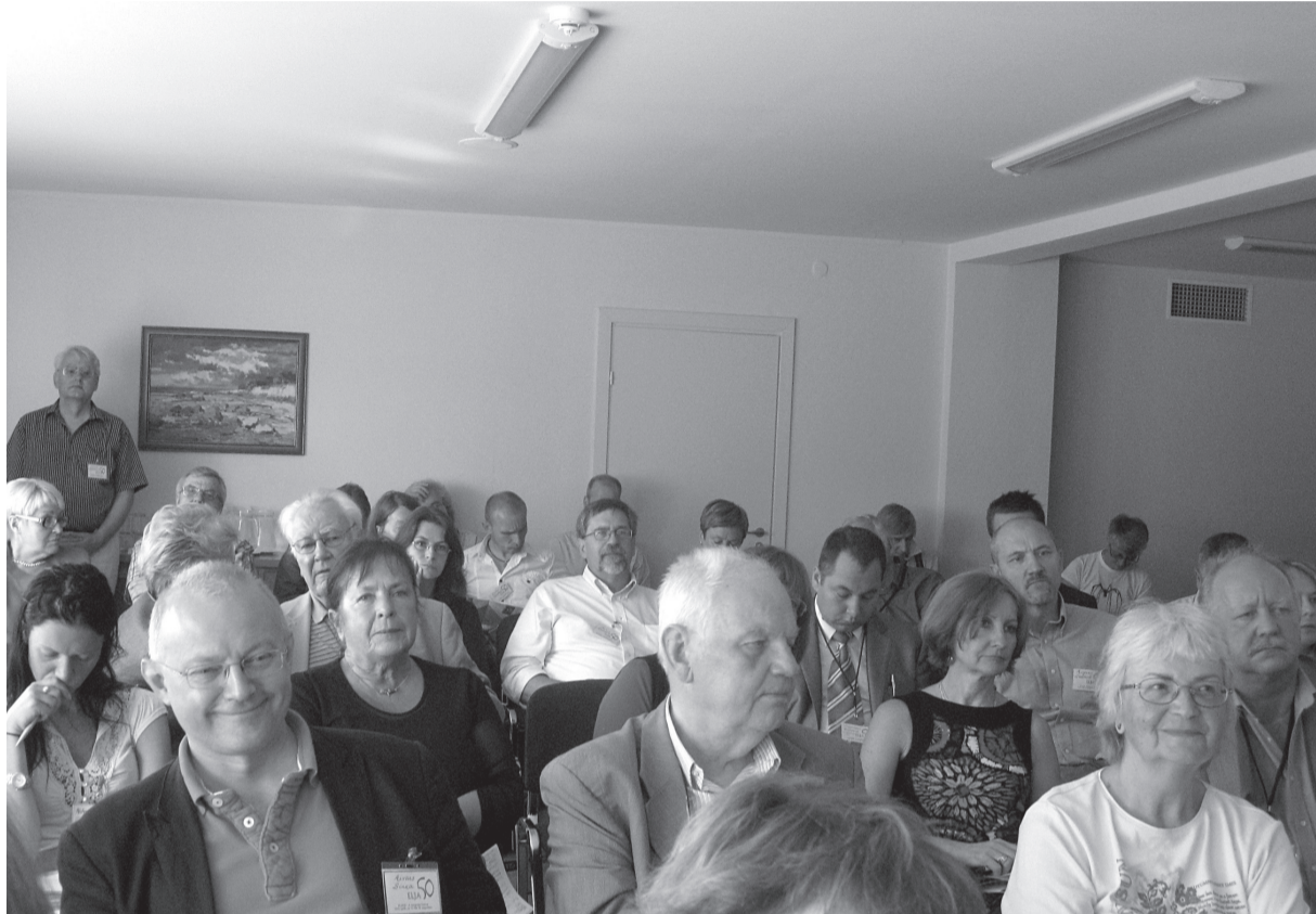
ELJA50 kongresa darba mirklis