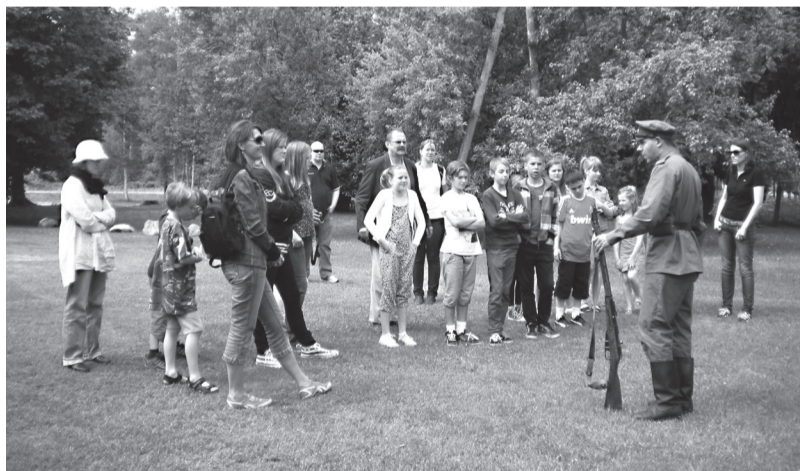
Klausāmie par Ziemassvētku kaujām

Tās 700 gadus vecā pils ir saistīta ar iepriekšējā mācību gadā lasīto Livonijas temu. Jaunpils pils celta 1301. gadā kā Livonijas ordeņa cietoksnis. Vairāk nekā 350 gadus pili valdījusi fon der Reku ( Recke ) dzimta. Te nu mēs varējām izmēģināt spēkus viduslaiku atrakcijās – loka šaušanu, cirvja un šķēpa mešanu, monētu kalšanu. Vakariņas ēdām kā viduslaikos – ar rokām. Tas arī likās neparasti un interesanti.