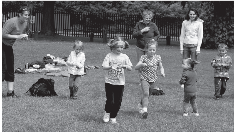
Mirkļis no latviešu sporta spēlēm Mančesterā