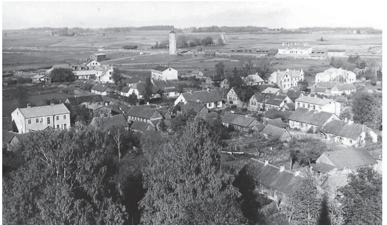
Skats uz Dobeļi no ev. lut. baznīcas torņa, tālumā redzams ūdenstornis un stacijas ēka, tur arī Stacijas iela 20. gs. 30. gados

Dziesmu svētkus atklāt kā augsts viesis ieradies brīvkungs fon Mēdemš, laikam ģenerāļu Dankera un Bangerska pavadībā. Skan trompētes, un ribbungas - orķestris spēlē sagaidīšanas maršu. Tautumeitas sagaida Mēdemu ar skaistiem