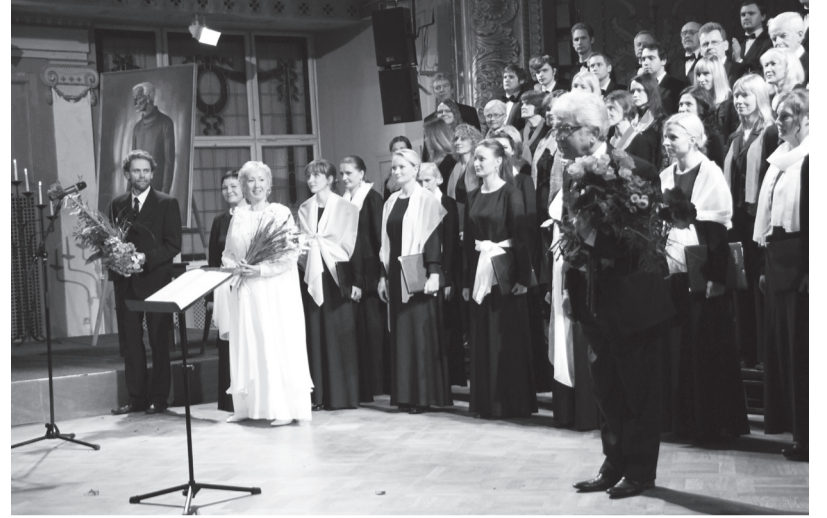
Pēc koncerta Rīgas Latviešu biedrības namā