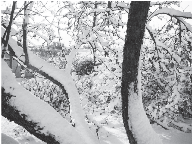
Pēkšņais sniegputenis 26. oktobrī pārklāja zeltaino rudens rotu un radīja daudzas problēmas