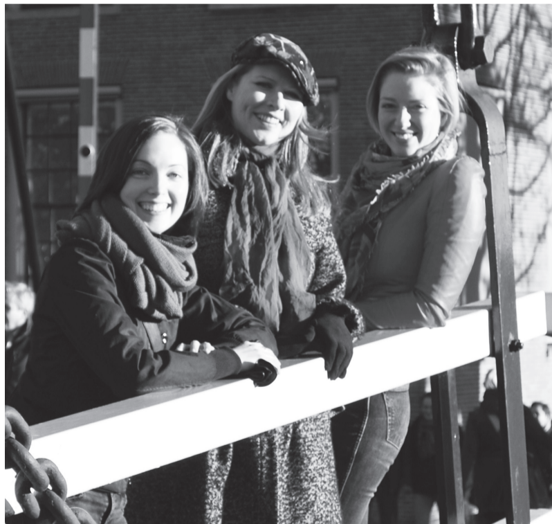
Fonda “Laimas zeme” valde

2012. gads latviešiem ir īpašs: esam saskaitīti, un ir atklājušies reālie pēdējā gadu desmita emigrācijas skaitļi (-12% no Latvijas iedzīvotāju skaita 10 gados), Latvijas ekonomika uzrāda lielisku atveseļošanās ar labākajiem izaugsmes rādītājiem Eiropā. Pārmaiņas jūtam arī latviešu saimē ārvalstīs - arvien vairāk tiek runāts par profesionālo kontaktu apmaiņu un sadarbību, ne tikai kultūras mantojuma un valodas saglabāšanu vien. Ārzemju latviešu organizāciju un individuālo personu ieguldījums ir bijis neatsverams gan atmodas laikā, gan križu brīžos. Nu darbaspēka un īpašo prasmju piesaistīšana Latvijas ekonomikai ir kļuvusi par vienu no būtiskākajiem Latvijas nākotnes izaicinājumiem. Liels skaits Latvijas valstspiederīgo izbrauc, un tas ievērojami samazina uzņēmumu spēju paplašināties, bet tieši tagad vairāk nekā jebkad agrāk uzņēmumi meklē izglītotus un ambi-