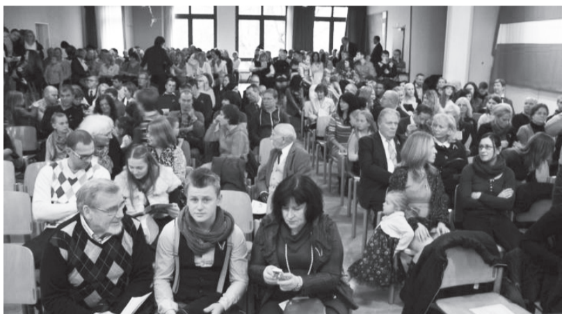
Svētku publika Minsterē

18. novembra pēcpusdienā Latvīšu centrs Minsterē (LCM) izcēlās ne vien ar plīvojošiem sarkanbaltsarkanīem karogiem un uzrakstu „LATVIJA”, bet arī ar nerastu cilvēku burzmu un aktivitāti LCM teritorijā. Tik lielu cilvēku pulku vienkopus iepriekš nav izdevies savākt. Latvijas Valsts svētkus svinēt bija ieradusies apmēram 280 cilvēki. Un nav nekāds brīnums, jo šoreiz latviešus Minsterē uzrunāja Eiropas Parlamenta (EP) deputāts Krišjānis Kariņš, bet vēlāk ar dziesmām un dzejoļiem priecēja arī Latvijā labi pazīstamais mākslinieks Igo Fomins.