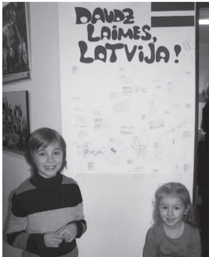
Bērnu sveiciens Latvijai

Runājot par krīzi un emigrāciju, EP deputāts norādīja, ka ārzemēs dzīvojošo latviešu skaits ir apmēram 10-20% no visu latviešu kopskaita, un tas tad nu ir rezultāts sarežģītajai ekonomiskajai situācijai Latvijā. Pēdējā laikā Latvijā tomēr esot vērojama dzīves līmeņa augšupeja, taču lielākā problēma šobrīd saskatāma demogrāfiskajā situācijā, Latvijā tiek „iztukšota”. Viņš vēl piebilda, ka šī problēma ir risinājama „jau šovakar”, - Vācijā dzimušo bērnu skaitu viņš labprāt vēlreiz uzzinātu pēc deviņiem mēnešiem... Tas atkal raisīja aplausu un smieklus šaltī zālē. Krišjānis Kariņš aicināja vecākus dot saviem bērniem iespēju