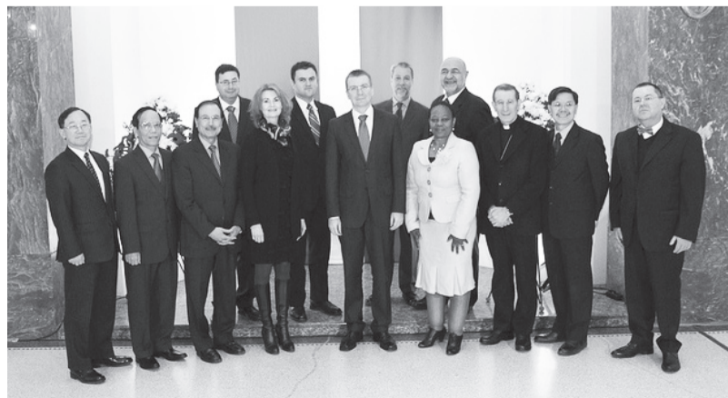
Edgars Rinkēvičs tiek ar nerezidējošajiem vēstniekiem

Ārlietu ministrs Edgars Rinkēvičs 25. janvārī, tiekoties ar Latvijā