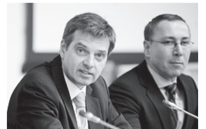
Normunds Penke (pa kr.) ANO sesijā

ievēlēts par ANO Dzimumu līdztiesības un sieviešu iespēju veicināšanas institūcijas Izpildpadomes prezidentu. ANO, Ņujorkā, notika ANO Dzimumu līdztiesības un sieviešu iespēju veicināšanas institūcijas ( UN Women ) Izpildpadomes sesija.