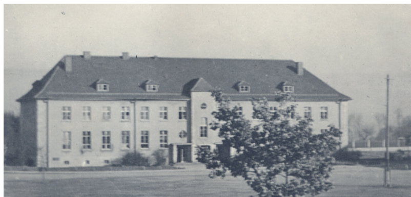
Skola švābu Gmindes latviešu nometnē pēdējos mēnešos Vācijā - 1949. gadā

Mātei Rīgā beidzās skolas ārsts darbs, un viņa saņēma paziņojumu, ka jāpārceļas darbā uz Vāciju. Tēvs ne varēja, ne gribēja līdzi braukt, jo viņam bija jāpaliek darbā par Tautas Palīdzības – agrākā Latvijas Sarkanā Krusta medicīnas daļas administratīvo direktoru un jā rūpējas, lai tūkstošiem latviešu bēgļu Kurzēmē dabūtu medicīnisko aprūpi agrākajās un pārceltajās Sarkanā Krusta slimnīcās, sanatorijās, bērnu punktos un citur. Sekoja drudzaina pakošāšanās, jo līdzi varēja ņemt vienīgi dažas kastes un kofeļus. Dārgākās, vērtīgākās lietas no dzīvokļa Rīgā tika iemūrētas kāda nama pagraba istabā tā, ka nevarēja pateikt, kur bijušas pagraba durvis. Tās piemeklēja tāds pats liktenis kā jūrmalā noraktās.