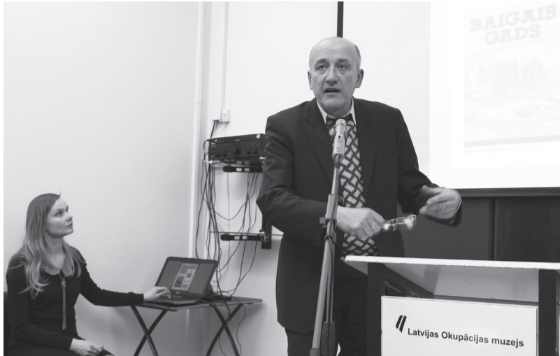
7. februārī Latvijas Okupācijas mūzejā notika mūzeja grāmatas tulkojuma krievu valodā atvēršanas sarīkojums

Grāmata „Latvijas Okupācijas mūzejs. Latvija zem Padomju Savienības un nacionālsociālistiskās Vācijas varas 1940 – 1991”, kurā pēc būtības ir atspoguļots mūzeja ekspozīcijas saturs, pir-