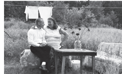
Kadrs no filmas „Dokumentālists”

Režisoru Ivara Zviedra un Ineses Kļavas dokumentālā pilnmetrāžas filma „Dokumentālists” saņēmusi divas balvas starptautiskajā Ukrainas dokumentālo filmu festivālā DocuDays UA .