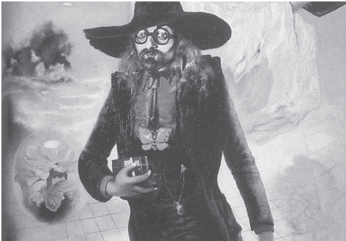
Maijas Tabakas gleznas "Valda Āboliņa portrets" reprodukcija

11. aprīlī plkst. 18.30 ar izstādes atklāšanu Kaņepes Kultūras centrā Rīgā, Skolas ielā 15, sāksies sarīkojumu cikls, kas veltīts māksliniekam Valdim Āboliņam.