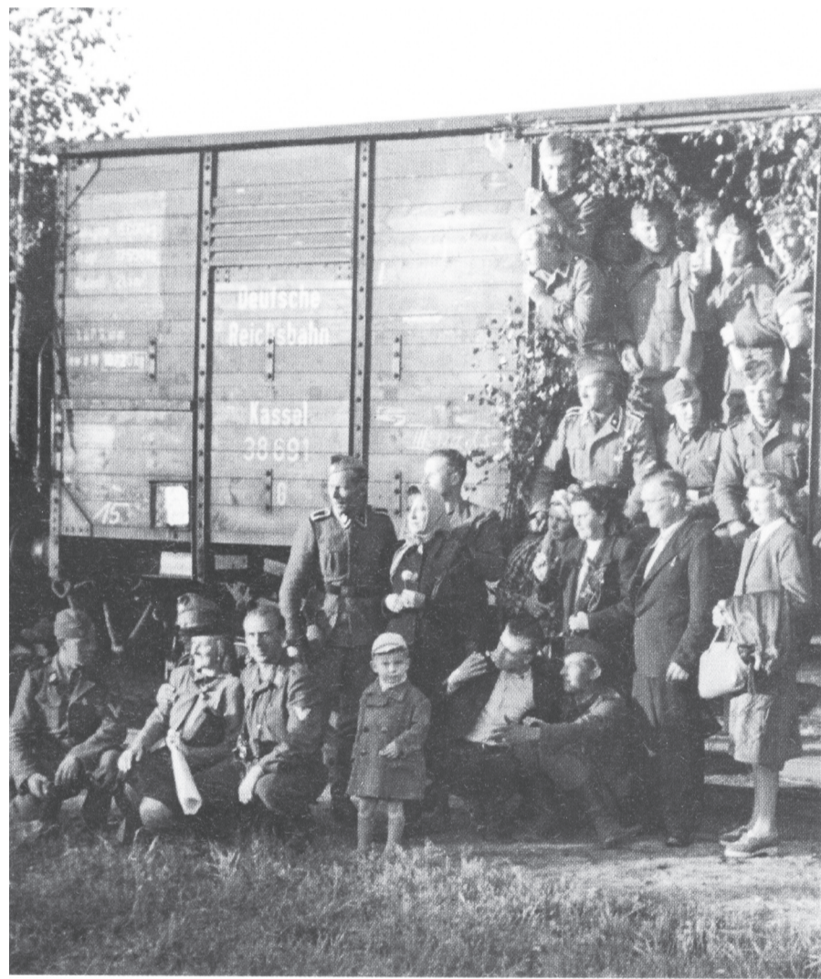
Latviešu leģionāru pavadišana uz Volchovu Austrumu frontē. 16. jūnijs.

Ar šo kauju tika likts pamats Kurzemes cietoksnim, jo 18. vācu armija kopā ar vācu 16. armiju, kuŗa bija iekļauta arī 19. divīzija, deva iespēju formēt Kurzemes cietoksni. Hitlerš pavēlēja armiju atstāt Kurzemē, lai tur piesaistītu lielus krievu armijas spēkus, kas tad nevirzītos uz Vācijas fronti. Par 19. divīzijas kaujas spējām vācu frontes vadība ziņoja: "No kaŗavīra līdz komandieriem tā ir labākā kaujas vienība Kurzemē, bet miera laikā tā var tapt politiski neuzticama ar neparedzamām sekām." Vācu