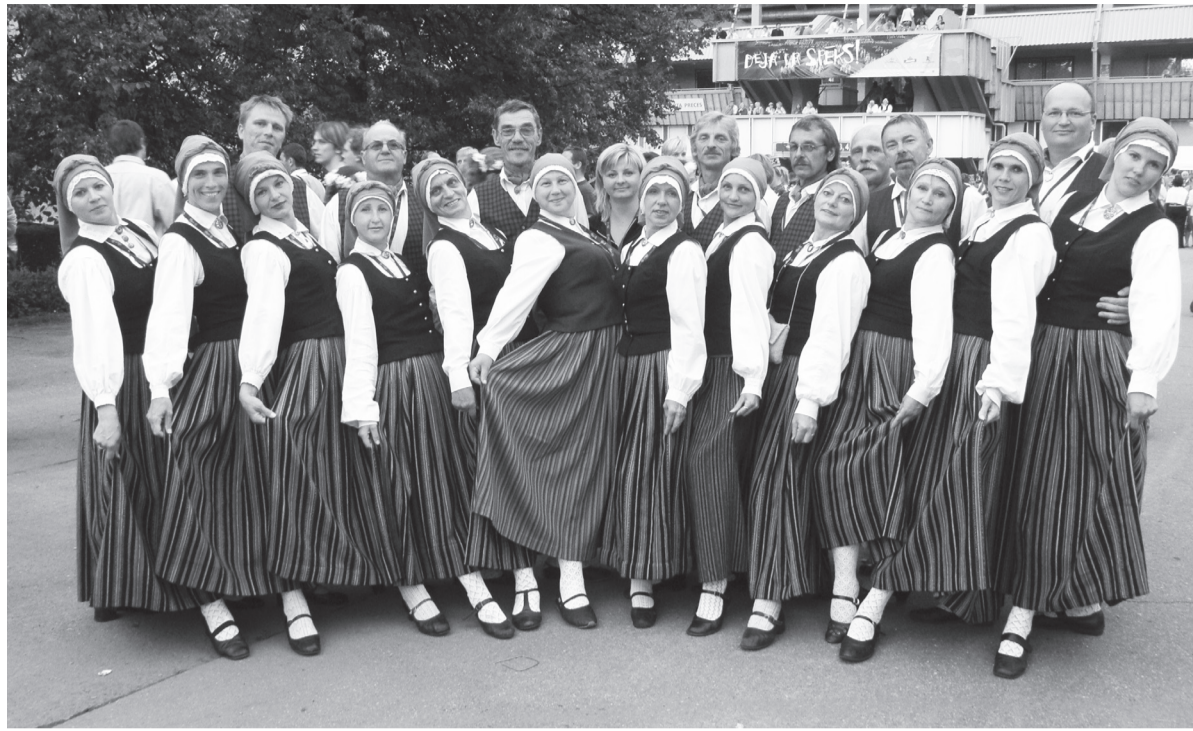
Deju kopa 2008. gada Deju svētkos

Abi dancotāji atceras, cik skaista ir tradīcija, pēc mēģinājumiem un koncertiem braucot sabiedriskajā transportā, dziedāt. Visi svētku dalībnieki dzied no sirds, pieskandinot tramvaju vai trolejbusu. Un pasažieri, kas gan nav svētku dalībnieki, aizrāviņi dzied līdz.