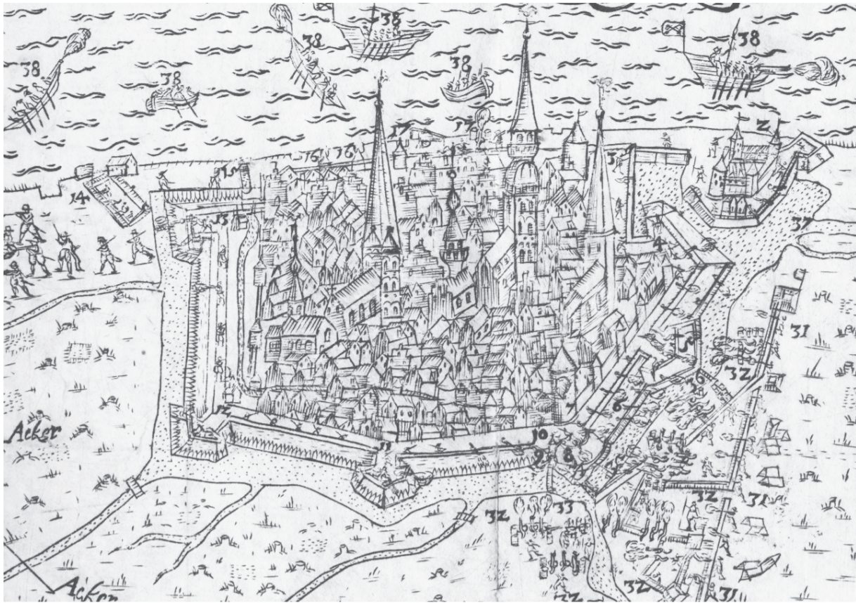
Kartes fragments ar Rīgas attēlu no izdevuma De expugnatione Civitatis Rigensis Livoniae Metropolis. - Rigae : per N. Mollinum, M.DC.XXII [1622].

Šogad apīrt 425 gadi, kopš Rīgā iekārtota pirmā grāmatu spiestuve, kas bija arī pirmais poligrāfijas uzņēmums tagadējās Latvijas teritorijā. Šim notikumam par godu 9. aprīlī plkst. 17.00 Latvijas Nacionālajā bibliotēkā (LNB), K. Barona ielā 14, tika atvērta izstāde Gedruckt zu Riga - „Iespīests Rīgā”, kas dod unikālu iespēju klātienē aplūkot senākajā Latvijas teritorijā iespīestās grāmatas no LNB un LU Akadēmiskās bibliotēkas krājumiem. Izstādi atklāja LNB direktors Andris Vilks ; izstādes viesus ar savu klātieni pagodināja arī UNESCO Starptautiskie eksperti (Esko Hakli, Vinstons Tabs, Erlands Koldings Nilsens, Abdelazizs Abids), kas bija ieradušies Rīgā, lai pārrunātu LNB darbības stratēģiju Gaismas pili .