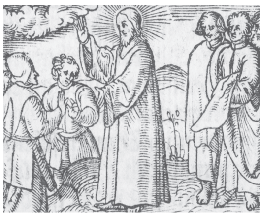
Kristus satiek mācekļus. Attēls no 1615. gada luterāņu rokasgrāmatas – pirmās latviešu valodā iespīestās grāmatas Rīgā

Grāmatu iespīšana Rīgā sākās 1588. gadā – aptuveni 120 gadus pēc Gūtenberga atklājuma. Pēc Rīgas rātes aicinājuma to uzņēmās holandietis Nikolajs Mollins, kas ieradās šeit no lielākā Eiropas grāmatniecības centra – Antverpenes. Rīgas un Latvijas kultūrā Mollina darbība ir ļoti nozīmīga. Būdam poligrāfijas nozares iedibinātājs, viņš 38 gadu laikā izdevis ap 200 iespīdarbu, galvenokārt latīņu un vā-