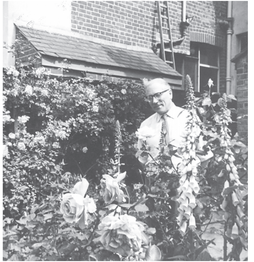
Savā dārzā Dallasā, Anglijā 1966. gadā

Viņa galvenās intereses, bez šaubām, bija mūzika. Komponējot viņš nesēdēja stundām ilgi pie klavierēm, izmēģinot visādus variantus. Viņš strādāja pie rakstāmā, jo mūziku dzirdēja iekšēji. Kad bija gatavs, viņš mums abām ar mammu spēlēja priekšā un tad varbūt kaut ko arī mainīja, ja viņam likās vajadzīgs. Tēvs gāja arī uz parku pastaigāties, kur topošo kompozīciju varēja pārdomāt. Vienreiz, izgulējies dienvidu, viņš pamodās un zināja, ka pasūtītais gabals ir nevis solistam, bet korim atbilstošāks. Tūlīt aizgāja un uzrakstīja. Kad tēvs Cēsis komponēja, viņš negribēja, ka es viņu traucēju. Viņš piekāra pie durvīm melnu termoforu, no kā man nez kāpēc bija bail.