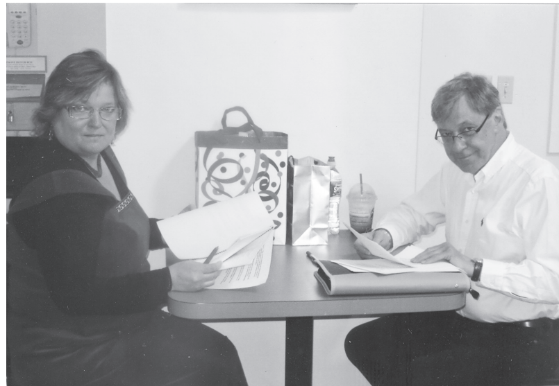
Kopā ar Daci, gatavojoties priekšlasījumam par latvju sētu Bostonas latviešu skolā

Kolēģas – ārsti Latvijā ir augsti profesionāli. Es apbrīnoju viņu spējas strādāt garā darba stundas, bieži vien ar tālaika tehnoloģiju. Malači, cepuri nost! Tas acimredzot ir latviešu pozitīvais gars, kas ļauj viņiem ne tikai to visu izturēt, bet