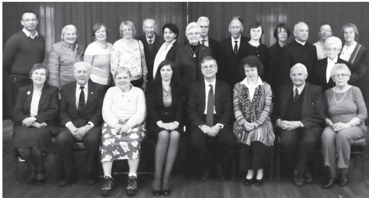
Latvijas evaņģeliski luteriskās Baznīcas Lielbritanijā 64. Sinodes dalībnieki un viesi

LELB Latviešu draudzes Īrijā priekšnieka vietiece un mantzine