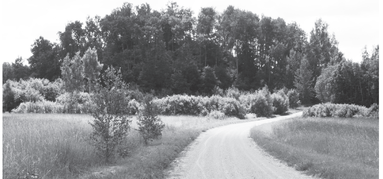
Viens no iespaidīgākajiem Sēlijas pilskalniem - Pormaļu Sudrabkalns (26 m augsts) ir Latvijas arhαιoloģijas pieminēklis