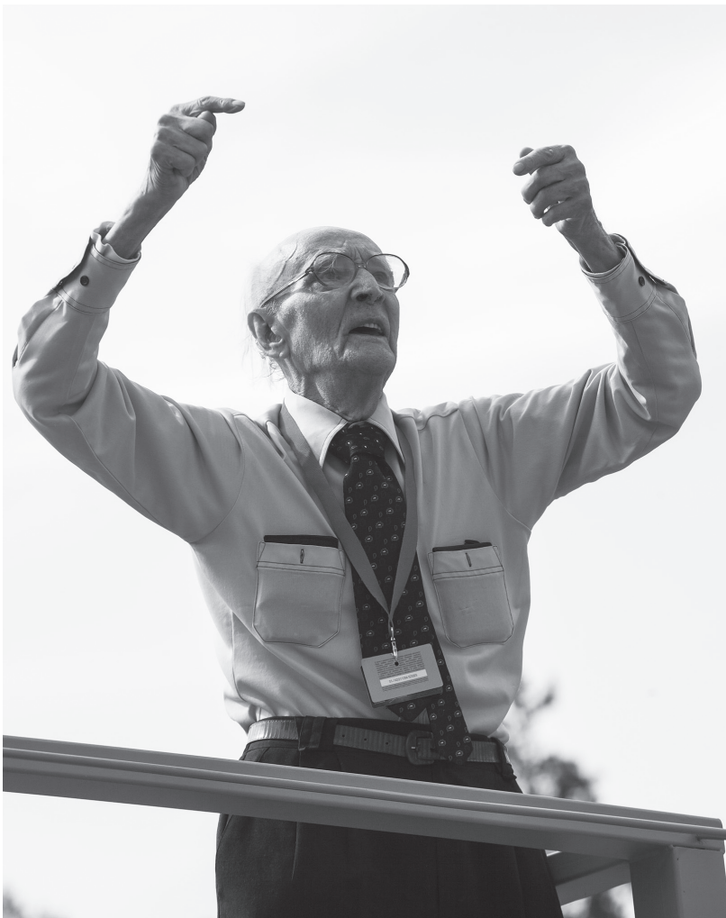
Maestro bez frakas. Dirigējot mēģinājumā

Uzplaucis latviešu kultūras skaistākais zieds (8. lpp.)