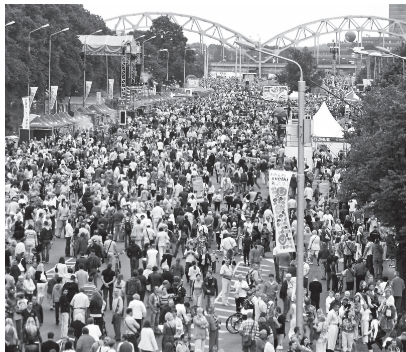
Rīdzinieki un Rīgas viesi svētdienas - 18. augusta vakarā 11. novembra krastmalā

Rīgas domes Izglītības, kultūras un sporta departamenta atbalstu Rīgas svētkus visas sestdienas gaŗumā kuplināja ar siena leļļu teātra brīvdabas izrādi “Brīnumi kāpostos” - oriģinālu interpretāciju par teātri senatnē lauku sētā. Tieši oriģinālu – jo par siena teātri nekur nekas pasaulē vēl nav dzirdēts.