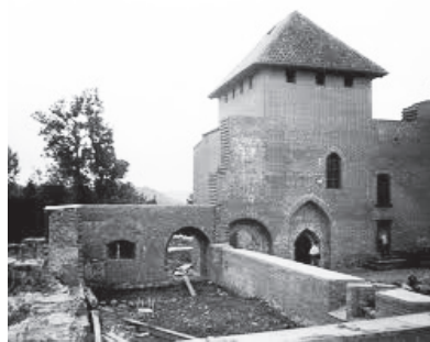
Turaidas pils fragments

Turaidas mūzejrezervāts sadarbībā ar Latvijas Universitātes Latvijas vēstures institūtu 29. augustā rīko starptautisku zinātnisku konferenci „Pils. Arhαιoloģija. Mūzejs. Arhαιologam Jānim Graudonim - 100”.