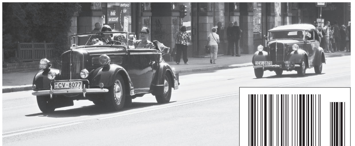
Antīkie auto Brīvības ielā