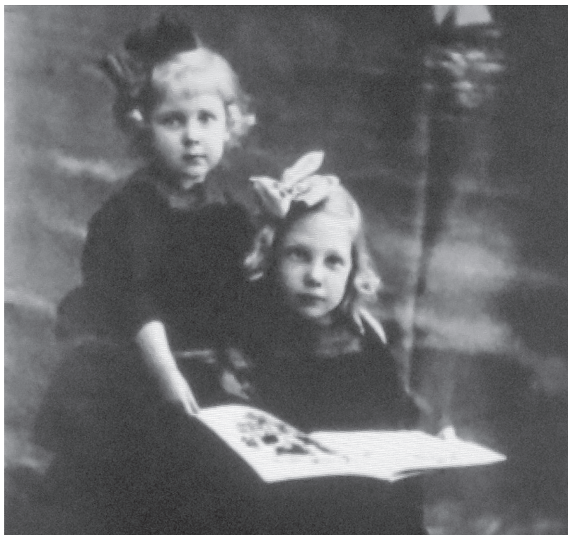
... un kādreiz bērībā

skaisto „ideālo Latviju”, bet ļoti, ļoti gribēju būt šeit klāt un redzēt, dzīvot līdz tam, kā Latvija atkopjas no piecdesmit šausmu gadiem. Redzu un jūtu, ka tautā gruzd patriotisms. Redzu arī, ka Latvijas Saeimā tas ir pazudis. Lēni domā, lēni strādā... Divus gadus lemj par Pilsonības liku- mu, kašķējas, strīdas. Bieži domā- ju par to, ka laikam taču vajag otru Ulmani! Diktātors? Bet es teiktu – labdarīgs diktātors. Lī- dzīgi kā Spānijā Franko, kuŗam arī tauta ceļā kaisīja puķes. Pati biju klāt, kad viņš valējā „vāģi” brauca pa Madrides ielām, tautas sumināts. Un atminos Ulmani,