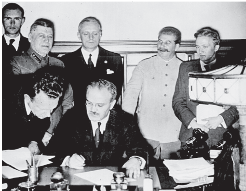
Molotova-Ribentropa akta parakstīšana 1939. gada 23. augustā

1994. gadā Latviju atstāja Krievijas (bijušās PSRS) militārais kara spēks. Vai Hitlera-Staļina pakta darbība beidzās? Nē, jo tam bija „cena” – 1994. gada 30. aprīļa „Līgums par Krievijas Federācijas Bruņoto spēku izvešanas no Latvijas Republikas teritorijas nosacījumiem, termiņiem un kārtību un to tiesisko stāvokli izvešanas laikā”, kuŗa