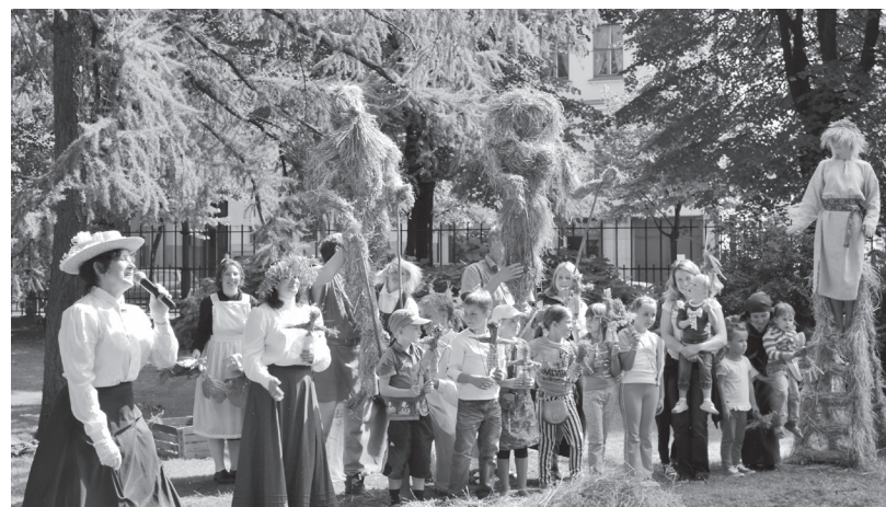
Siena teātris Vērmanes dārzā