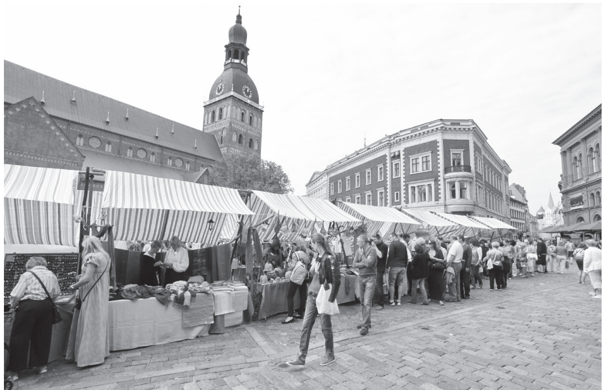
Tautas daiļamata meistari piedāvā savus darinājumus svētku tirdziņā Doma laukumā

*** Tāpat kā Rīgas svētku norises Vērmanes dārzā jau kļuvas tradicionālas, tā arī Rīgas Latviešu biedrības “Sprīdīša skolas” rosīšanās šeit ir gaidīts notikums, kas katru nākamo gadu (ši vasara ir jau ceturta) saista arvien plašāku skatītāju un dalībnieku pulku. (“Sprīdīša skola” - RLB Folkloras komisijas ilggadējs projekts – izglītojoša, atraktīva tradicionālās kultūras programma sākumskolas skolēniem, kuŗas ietvaros dalībnieki iesaistās izziņātājas mākslas, mūzikas un deju nodarbībās par kādu noteiktu tematu). Tā kā TEĀTRIS bija izraudzīts par vienu no 2013. gada Rīgas svētku pamattemām (sasaistē ar komponista Richarda Vāgnera 200 gadu jubileju un viņa saikni ar toreizējo Rīgas pilsētu (Vācu) teātri un rakstnieka Rūdolda Blaumaņa 150 gadu jubileju), tad “Sprīdīša skola” ar