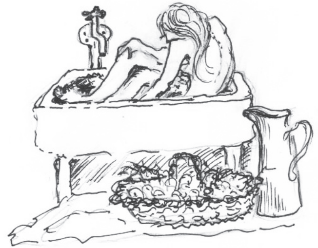
Dzidra „vannojas” sakņu silē. Zīmējusi Sarmīte Erenpreiss-Janovskis

„Nevarēju gulēt, domādama, kā iztiksim, kamēr jūs būsiet pilsētā. Tas ļoti labi, ka uzcēlies agrāk. Varēsi sakārtot mūsu guļamistabu. Parūpēties par brokastīm, apmazgāt traukus. Autobuss no ciema uz pilsētu atiet desmitos. Miesnieka sieva ieradīsies vienpadsmitos. Viņa gatavos pusdienas. Tā kā atpakaļceļā no pilsētas autobuss ciemā pietur pirms pieciem, tad launaglaikā, ja vien pieliksī soli, būsiet mājās. Ēdisim kaut ko tādu, ko var ātri sagatavot. Ernests va-