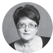
MĀRA ZĀLĪTE, dzejniece

Egila Levita ierosinājumu par Preambulu mūsu valsts Pamatlikumam es uztveru par labāko iespēju veikt plašu valsts un sabiedrības vērtību auditu, kas šobrīd ir nepieciešams. Nepieciešamību rada 21. gadsimta globālās pārmaiņas, kā arī atjaunotās valsts pieredze. Tāpat arī visai pesimistiskās nākotnes prognozes, kas izskan publiskajā telpā, liek mums šodien pārcilāt un pārdomāt Latvijas valsts jēgu un būtību. Saprast, kas piemirsies pašiem un kas atgādināms citiem, lai valsts pastāvētu un attīstītos tajā virzienā, kas atbilst dibinātāju ideāliem un iecerēm, kā arī Latvijas valsts atjaunotāju un pēcteču interesēm. Konstatēt nobīdes. Aktualizēt būtību. Apcerēt jēgas zudumu, ja kādam tā liekas pazudusi, vai pavēstīt Latvijas valsts pastāvēšanas jēgu kā jaunumu tiem, kam tā nekad nav bijusi saprotama.