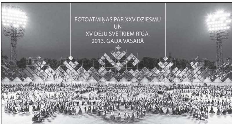
FOTOATMIŅAS PAR XXV DZIESMU UN XV DEJU SVĒTKIEM RĪGĀ, 2013. GADA VASARĀ