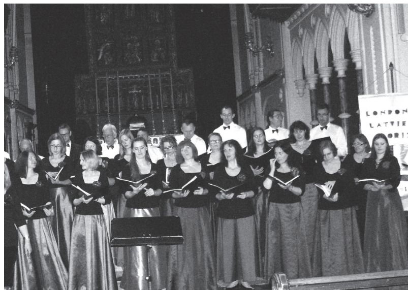
Londonas latviešu koris

Londonas latviešu koris vairāk nekā sešdesmit gadu ilgajā pastāvēšanas laikā ir piedzīvojis posmus, kad pietrūcis vīru balsu, un tas bija manāms arī šoreiz. Šķiet, bija tikai četri vai pieci tenori. Šo balsu trūkumu īpaši varēja manīt Jāzepa Vītola dziesmā Gaismas pils . Varbūt vareno Gaismas pili , kuŗai starp dziesmām ir sevišķa vieta un no-