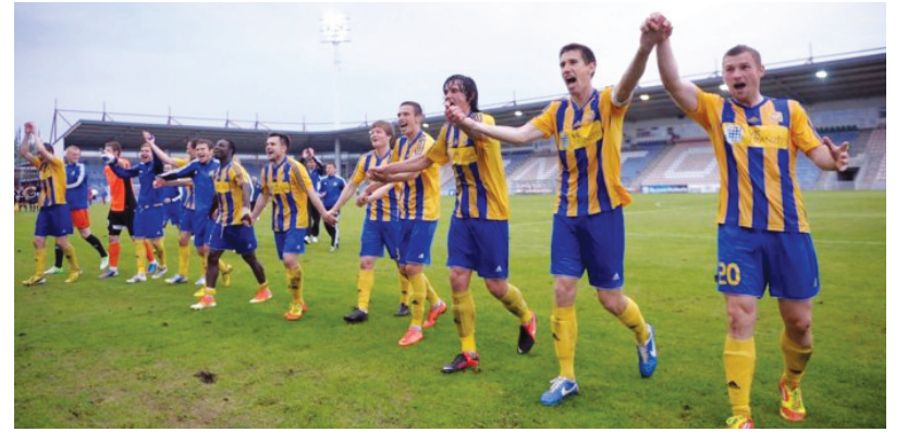
Ventspils futbolisti priecājas par uzvaru

Bardelis ir iecerējis sasniegt jaunu Ginesa rekordu, veicot visgarāko distanci ar skrituļslidām.