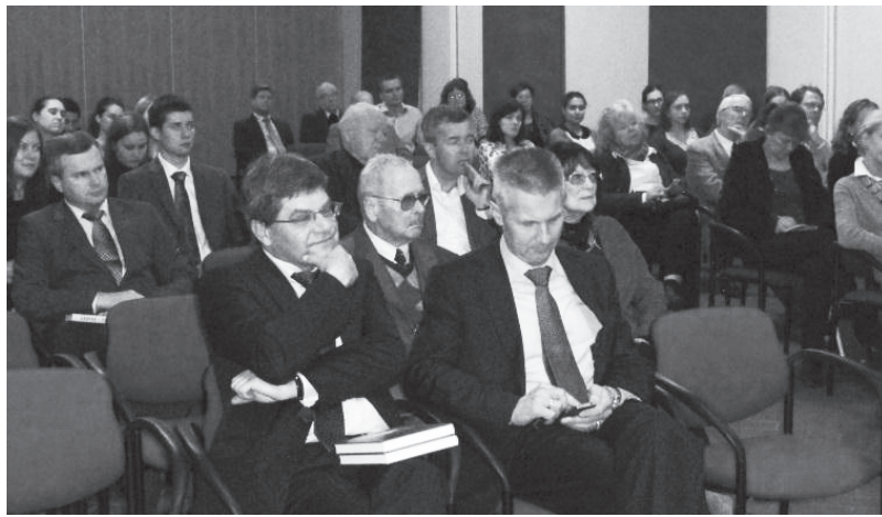
Polijas vēstnieks Jeržijs Mareks Novakovskis un aizsardzības ministrs Dr. Artī Pabriks