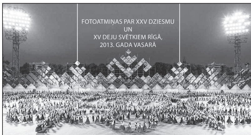
FOTOATMIŅAS PAR XXV DZIESMU UN XV DEJU SVĒTKIEM RĪGĀ, 2013. GADA VASARĀ