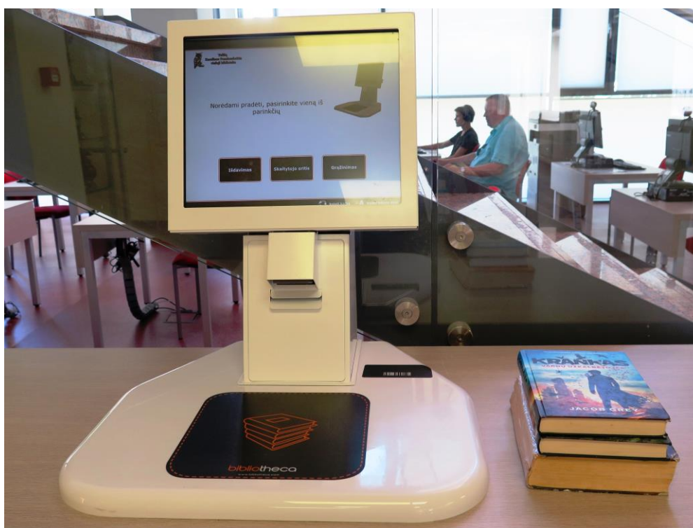
Pašapkalpošanās iekārta Telšų Karolinos Praniauskaitės regionālajā publiskajā bibliotēkā