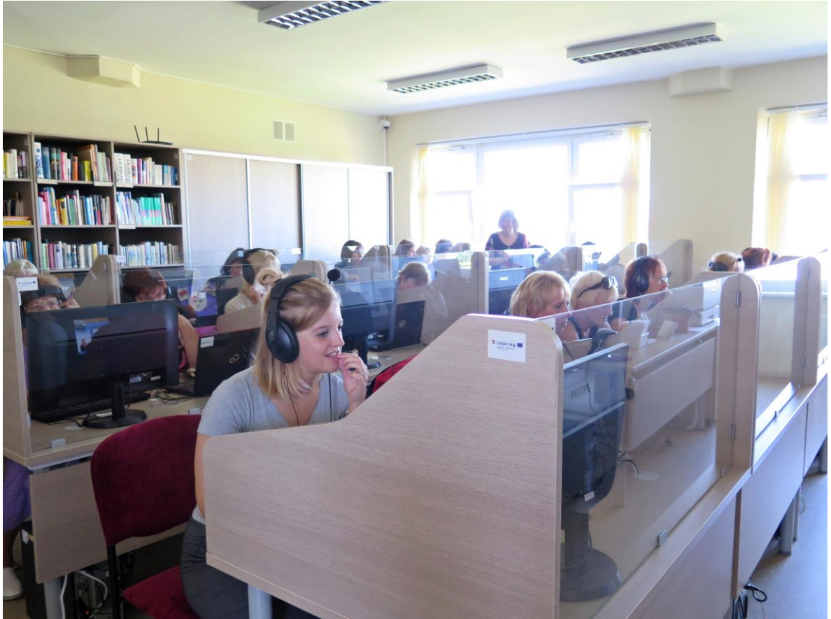
Valodu apmācību klasē Šauļu pilsētas bibliotēkas filiālē Saule