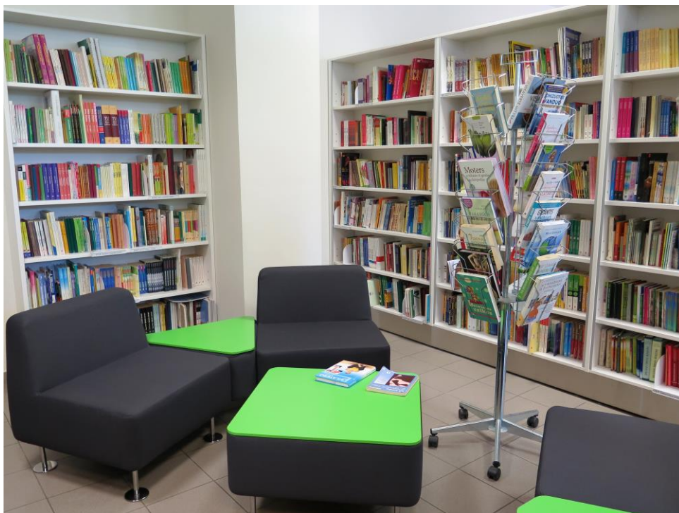
Povilas Višinskas Šauļu rajona bibliotēkā