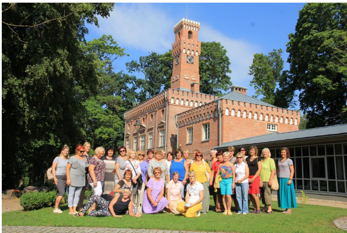
Pieredzes apmaiņas dalībnieki pie Pluņģes bibliotēkas 01.08.2018.