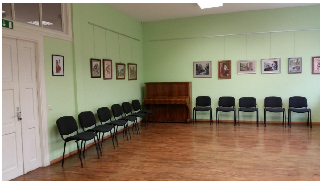
Izstāžu telpa Kazdangas pagasta pārvaldes ēkā, kur atrodas arī Kazdangas pagasta bibliotēka.