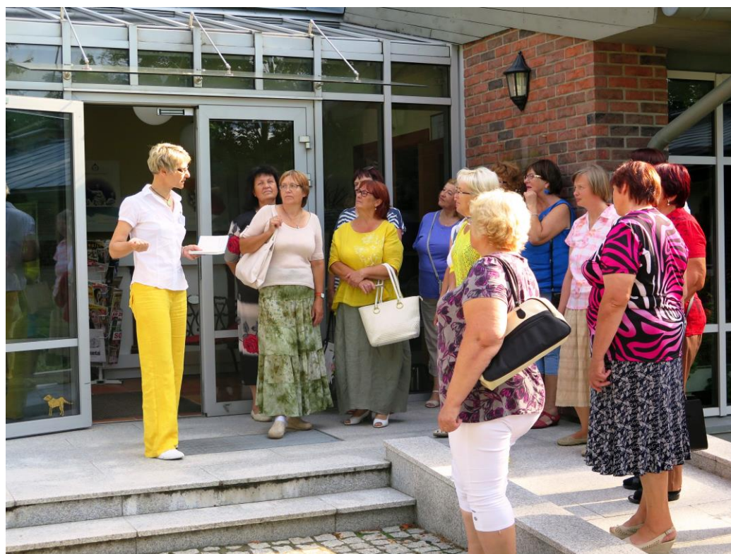
Pluņģes bibliotēkas vadītāja iepazīstina ar bibliotēku