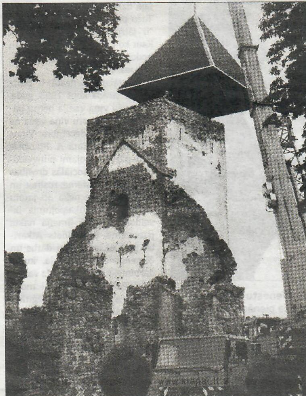
Gramzdas evaņģēliski luteriskās draudzes dievnama atjaunošana 2011. gadā.

Gramzdas pagasta vēsture iestiepjas senā pagātnē. Šeit ir gan dzīvojuši, gan strādājuši dažādi nozīmīgi cilvēki – rakstnieki Sudrabu Edžus, Alfrēds Leja, Arvīds Dobelis, baptistu mācītājs Ēvalds Rimbenieks – Latvijas finanšu ministrs, Saeimas deputāts un