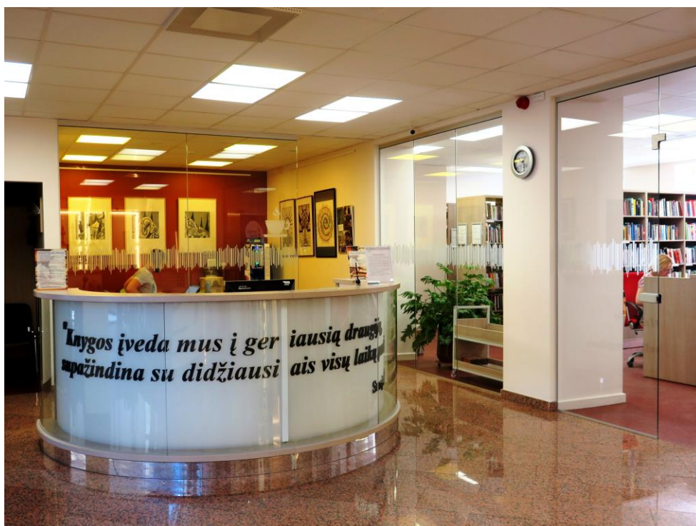
Telšų Karolinos Praniauskaitės regionālās publiskās bibliotēkas lasītāju apkalpošanas nodaļa