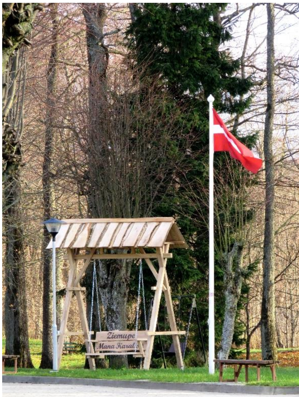
Jaunās šūpoles, kas ierīkotas pie Ziemupes bibliotēkas