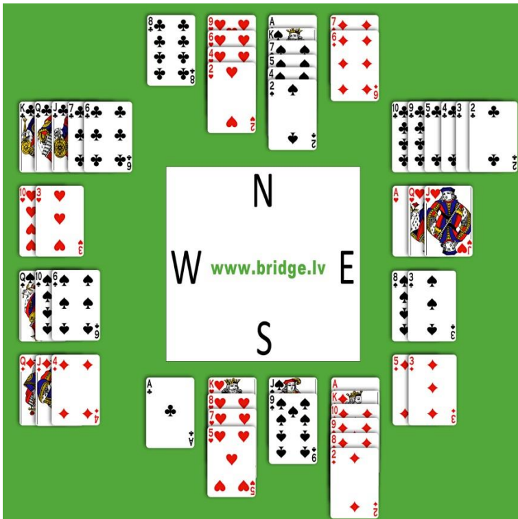
Sadalījums Nr.18, daļa East, zonā NS

Pirmajā dienā tika izspēlēta kvalifikācija, pēc kuras Latvijas U-25 un Igaunijas U-25 tikās finālā. Finālā tika aizvadīti 3 segmenti, katrs segments pa 10 sadalījumiem. Pēc pirmā segmenta Igaunija zonālā šlema dēļ 4.sadalījumā, ieguva septiņu IMPu vadību – 26:19. Otrajā segmentā viss nostājās savās vietās: