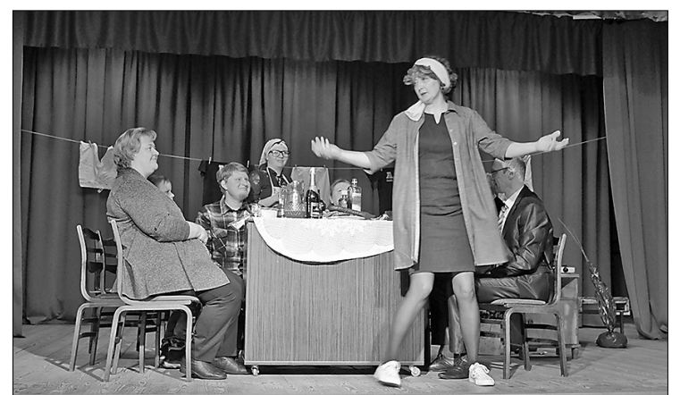
Ar grāmatas «Kas bez iuzu – tys bez bādys!» saturu iepazīstina Rušonas amatierteātra «Iz siņņa» aktieri.

Biedrības jaunieši pateicas visiem pasākuma dalībniekiem un palīgiem – Ambeļu amatierteātrim,