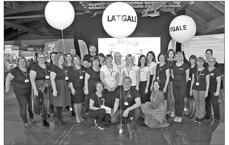
Latgales stenda veidotāju komanda tūrisma izstādē «Balttour 2019»

Ik gadu visu Latgales tūrisma informācijas centru pārstāvji apvienojas vienā kopīgā stendā, lai stāstītu ne tikai par sava novada tūrisma piedāvājumu, bet arī prezentētu Latgali kā vienotu galamērķi. Šogad Latgale sevi izstādes apmeklētājiem prezentēja jaunā veidolā, tādējādi izceļot savu mazāk iepazīto pusi. Mainījās kopīgā stenda vizuālais noformējums, kas kļuvis kompaktāks, caurredzamāks un «vieglāks». Stendā dominēja baltā, melnā un zaļā krāsa, kas veiksmīgi sasauca ar stenda centrālo rotu, par kuru izstādes norises laikā kļuva jaunā tūrisma objekta «Moto & Metal