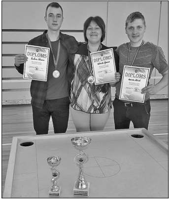
Nepārspēti šogad palika mājiniķi – galēniešu novusa komanda.

Kā jau katru gadu, pirms pavasara iestāšanās galēnieši savā skolas sporta zālē uzņem novusa spēlētāju komandas. Šogad bija ieradušās sešas komandas.