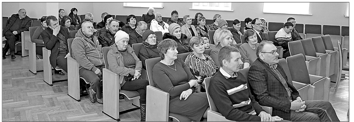
Skatīliski visvairāk uz tikšanos ar novada domes priekšsēdētāju, deputātiem un domes administrāciju ieradās Stabulnieku pagasta iedzīvotāji.

Februāra divās pēdējās dienās – 27. un 28. februārī novada iedzīvotāji pulcējās pagastu centros uz tikšanos ar novada domes vadību, deputātiem un domes speciālistiem.