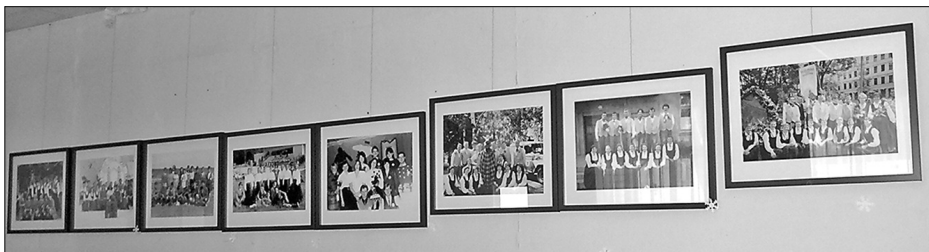
Projekta rezultātā tapusi foto izstāde, kas vēl visu martu ir aplūkojama Rušonas sabiedriskajā centrā Aglonas stacijā.

Mazo grantu projektu konkursam «Mēs Latvijas 100-gadei» Riebiņu novada pašvaldības finansējumu 2018. gadā saņēma Rušonas pagasta iniciatīvas grupa «Dejā ir spēks».