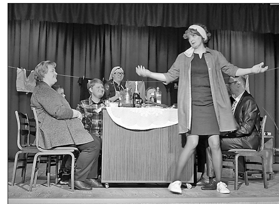
С содержанием книги «Kas bez iuzu – tys bez bādys!» знакомят актёры Рушонского любительского театра.

приобрести новейшие книги на латгальском языке и сфотографироваться в специально созданном фото уголке. После представления все театральные коллективы были приглашены на праздничный пирог, а бал с группой «Ivartīns» продолжался до первых петухов.