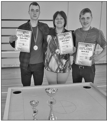
Непревзойдёнными в этот раз остались хозяева – галянская команда по новусу.

Как и каждый год, в начале весны в спортивном зале Галянской основной школы проходят соревнования по новусу. В этом году на соревнования прибыли шесть команд.