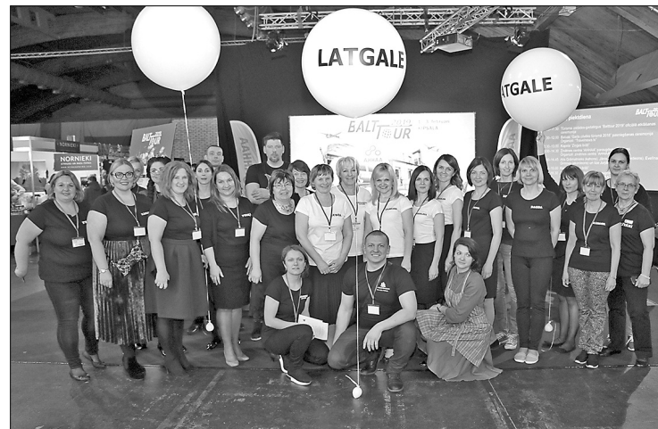
Команда создателей стенда Латгалии на выставке туризма «Balttour 2019».

Ежегодно все представители центров туристической информации Латгалии объединяются в общем стенде, чтобы рассказать не только о предложениях своего края, но и представить Латгалию как единую конечную цель путешествий. В этом году Латгалия представила в новом образе, подчёркивая свою менее знакомую сторону. Изменилось художественное оформление общего стенда, который стал компактнее и «легче». На стенде доминируют белый, чёрный и синий цвета, которые удачно перекликаются с центральным украшением стенда, которым в ходе выставки стали экспонаты нового