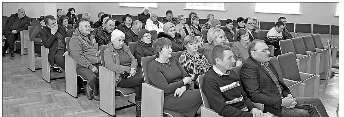
Наибольшее число жителей, пришедших на встречу с председателем, депутатами и администрацией краевой думы, было в Стабулниекомской волости.

В последние дни февраля – 27 и 28 февраля жители края собирались в центрах волостей на встречи с руководством, депутатами и специалистами краевой думы.