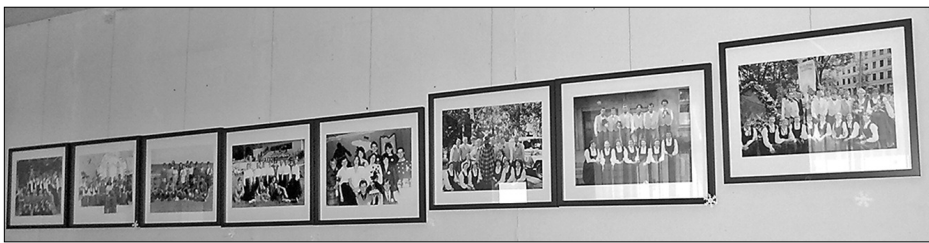
Результат проекта – фотовыставка, которую в марте ещё можно увидеть в Рушонском общественном центре на станции Аглона.

В конкурсе проектов малых грантов «Мы – столетию Латвии» в 2018 году финансирование самоуправления Риебиньского края получила инициативная группа Рушонской волости «В танце – сила».