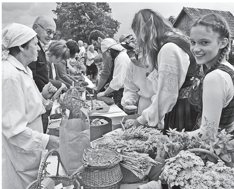
Cepēji rosās pie svētku maizes galda