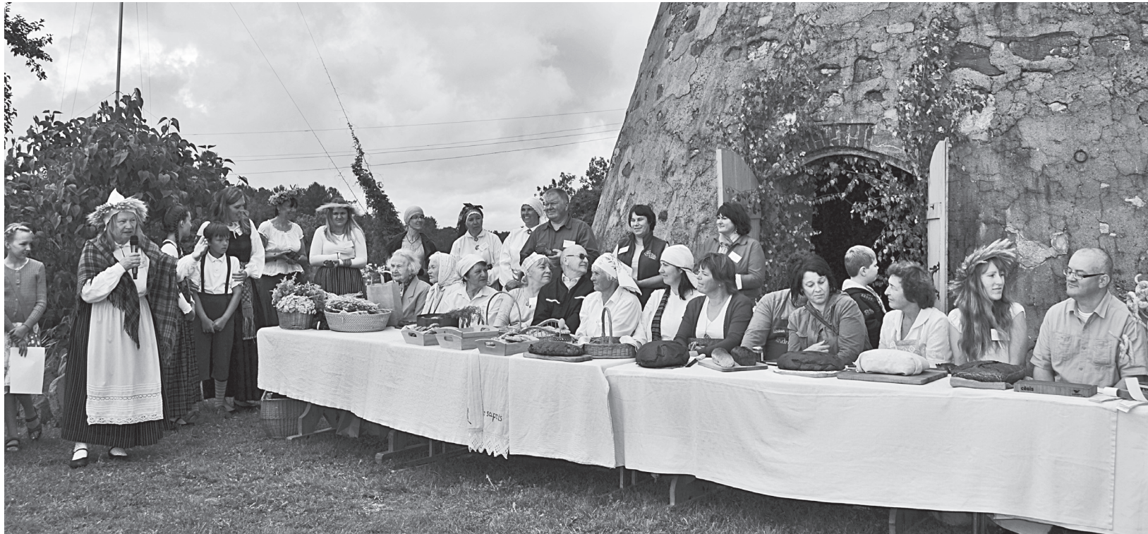
Maizes cepēji pie svētku maizes galda

Pirmie Jēkabi bija maziņi, bet ļoti dvēseliski. Piedalījās aptuveni 150 – 200 cilvēku. Pašceptā maize ikdienā uz galda nebija tik populāra, bet interese par to bija un pieauga.