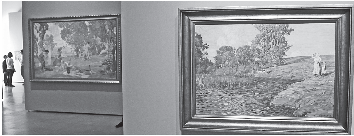
Skats no izstādes

“Un, ja Rozentāla gleznu hipnotiskā iedarbe mani nav zudusi līdz šai dienai, tad ne tādēļ, ka šīs gleznās būtu uz audekla virsmas kāda fascinējoša apdare, kāda izcila virtuozitāte, kompozicionāla asprātība vai rafinēta tonalitate. Kādas izcilas šeit minētās īpašības šīs gleznās nav, un tādas tur arī nav jāmeklē. Ne gleznu formālajās īpašībās viņu spēks, un ne formas sasniegumi mani valdzināja, bet gan to tīri