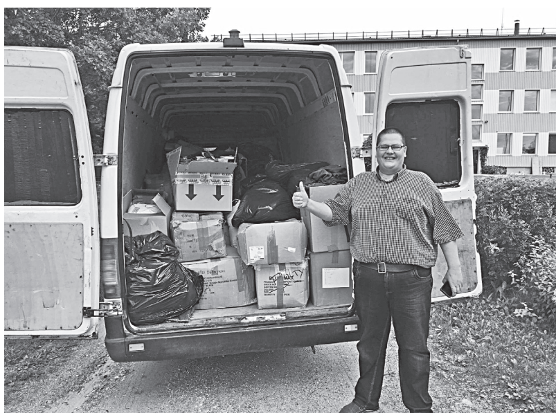
Busiņš ar ziedojumiem ceļā uz Latviju

Kā allaž lielākās grūtības akcijas organizēšanā sagādāja gandrīz pustonnu smagās kravas nogādāšana Latvijā, kas tomēr izdevās, pateicoties dažiem reti un pašizliedzīgiem pārvadātājiem starp Angliju un Latviju – "Pakubuss.lv"