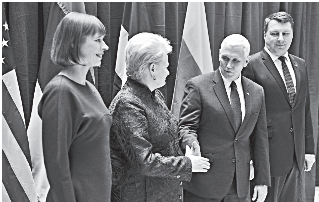
Igaunijas prezidente Kersti Kaljulaida, Lietuvas prezidente Daļa Grībauskaite, ASV viceprezidents Maiks Penss, Latvijas prezidents Raimonds Vējonis Minchenes konferences laikā

Pēc Baltijas valstu prezidentu un ASV viceprezidenta Maika Pensa tikšanās Valsts prezidents Raimonds Vējonis uzsvēra, ka Baltijas valstu un ASV stratēģiskā sadarbība ir nemainīgi spēcīga. Latvijas un Baltijas valstis ir gatavas ne tikai saņemt palīdzību no ASV, bet arī gatavas sniegt palīdzību ASV un citiem NATO partneriem cīņā pret terorismu dažādās pasaules vietās, sniedzot humāno palīdzību un apmācot drošības spēkus Irakā un Afgānistānā. Valsts drošības un aizsardzības jautājumi ir būtiska Latvijas prioritāte. Palielinot valsts budžeta finansējumu valsts aizsardzībai, nākamajā gadā tas saņiegs 2% no iekšzemes kopprodukta atbilstoši saistībām NATO.