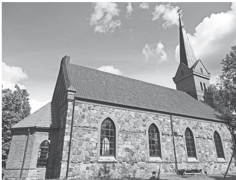
Dievnamas vidū – ciems apkārt. Neogotikas arhitektūras stilā būvētā Ropažu ev. lut. baznīca. Celta 1893. gadā pēc Gotfrīda Krona projekta

Vispirms mājdzīvnieks ieinteresēti apstaigāja solu rindas, apskatot, kas tie ir par ļaudīm, kuŗi ieradusies uz dievkalpojumu. Pēc tam minka cienīgā gaitā aizgāja līdz altārim, arī tur visu apskatot, un visbeidzot apgūlās kādā kluksākā stūrītī, visu laiku uzmanības centrā paturot savu saimnieci. Iespējams, šo rindu lasītājs būs izbrīnījies: sak, kas tie par jokiem!