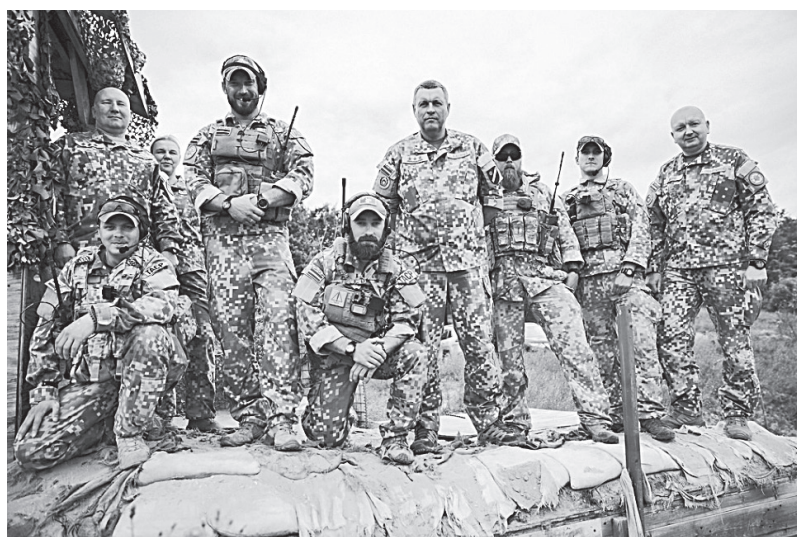
NBS komandieris, apmeklējot mācības “Northern Strike”, tiekas ar Latvijas gaisa atbalsta kontrolieriem

iedzīvotāju skaita, kas bija pakļauti iesaukumam. Un šie 12% uzskatāmi par signālu no Latvijas sabiedrības, ka šādā veidā, es pat teiktu, represīvā, labs rezultāts nav iespējams. Un vēl – pats svarīgākais arguments – finansiālais. Tātad ir vajadzīgs Saeimas lēmums par obligāto karadienestu valstī, kam attiecīgi seko uzdevums valdībai paredzēt iespaidīgus budžeta līdzekļus tā nodrošināšanai. Turklāt vēl laiks un līdzekļi, lai apmācītu virsniekus un instruktorus utt. Šobrīd nav pieļaujams, ka tiktu samazināti līdzekļi Zemessardzei, Bruņoto spēku plānotajai attīstībai saskaņā ar mūsu apņemšanos NATO priekšā par dalību starptautiskajās operācijās. Vispār esmu pārliecināts Zemessardzes kā brīvprātīgas struktūras patriots, jo tikai uz brīvprātības principiem varam iegūt kvalitatīvu papildinājumu Latvijas sargiem. To arī pierāda pilsoniskā līdzdalība Zemessardzē, kas turklāt ik gadu par 10% atjauno savas rindas. Šogad līdz 1. novembrim tās papildinājušās ar 700 jauniem zemessargiem. Šai struktūrā darbības laiks ir vidēji astoņi gadi (kamēr obligātā karadienestā –10 mēneši), ik gadu notiek 30 dienu nometnes, kur zemessargi profesionāli