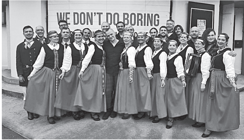
Sadraudzības sarīkojumā Mansfeldā ( Mansfield ) kopā ar “Jauno Jāņu orķestri”