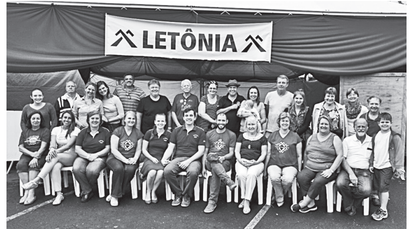
Brazīlijas Latviešu Kultūras apvienības biedri

tā ļaujot kopai svešumā pārstāvēt visu Latviju. Kopa dzied un spēlē melodijas no Kurzemes krasta līdz Latgales austrumu robežai, kā arī melodijas, kuŗas ir pierakstītas ārpus Latvijas robežām. 2017. gadā iznāca kopas piektais albums “Svešu zemi staigādams”.