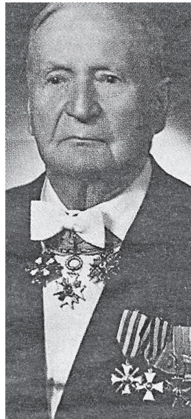
Fridrichs Zommers Vasarietis

Kā iepriekšējā, tā arī šai sanāksmē “pilsoņi” vairs neprasiņa savas “platformas” atzīšanu, bet lika priekšā atstāt valsts iekārtas noteikšanu ievēlamai satversmes sapulcei. Sociāldemokrāti tam piekrita, zinādami, ka vispārējās vēlēšanās “pilsoņiem” būs noteicošs vairākums. Tāpēc viņi pastāvēja uz to, lai 18 vīru komiteja vienotos par tādu “platformu”,