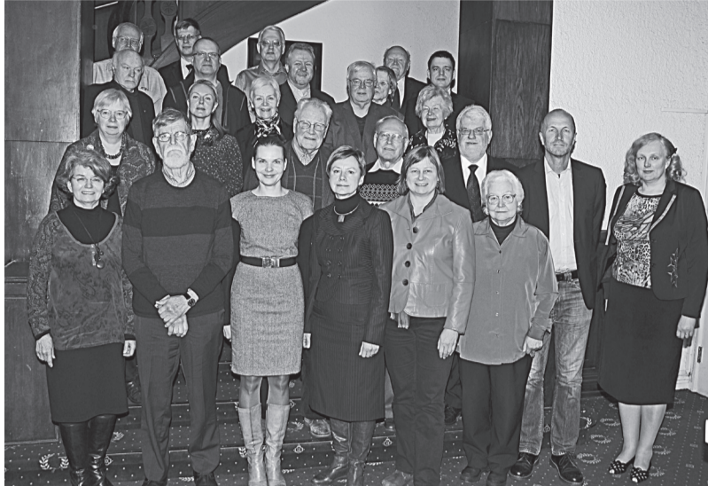
Latvijas Okupācijas muzeja biedrības biedri 2015. gada janvārī

Tad cilvēki sāka prasīt, kur gan esot pats muzejs, jo uz plakāta skaidri lasāms FONDS. Prātoja pat, ka te kāda šaubīga banka, jo tādas toreiz Rīgā bija gandrīz ik uz stūra. Parādījās un pazuda ar visu naudu. Labi, ka OMF nepazuda, un ziedotā nauda arī ne. Taču diezgan drīz izlēma, ka fonds ir fonds un muzejs ir muzejs. Lai gan saistīti, tie nav viens un tas pats. Fonds, kā Latvijā saka, ir "juridiska persona", bet Muzejs – "struktūrvienība". Komplīcēti, bet kaut kā strādā. Tā nu tapa OM un LOM, ko lieto vēl līdz šai dienai. To gan nevar vairs teikt par pašu OMF. Tas oficiāli paglābies tikai latviskajā