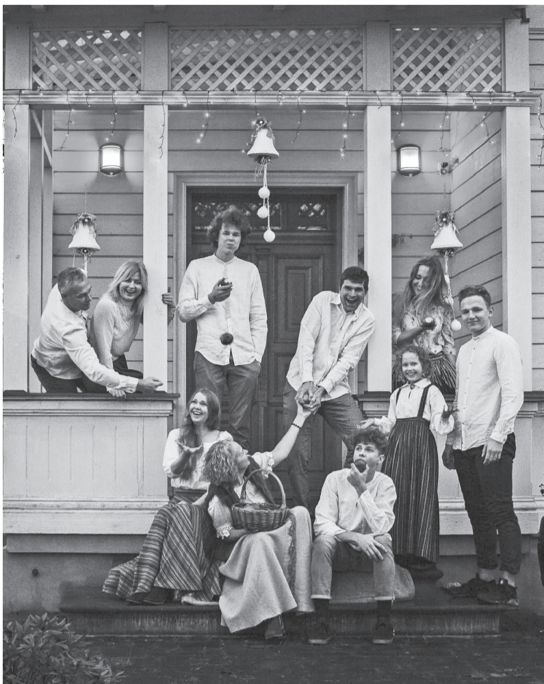
3x3 Zaļenieku radošā darba grupa