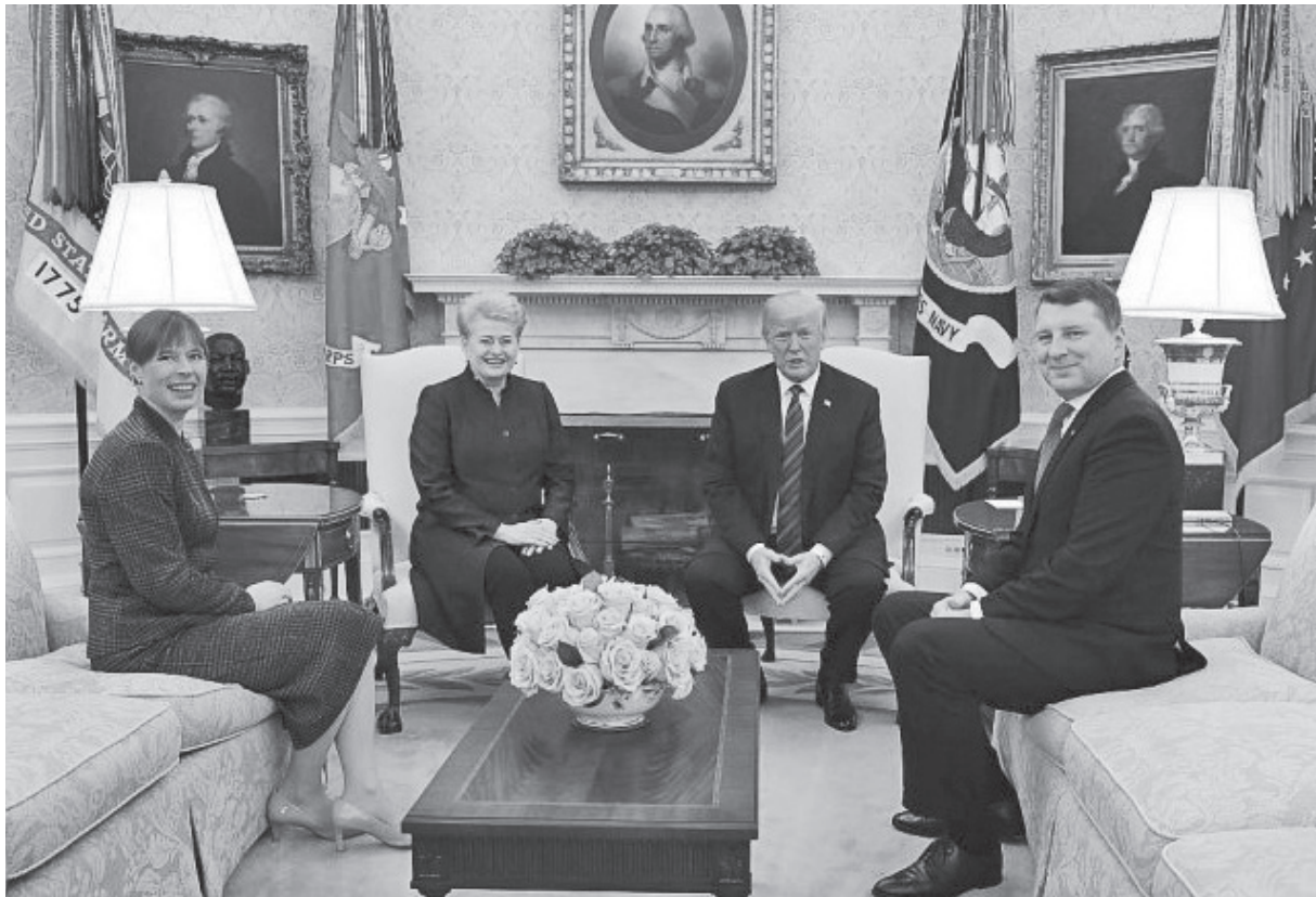
Triju Baltijas valstu prezidentu tikšanās ar ASV prezidentu Donaldu Trampu. No kreisās: Igaunijas prezidente Kersti Kaljulaid, Lietuvas prezidente Daļa Gribauskaite, ASV prezidents Donalds Tramps, Latvijas prezidents Raimonds Vējonis

Par Baltijas valstu prezidentu vizīti ASV ziņojām jau mūsu laikraksta iepriekšējā numurā. 3. aprīlī visu trīs Baltijas valstu prezidenti un Tramps Baltajā namā tikās pusdienās. Pusdienas nori-