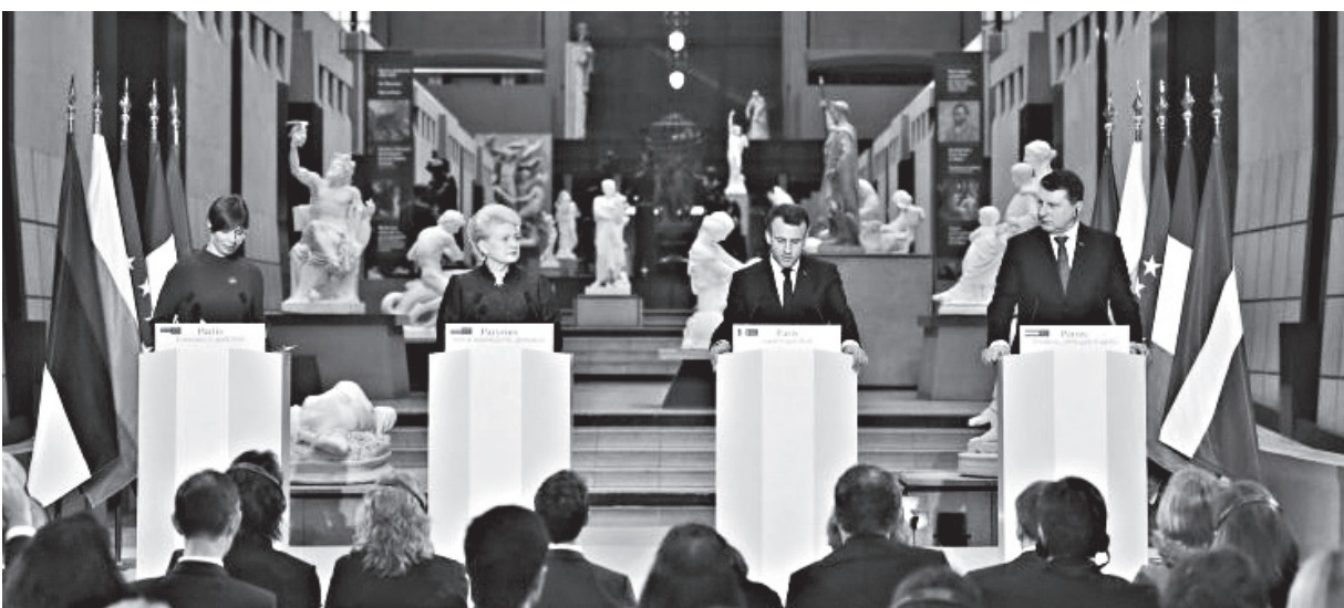
Triju Baltijas valstu prezidenti Parīzē, Orsē muzejā

Beidzot simbolisko trīs Baltijas valstu prezidentu vizīti ASV un Francijā, Valsts prezidents Raimonds Vējonis tikās ar Francijas prezidentu Emanuelu Makronu un Ekonomiskās attīstības sadarbības organizācijas (OECD) ģenerālsēkretāru Anhelu Guriju. "Latvijai ir svarīgi būt daļai no aktīvās Eiropas, daļai no nākotnes disku-