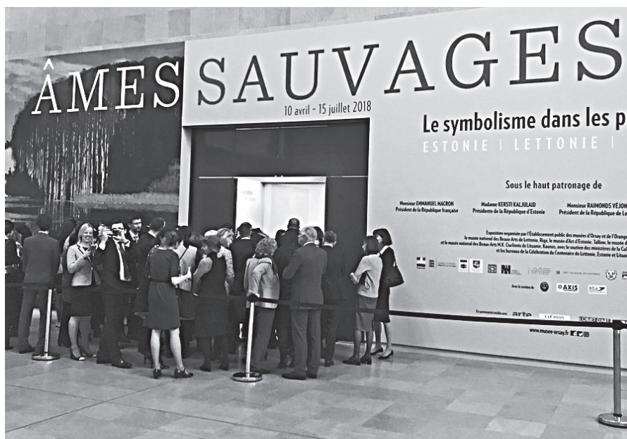
Apmeklētāji steidz iepazīt Baltijas valstu mākslu izstādē “Nepieradinātās dvēseles”

Izstādei ir trīs daļas: “Miti un leģendas”, “Dvēsele” un “Daba”, un tā sniedz ieskatu mākslas ainā no 1890. līdz 1920./30. gadiem, apliecinot patiesību, ka Baltijas valstu simbolisms ir cieši saistīts ar Eiropas kultūras un mākslas norisēm.