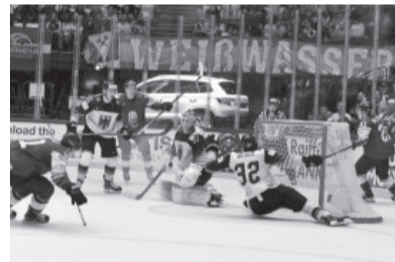
Latvijas hokejisti raida ripu Vācijas vienības vārtos

Latvija – Vācija 3:1 (0:0, 1:0, 2:1). Tie laiki pagājuši, kad vāciešus varējām uzvarēt ar 8:0 (1997. g.) vai 5:0 (1998. g.). Vēlāk viņi mums