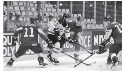
Latvijas hokejisti (tumšajos tērpos) cenšas apturēt kanadiešu spēlētāju

Latvijas – Kanadas spēlē atpūta tika dota Latvijas izlases pirmajam vārtsargam Elvim Merzļikim, bet vārtus sargāja Kristers Gudļevskis. Gudļevskis 2014. gada Olimpiskajās spēlēs Sočos ceturtdaļfinālā aizvadīja izcilu spēli, Latvijas izlasei nākamajiem