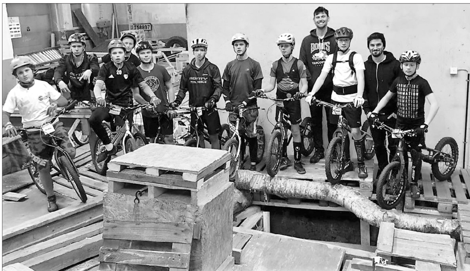
Nometnē Somijā iesaistījās 42 dalībnieki, šeit daļa no viņiem.

Nometnes dalībnieki atzīst, ka Somijā pavadītais laiks bijis patīkams. Pēc vairākkārtējas Latvijas sportistu viesošānās Somijā beidzot ir pamatotas cerības redzēt arī Somijas velotriāla pārstāvjus kādās sacensībās Latvijā. Pēdējo reizi kāds Somijas velotriāla brau-