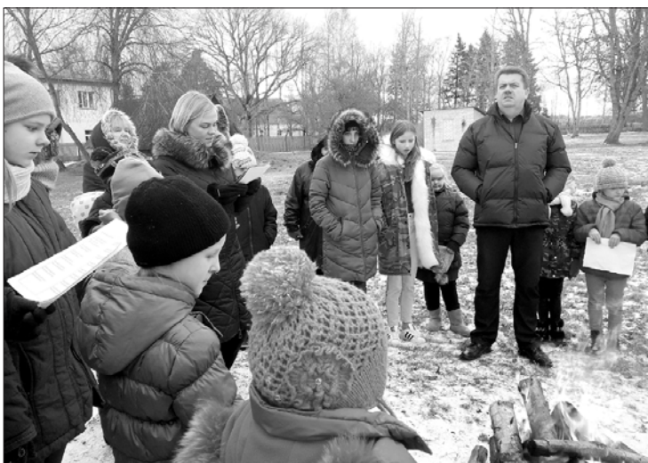
Pieminot barikāžu laika notikumus.