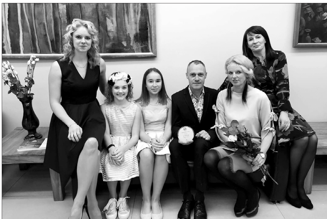
Veiksmīgie jātnieku sporta kluba “Demora” pārstāvji.