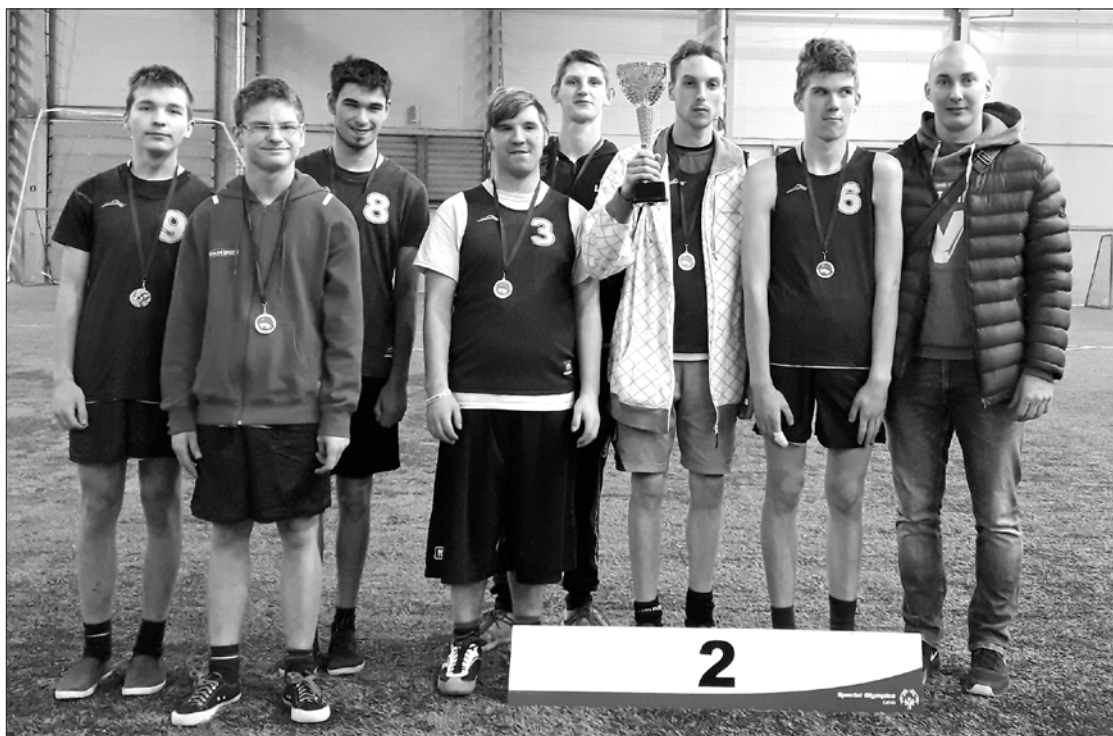
Jaunie futbolisti priecājas par iegūto 2. vietu.