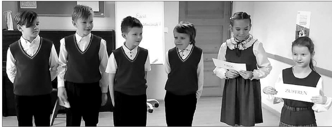
Puzes pamatskolas 1.–4. klašu dziedātāji piedalījās arī Ziemeļkurzemes zonas konkursā.