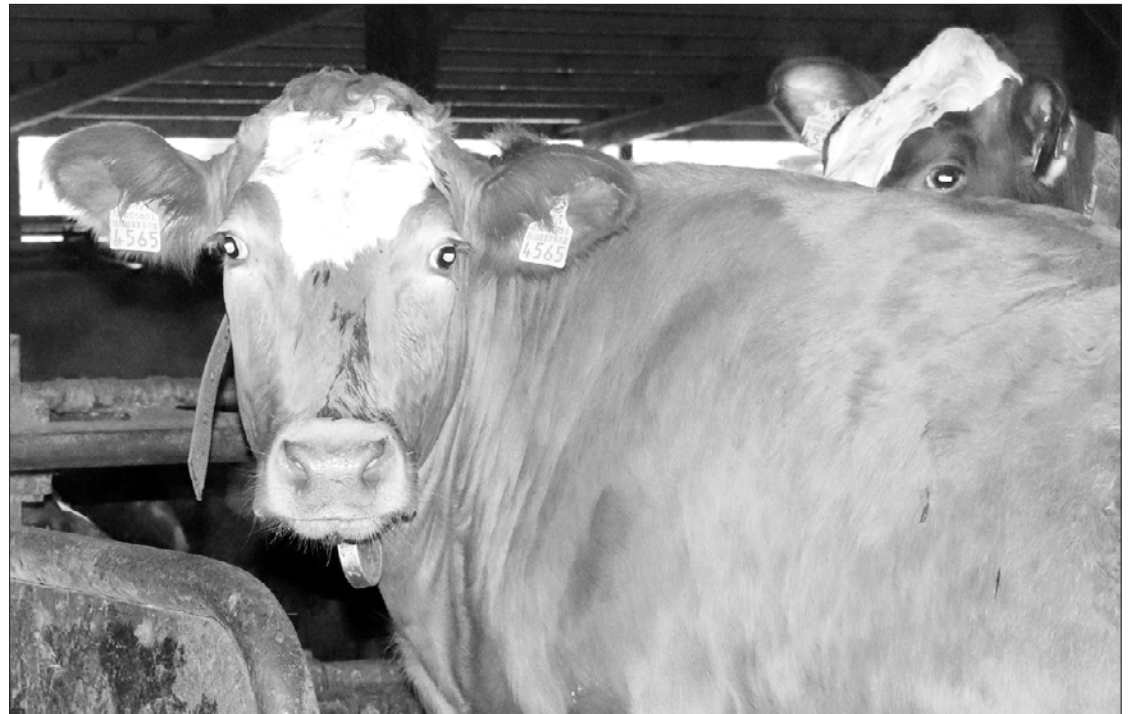
"Krāciņu" kūti ir 230 slaucamas govīs. Tām ir nodrošināti labi dzīves apstākļi.