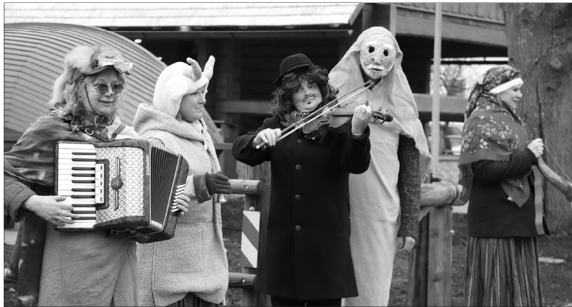
Masku tradīciju festivālā piedalīsies arī tārģalnieki.