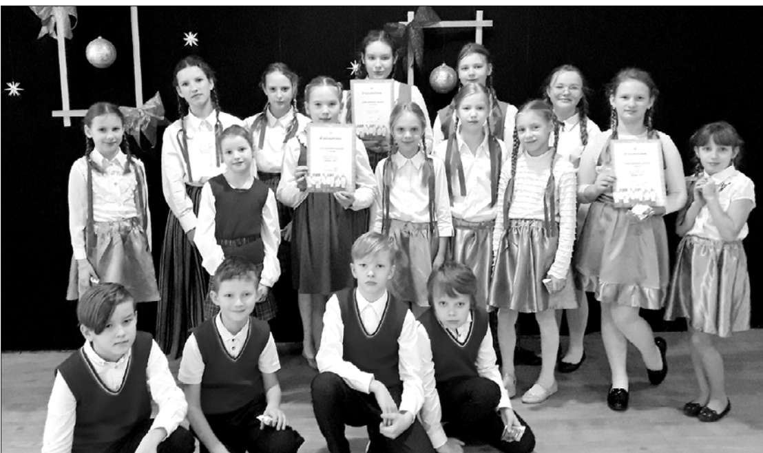
Sacensību "Lakstīgala" dalībnieki – gan užavnieki, gan Puzes pamatskolas audzēkņi.