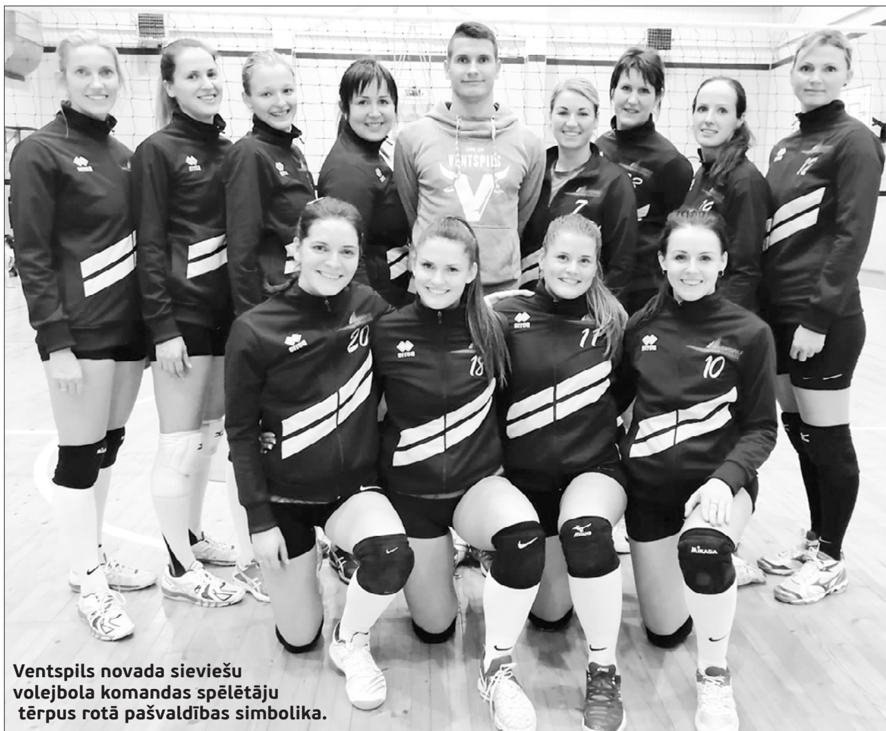
Ventspils novada sievietes volejbola komandas spēlētāju tērpus rotā pašvaldības simbolika.