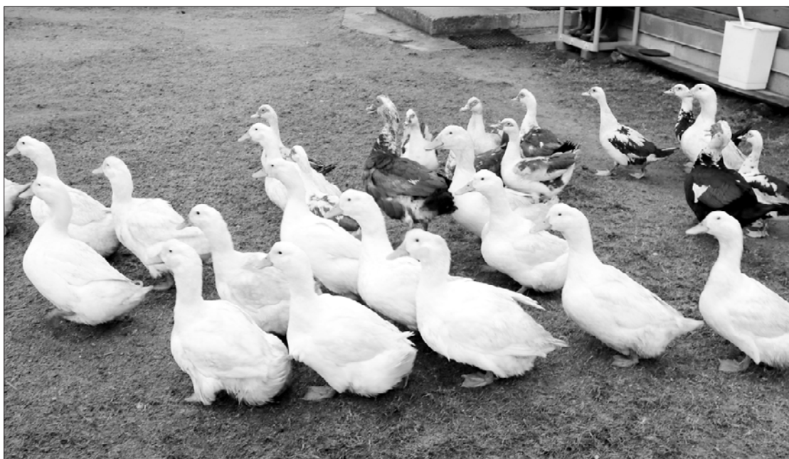
Putni savu saimnieci pazīst un rātņi tek viņai pakal.