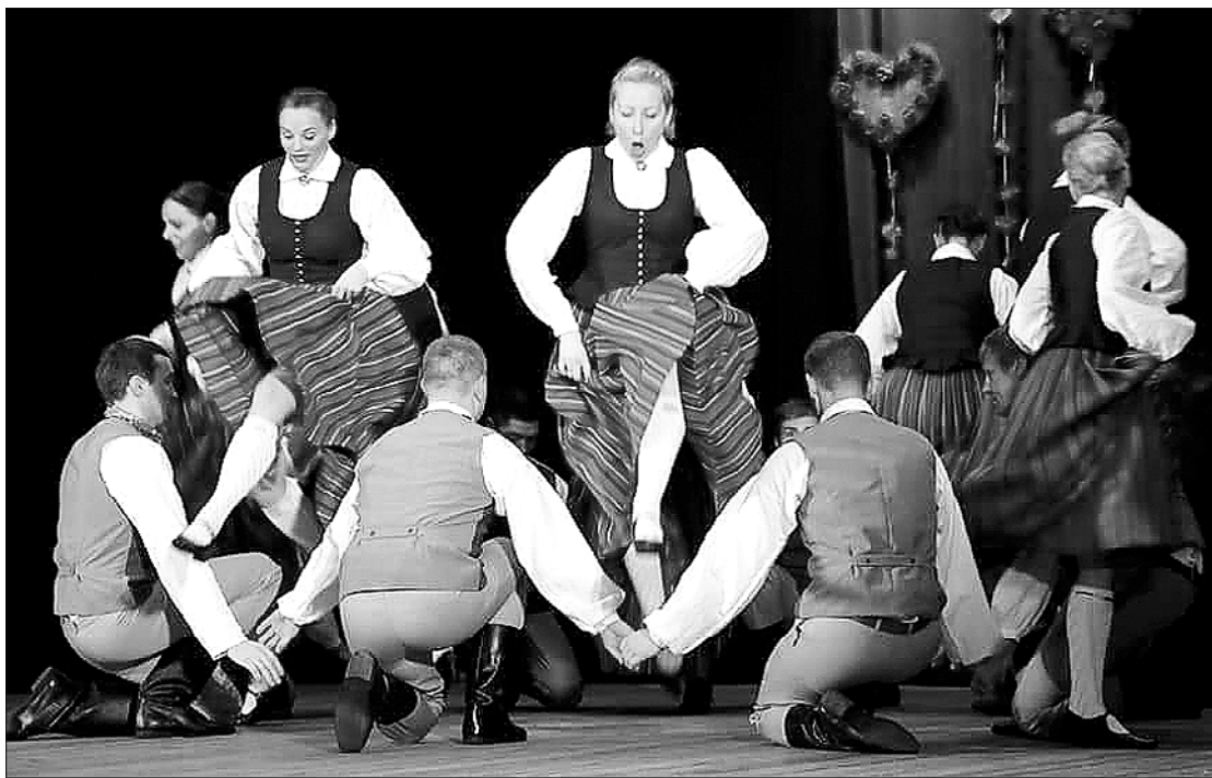
Valentīndienas sadancī dalībnieki izdejoja dažādas dejas.

vērojām vidējās paaudzes deju kolektīvus no Ventspils – "Kurzemi" un "Strautuguni", Liepājas puses kolektīva "Nīca" dalībniekus un jauniešu deju kolektīvu "Spararats" no Grobiņas. Talsu novadu pārstāvēja "Spriganis" no Pastendes un "Virpulis" no Laidzes, Ventspils novadu – "Vārves" dejotāji no Vārves pagasta un mājinieki – vidējās paaudzes un senioru deju kolektīvs. Šajā koncertā mēs salīdzinājām deju ar kino – abas šīs mākslas nāk ar savu vēstījumu un spēju cilvēkos raisīt līdzpārdzīvojumu un pārdomas. Tika izdejotas zelta fonda