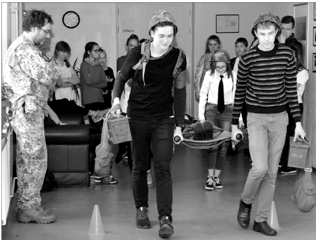
Puiši pārbauda spēkus, skolas biedru pārvietojot nestuvēs.