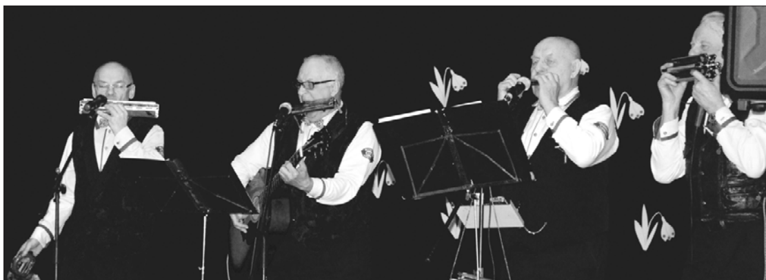
Uģālē uzstājās "Ventspils blūmizeristi".

Uģāles teātra baudītājiem 9. februāra pēcpusdienā bija iespēja skatīt aizraujošu un humoristisku izrādi ar dramatisma akcentiem Ventspils pensionāru biedrības "Liedags" amatiereteātra izpildījumā. Izrāde "Trīs skaistas sievietes" ir par mūsdienas sievietēm, kurām vairs nav 49 un kuras jūtas vientuļas, tomēr apzinās, ka šādi nevar dzīvot, un saprot, ka nekad nav par vēlu sākt visu no sākuma. Šīs izrādes laikā varēja izjust visdažādākās emocijas – smaidīt, no sirds izsmieties, sajūst nolemtību, kā arī ieslikt pārdomās par to, cik ļoti šī tematika savijas ar mūsu ikdienu. Un tieši šo emociju gammu izdzīvoja arī mūsu skatītāji, kuri vēroja izrādi pie kafijas tases.