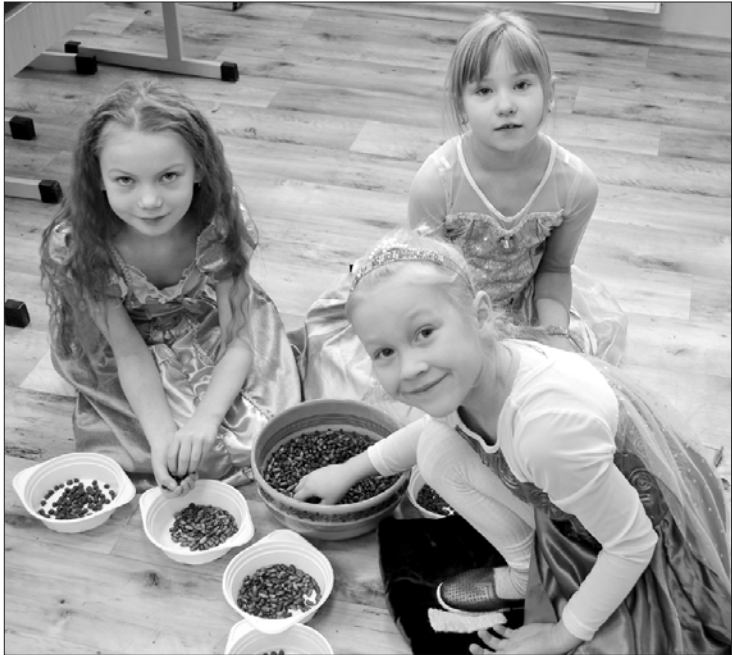
Meitenes žigli pārslasa pupas. Uzdevums paveikts!