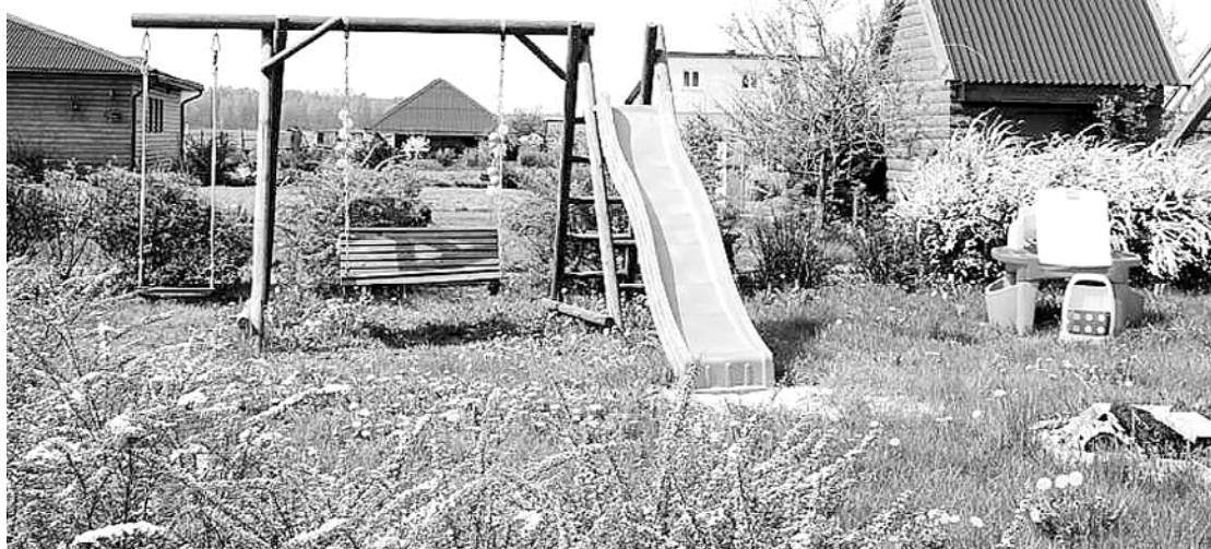
Viesu nama teritorijā padomāts arī par bērnu izklaidēm.