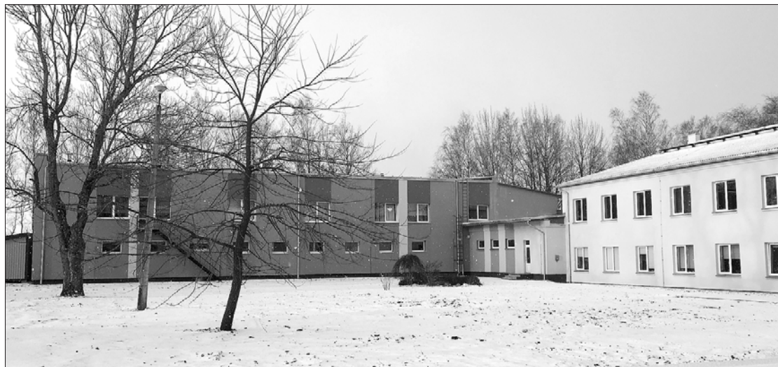
Zūru pamatskolai siltināta ēkas fasāde un bēniņi.