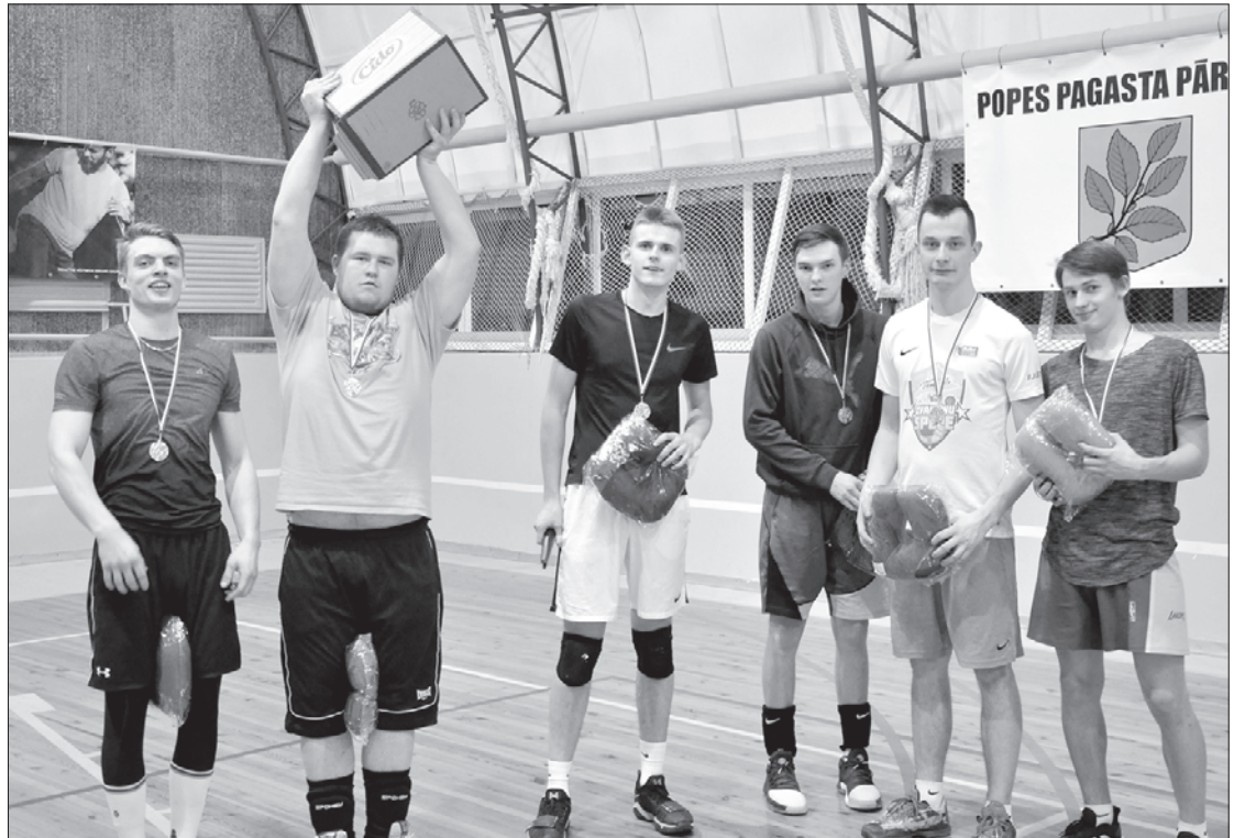
1. vietas ieguvēji – komandas "Čipikāno" spēlētāji.

Paldies sacensību dalībniekiem un palīgiem. Paldies mūsu atbalstītājiem – ARB "Pope", "Mājai un dārzam", biedrībai "Popes muiža", Ventspils novada pašval-