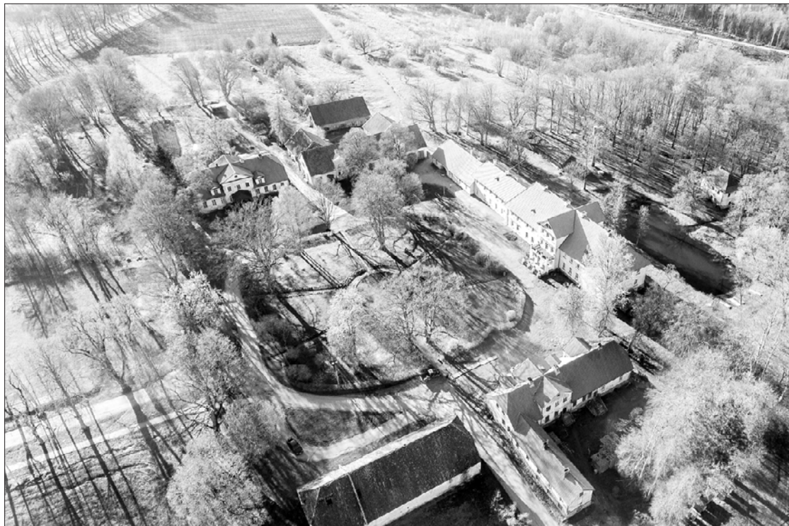
Skaistā Popes muiža no putna lidojuma.