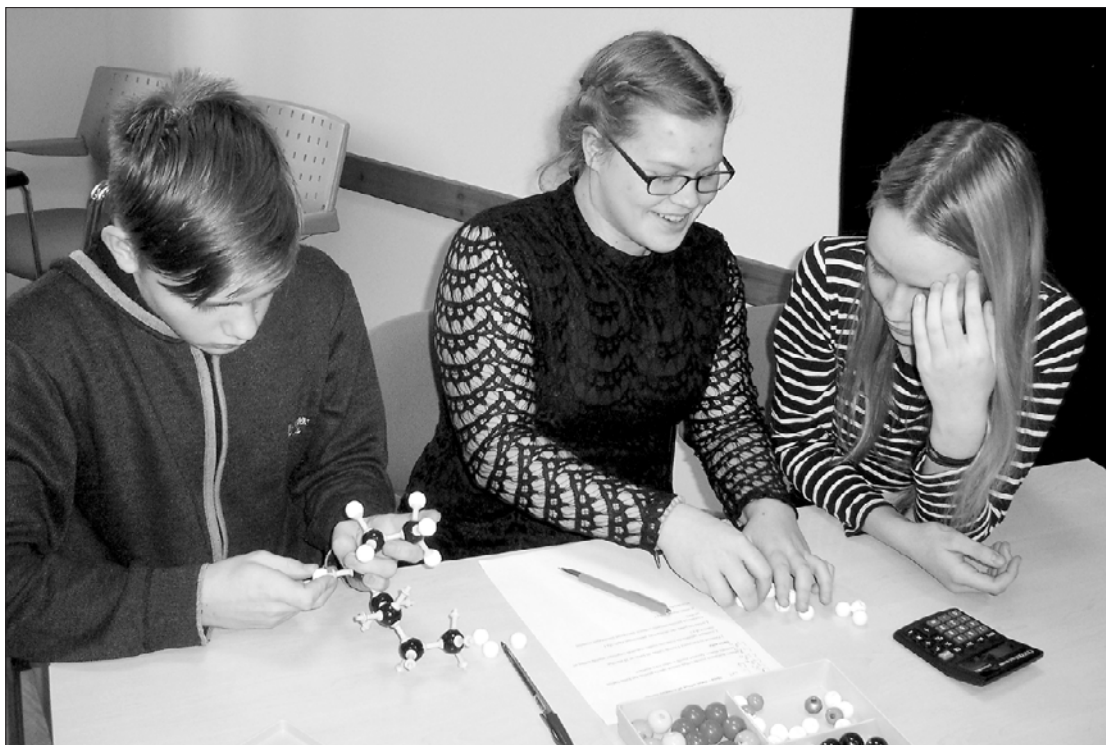
Konkurss “Erudīts fizikā un ķīmijā” 8. un 9. klašu skolēniem šoreiz notika Ventspils Digitālajā centrā.