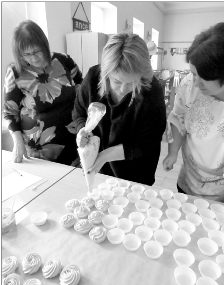
Ancenieces apgūst zefīra gatavošanas prasmes.

Saldā pirmdienā. Tā varētu nosaukt šo dienu. 4. martā di-