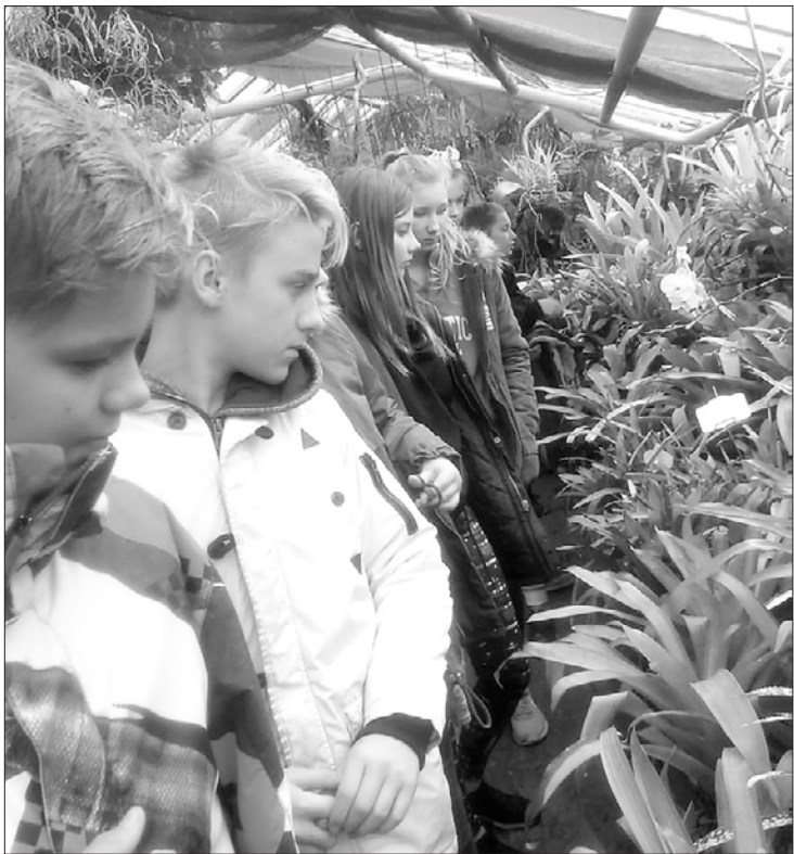
Mācību vizīte Botāniskajā dārzā.