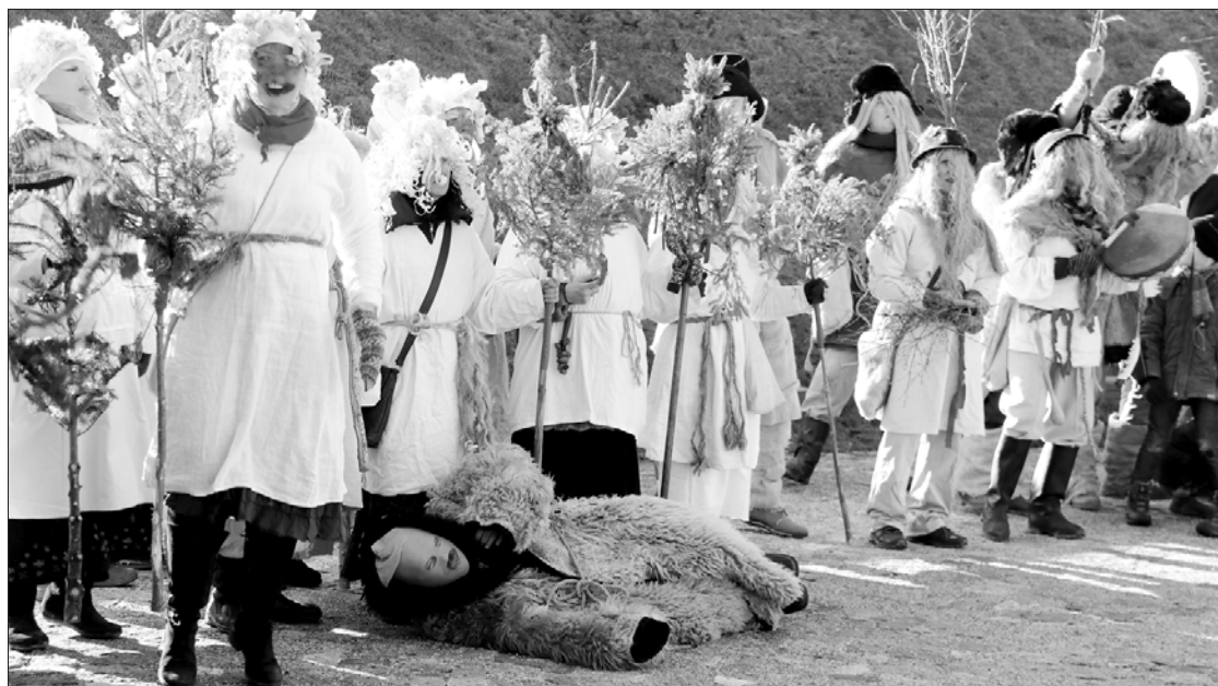
Katra folkloras kopa bija padomājusi par atbilstīgu noformējumu un braši uzgavilēja sev un pārējiem pasākuma dalībniekiem.