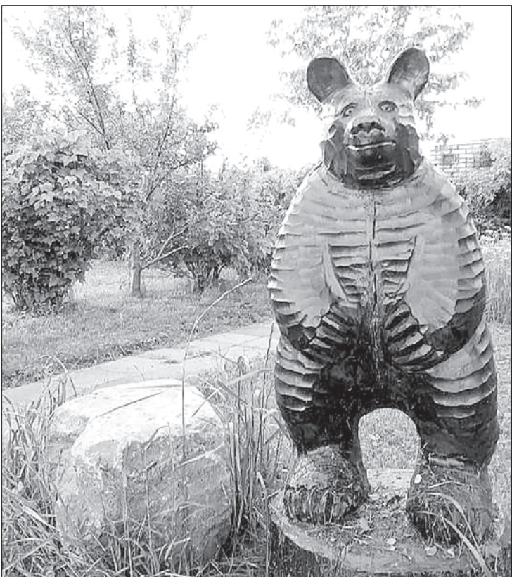
Vairākās vietās izvietotas lāču figūras, tā pievēršot uzmanību uzņēmuma nosaukumam.