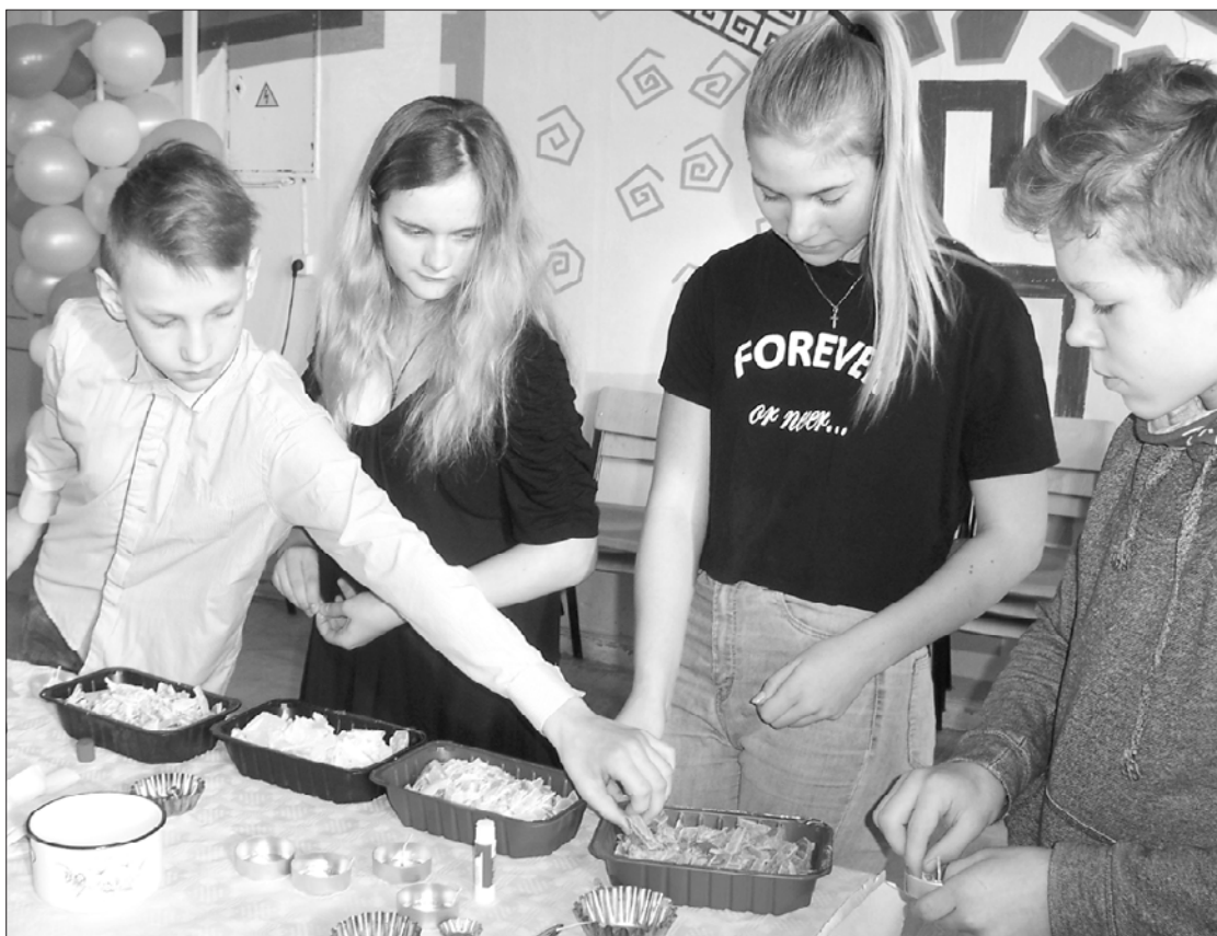
Skolēni mācās liet sveces.

Turpmākajam darbam izlozes kārtībā tika izveidotas četras jauktās komandas, katrā astoņi dalībnieki, kurām, savukārt sadaloties divās grupās pa četriem un savstarpēji mainoties vietām, jāpagūst gan izliet sveces, gan izpildīt vienu no piedāvātajiem uzdevumiem: piemēram, pārrunāt, kuros svētkos nozīmīga vieta tiek ierādīta ugunij (ugunskuriem, svecēm, gaismai), prezentācijā pastāstīt par kādu no svētkiem, pamatot savas domas, vai iedomāties sevi par kāda žurnāla vai avīzes žurnālistu, iztēloties ar uguni saistītu situāciju vai notikumu un uzrakstīt īsu reportāžu no notikuma vietas. Varēja arī izveidot kolāžas plakātu par uguns tēmu