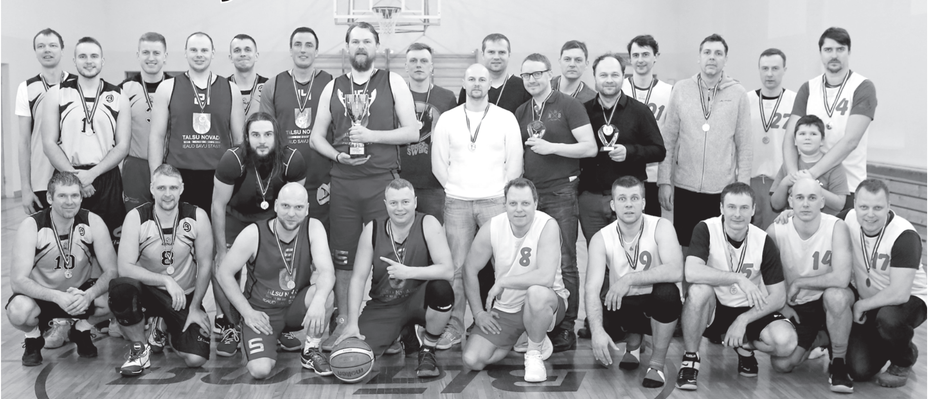
Basketbola turnīra dalībnieki satikušies Puzē.