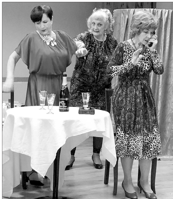
Skats no izrādes "Trīs skaistas sievietes".

Savukārt 20. februāra pievakarē mūs priecēja Ventspils Vācu kultūras biedrības ansambļa "Windau" un "Ventspils blūmizeristu" kopīgais koncerts "Draugu pulkā nāc". Vienā plūdumā savijas gan vācu, gan latviešu valodā dziedātas un spēlētās dziesmas, starp kurām bija gan viegli baudāmas melodijas, gan tādas, kuru ritmā tā vien gribējās laisties valša trissoli. Koncerta radītā gaisotne bija viegla un nepiespiesti omīīga, bet vienlaikus arī pārdomāta un, gribētos teikt, profesionāla. Vislielākais gandarījums māksliniekam un mums, pasākuma organizatoriem, bija redzot, ka skatītāji pēc koncerta savās gaitās