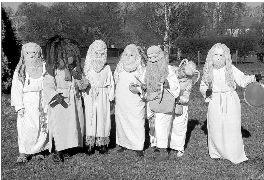
"Bērziņu" sētā satikās vecīši no Salacgrīvas un Rīgas.