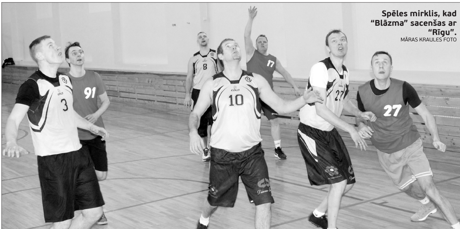
Spēles mirklis, kad “Blāzma” sacēšas ar “Rīgu”.