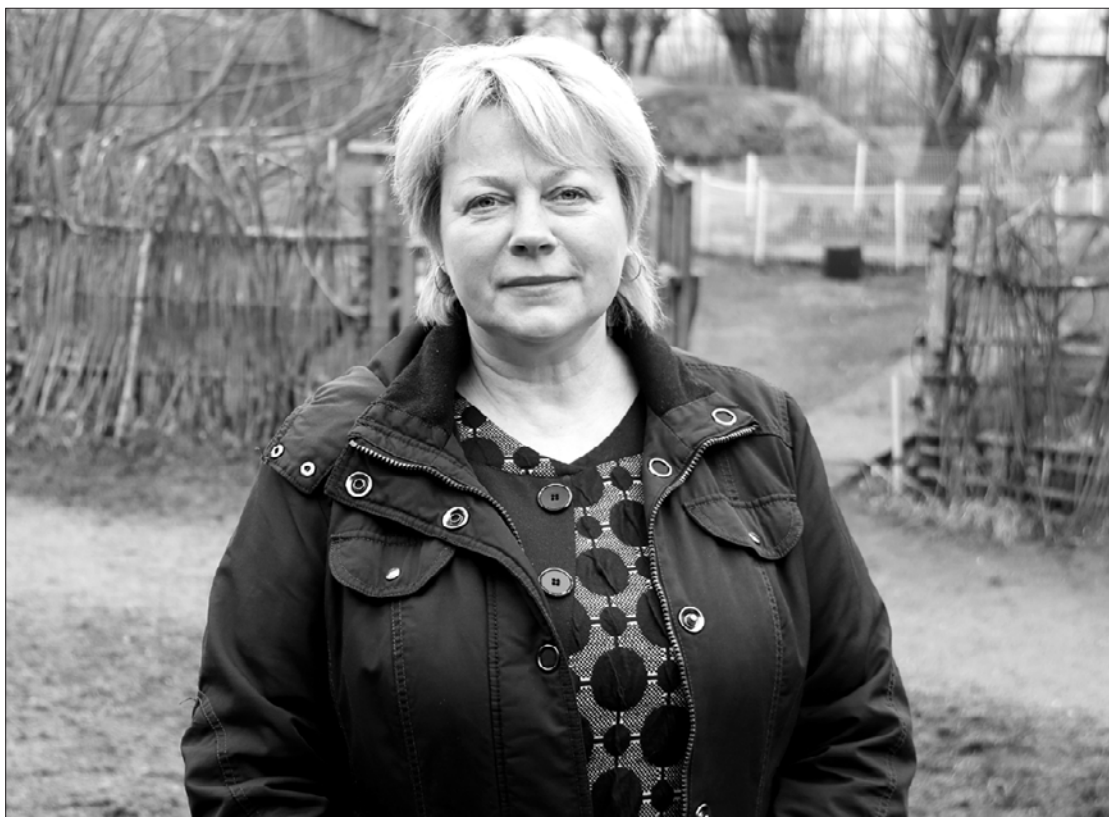
Sandrai ļoti patīk dzīvot laukos – prom no pilsētas burzmas.