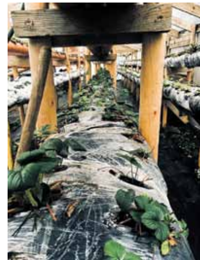
Zemes tiek iezītas, lai sagaidītu siltāku laiku