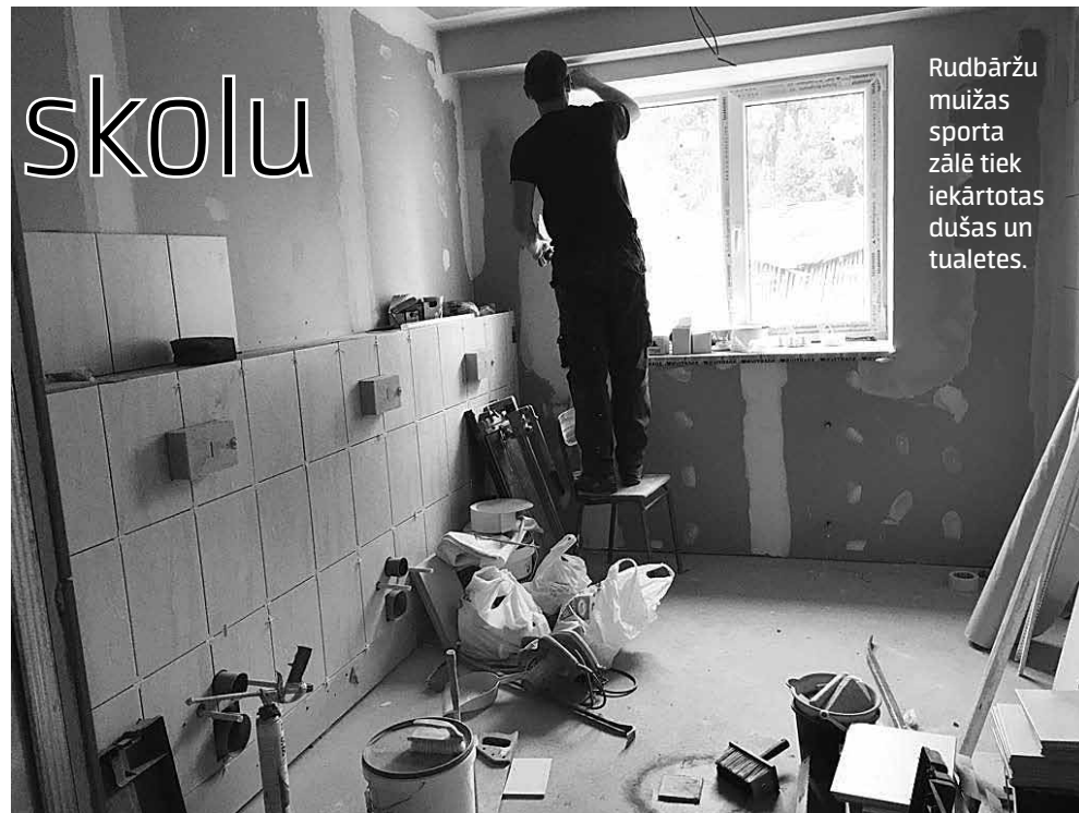
Rudbāržu muižas sporta zālē tiek iekārtotas dušas un tualetes.