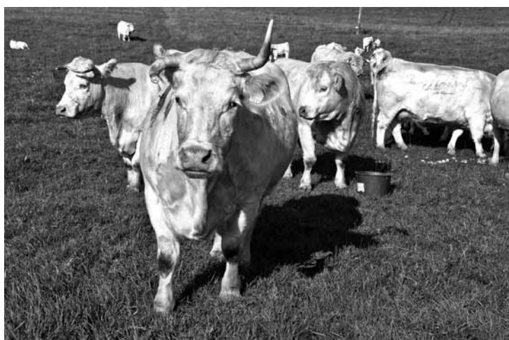
Bioloģiski iegūtas gaļas apjoms Latvijā pakāpeniski palielinās un arvien vairāk pieaug liellopu, kā arī aitas gaļas īpatsvars. Ar šādām metodēm izaudzēt lopus nav grūti, diemžēl mūsu zemnieki vēl nav iemācījušies kooperēties, tāpēc netiek vietējā tirgū un veikalos tīklā.

„Ceru, ka ar laiku arī latvieši iemācīsies sadarboties kā, piemēram, vācieši,” turpina uzņēmēja. „Vācijā ir liels kooperatīvs, kas no daudziem bioloģiskajiem zemniekiem, tostarp mazajiem, iepērk dažādus produktus, pārstrādā vai