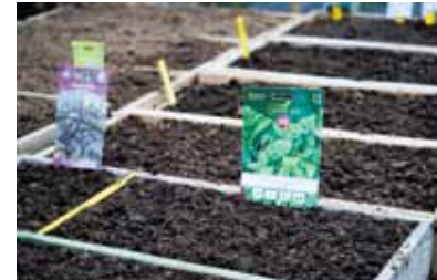
Salāti jau iestādīti gan podiņos, gan kastēs.

„Cenšos visam tikt pāri un no grūtībām nebaidos, jo tās tikai izaicina.”