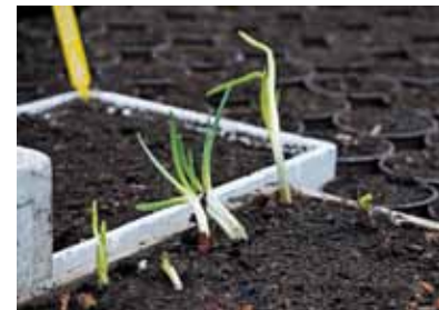
Sīpolu sastādīts mazāk, tomēr loki ir labs papildinājums ēdienam.