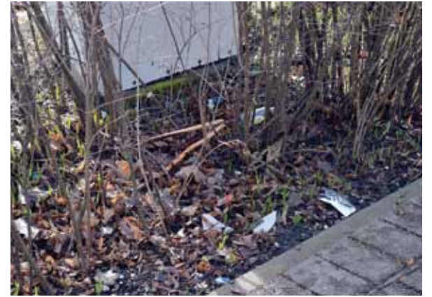
Īpašumu Pētera ielā prasās sakopt. Šī adrese ir arī Kuldīgas komunālo pakalpojumu darbinieku sarakstā.