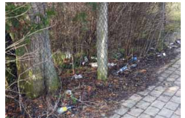
Mālu ielā redzamais nav īpaši patīkams.