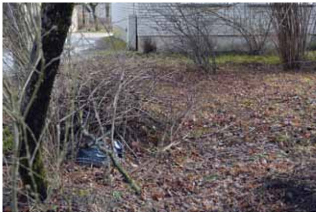
Skvēriņš 1905. gada ielā 15 bija lapu piebiris un papīru piemētāts, gadiem tajā atradās žaģaru kaudze (attēlā). Aptuveni divas nedēļas pēc pašvaldības policijas vizītes, viss ir sakopts, un var godam gaidīt tūrisma sezonu.