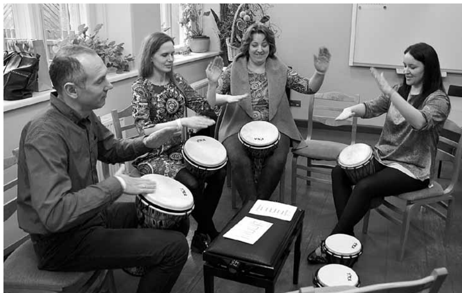
Radošajās stacijās vecāki ar aizrautību apguva bungu un citu instrumentu spēli.