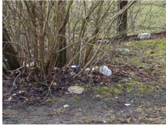
Tā izskatās Dārza ielā.