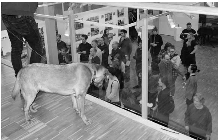
Fotodarbņica Pārmaiņu izjūta . „Jūtu, ka visas bildes pārmainīsies par desām!” priedājis suns. Lailas Liepiņas teksts un foto