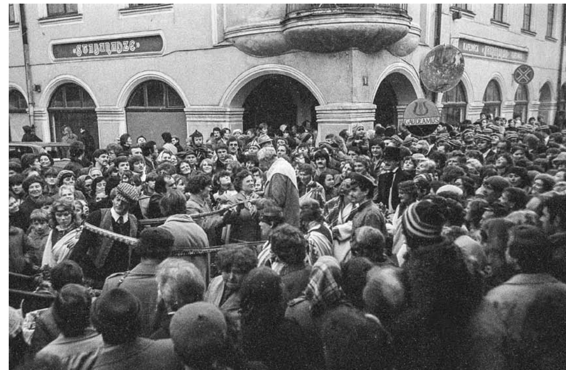
Sveicēju pūlis Liepājas ielā Ēvalda Valtera 90. jubilejā.

„Visvairāk mani dzīvē sajūsmīna mana Latvija. Tur es ņemu savu iedvesmu, savu prieku. Citur nekur es nebūšu laimīgs.” (Ēvalds Valters)