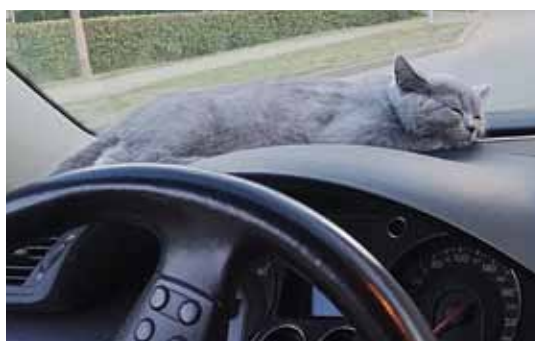
INGUSS DRULLIS. „Es te mazliet pačučēšu.”