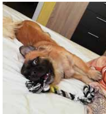
KRISTĪNE VECRUMBA. „Mani sauc Rufo. Man ir 1,5 gadiņi. Man ļoti patīk spēlēties un doties garās pastaigās, labprātāk gulēt gultā.”