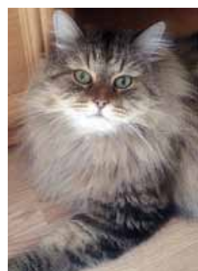
IVETA SĒKLĪTE. Nopietnais Pūča kungs.