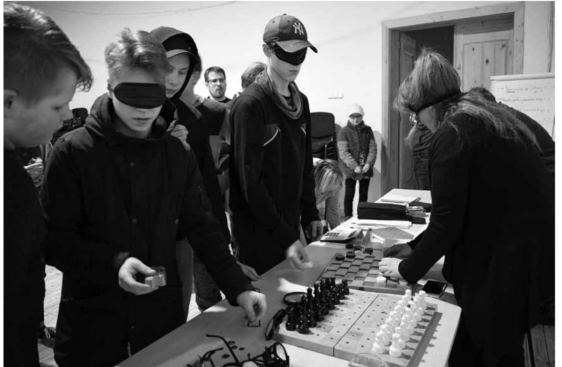
Jaunieši ar aizsietām acīm cenšas atšķirt monētas un spēlēt dambreti.