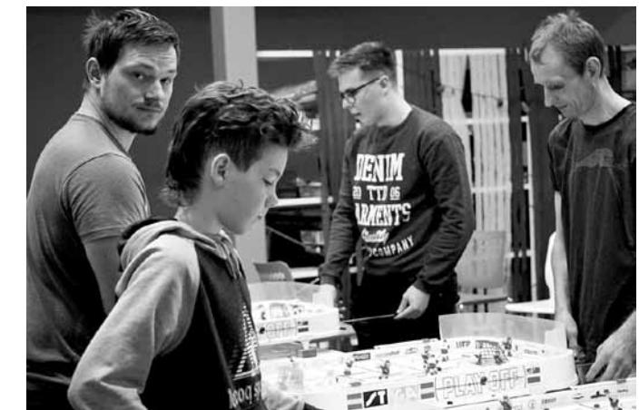
Ceturtdienās no 18.00 līdz 20.00 Skrundas jauniešu centrā notiek treniņi galda hokejā.

„Piecpadsmit gadus mans tēvs Arnis Vītols Skrundas galda hokeja klubā bija treneris. Darba dēļ viņam šī darbība bija jāpārtrauc.