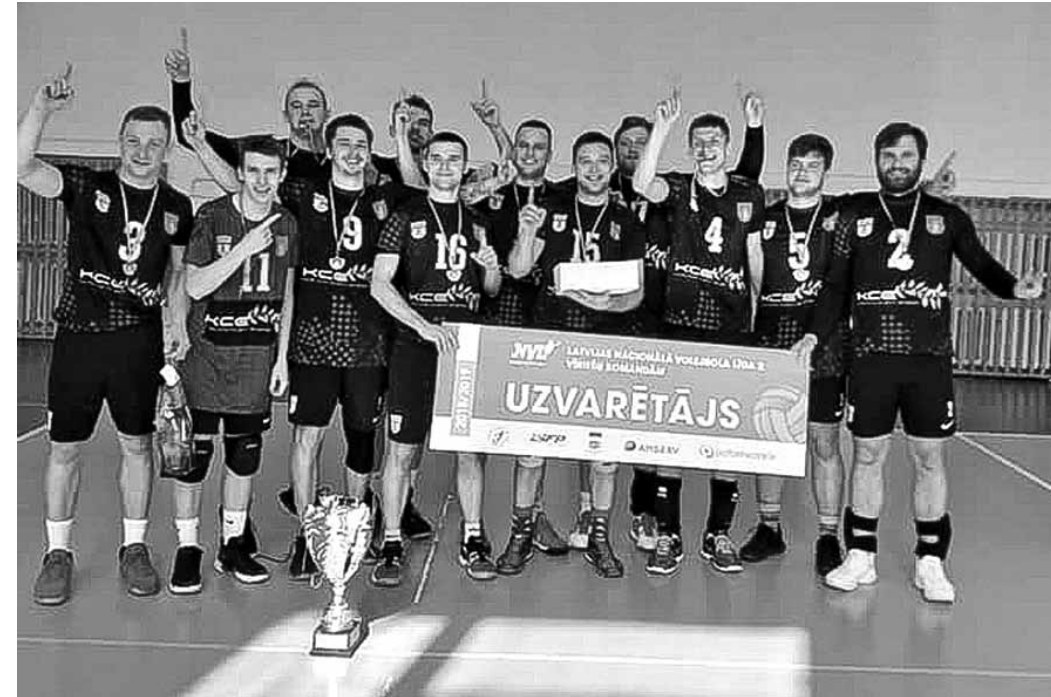
Nacionālās volejbola līgas 2. divīzijas čempione – Kuldīgas novada sporta skolas vīriešu komanda.