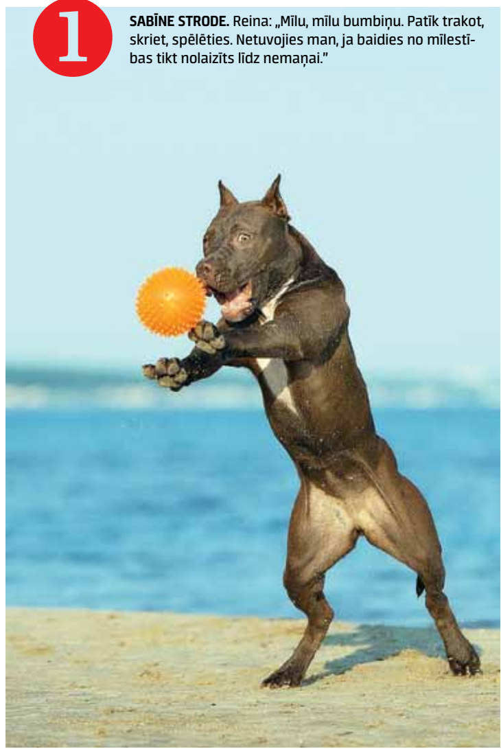
1 SABĪNE STRODE. Reina: „Mīlu, mīlu bumbiņu. Patīk trakot, skriet, spēlēties. Netuvojos man, ja baidies no mīlestības tikt nolaizīts līdz nemaņai.”