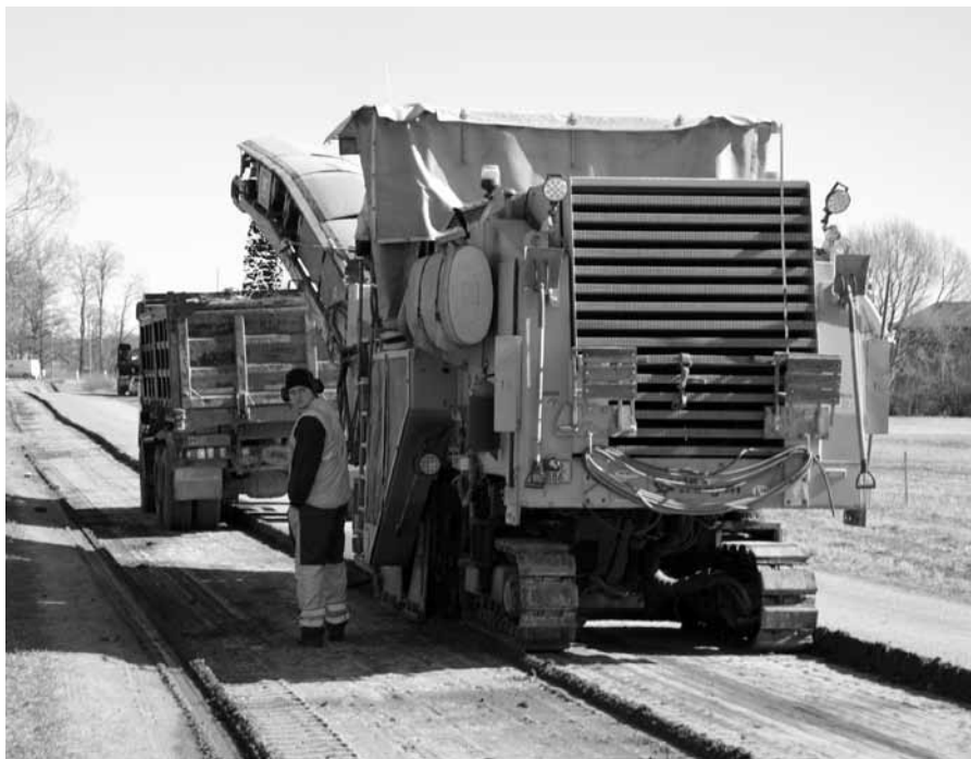
Jelgavas ielas pārbūves pirmajās dienās Saldus ceļinieks no Graudu līdz Ganību ielai noņēma veco asfaltu.

SC vispirms demontēs veco segumu, tad darbu sāks apakšuzņēmumi. Grobiņas SPMK ierīkos ūdensvadu, sadzīves un lietus-ūdens kanalizāciju, bet Sigma Elektro – apgaismojumu, strāvas tīklus un jaunus elektroapgādes kabeļus.