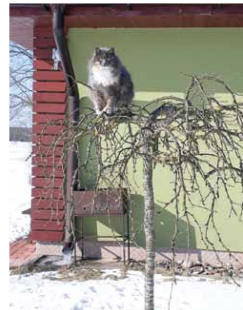
LAINĒ GASPARE. Mūsu saimniecības kaķi spēlē spēli Augstāk par zemi.