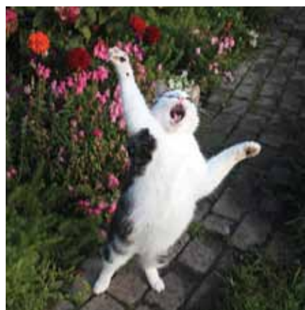
INGRĪDA CĪRULE. Mūsmājās pašiem savs tenors – Pēcislis