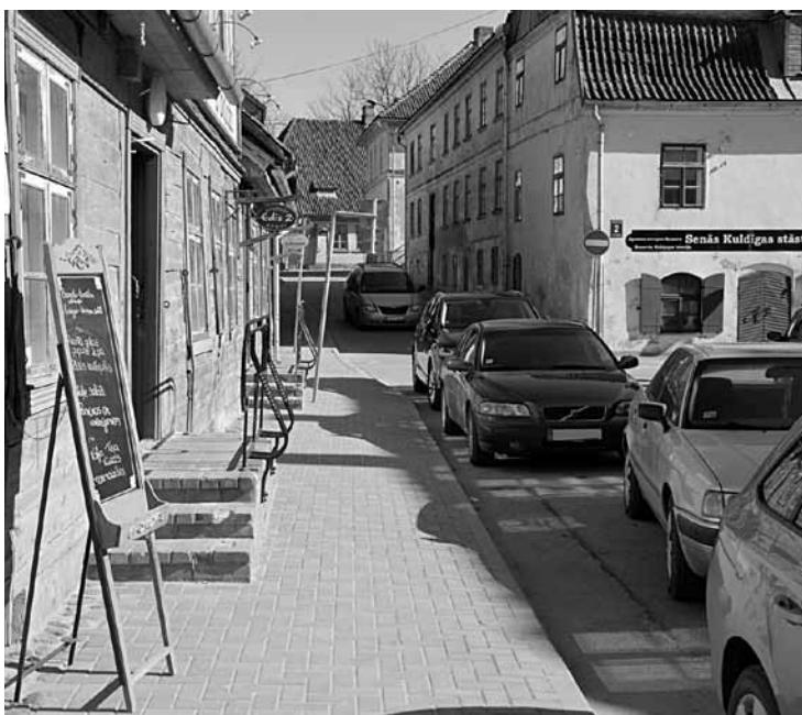
Pasta ielā kafejnīca The Marmalade vēlas ierīkot vasaras terasi uz ielas, taču transporta komisija tādām nolūkam šo vietu neuzskata par drošu. Turklāt mazināsies autostāvvietu skaits.

Iespējams, tiks mainīta stāvēšana Pasta ielā, šobrīd tā atļauta kafejnīcas The Marmalade pusē, kur ēstuves saimnieki vēlas ierīkot vasaras terasi. Domes vecpilsētas komisija ideju par terasi nodevusi apspriešanai transporta speciālistiem. Viņi uzskata, ka no satiksmes drošības viedokļa šajā