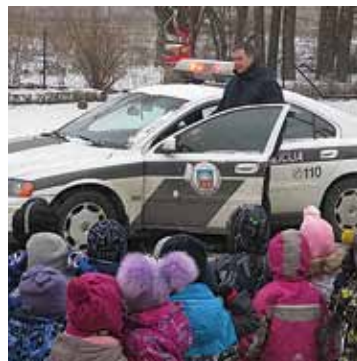
Policija ir klāt!