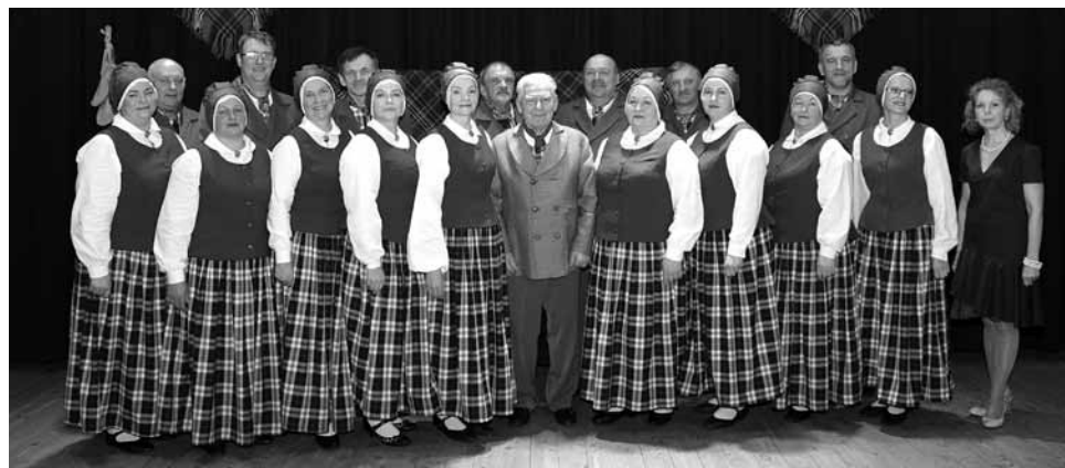
Senioru deju kolektīvam Kamēr vari šogad – 15. Tam par godu koncerts saieta namā Sencis .

Kolektīvam visvairāk patīk enerģiskas dejas – ar raksturu un humoru. Vasarā šo darbību piebremzējot, jo vairākiem ir sava saimniecība. Un kā daudzviet pietrūkst vīriešu.