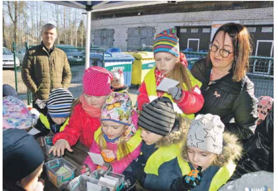
Kuldīgas mazie cīrulīši labi tiek galā ar atkritumu šķirošanas spēli.