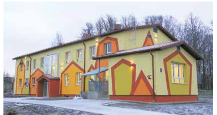
Viļķenes pirmsskolas izglītības iestāde.

Skate notika trīs kārtās un ikviena pieteiktā būve tika izvērtēta ļoti rūpīgi un atbildīgi. Pir-