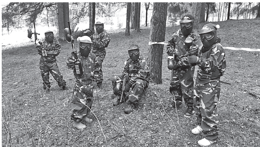
Mirkļis no paintbola spēles dienas nometnē skolēniem “Jauns - aktīvs - vesels”.

Projekta ietvaros vairs netiks organizētas tenisa nodarbības, jo saņemts iesniegums no trenera par līguma laušanu. Notiks arī aktivitāte Peldēšanas apmācības Viesītes vidusskolas skolēniem izglītības īstenošanas vietā Vaļņu ielā 7, Viesītē, jo tā pilnībā izpildīta.