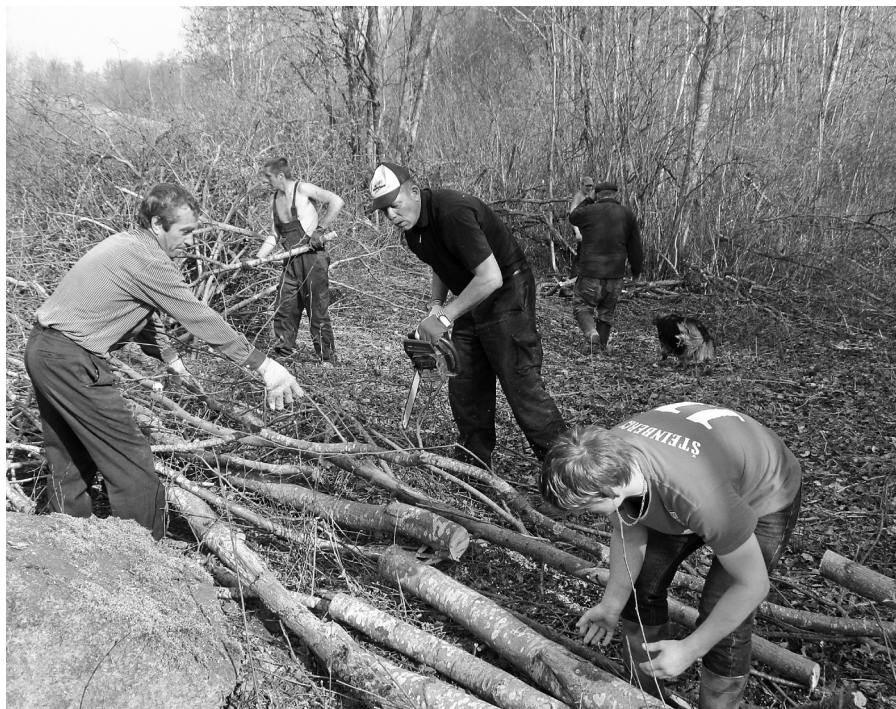
Tradicionālajā Otro Lieldienu talkā 2014. g. vietējo iedzīvotāju grupa no krūmu apauguma atbrīvoja Asupes (D-Susējas labā krasta pieteka) sākuma posmu Ormaņkalna virsotnes ziemeļu nogāzē.

R. Urbacāne Elkšņu pagastā