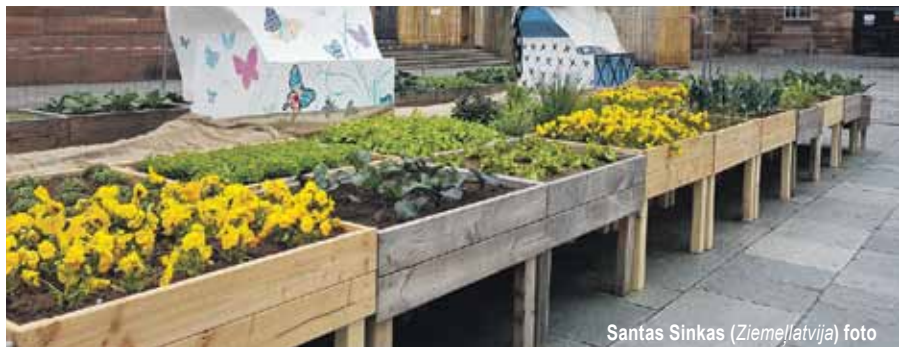
Santas Sinkas (Ziemeļlatvija) foto

Puķes un ēdami augi nav vienmēr jāstāda zemē – dobies var iekārtot arī ravētājam un apjūsmotājam ērta augstuma kastēs, ko nolikt zālienā, uz bruģa vai citā vietā.