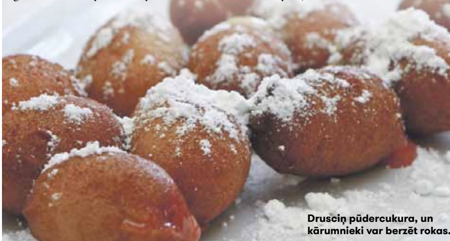
Drusciņ pūdercukura, un kārumnieki var berzēt rokas.