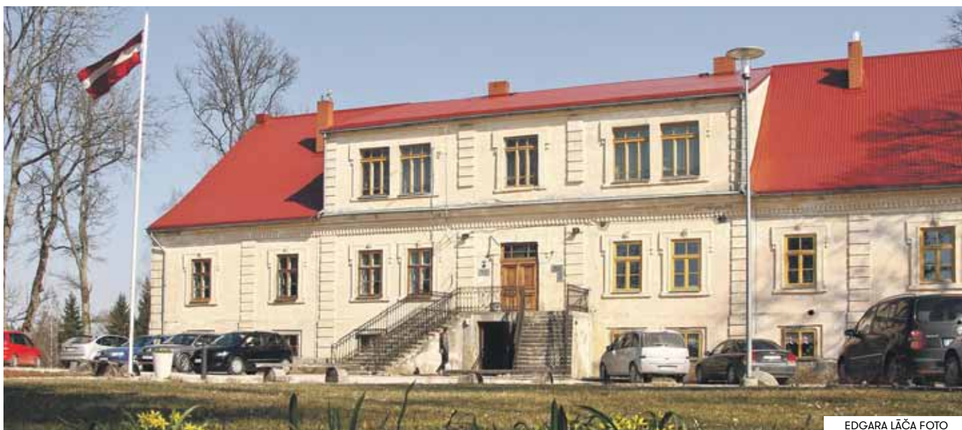
Spāres muiža šopavasār.