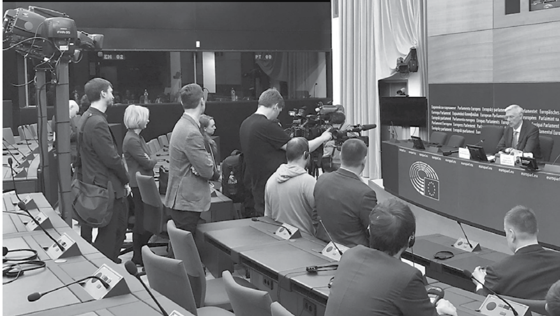
Ministru prezidents Krišjānis Kariņš preses konferencē Eiropas Parlamentā Strasbūrā atbildēja uz jautājumiem par imigrāciju Latvijā, cīņu ar netiro naudu bankās un Eiropas Savienības ārējo robežu stiprināšanu.

„Noziedznieki kā vanagi riņķo un meklē jaunu vietu, tāpēc izmaiņas banku sistēmā un cīņā pret netirās naudas atmazgāšanu nepieciešama visā Eiropā.”