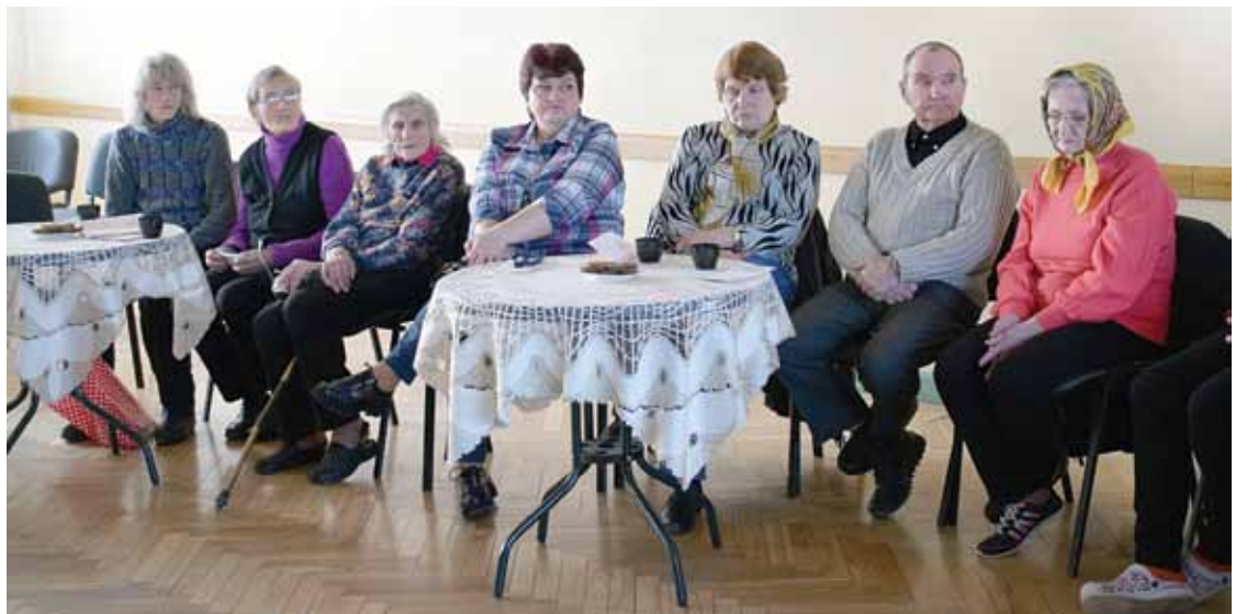
Kurmāles pagasta Vilgālē ikgadējā iedzīvotāju sapulcē tika runāts par ceļiem, drošību un nesakārtotām teritorijām.