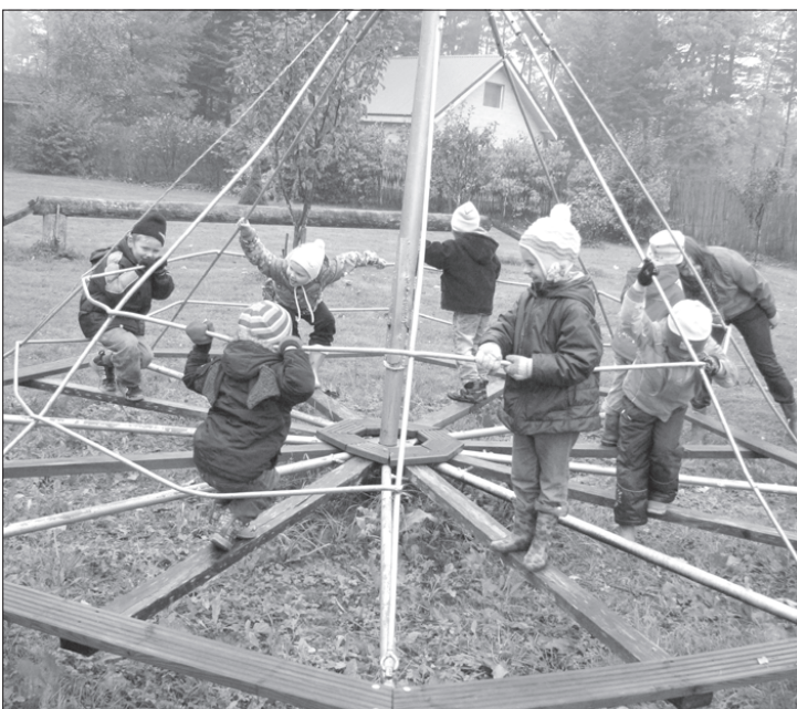
Te kaut kur ir noslēpti dārgumi!