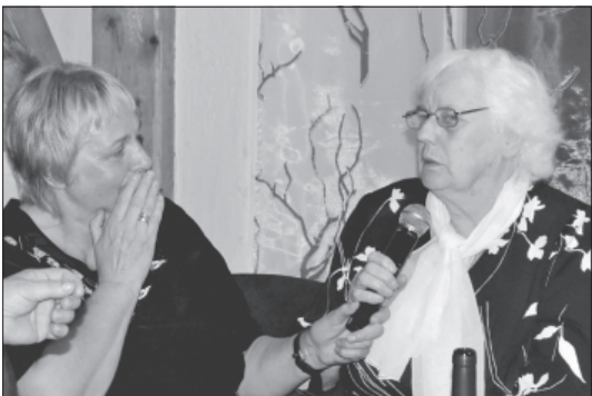
Kolhoza laiku pastāstiņš.

Šogad apritēju 65 gadi, kopš dibināts kolhozs "Uzvara" un ap 20 gadu kopš likvidācijas. Tādēļ radās doma pulcināt kopā ļaudis, kuriem darba gadi pagājuši kopus saimniecībā. Rīkot pasākumu kolhoza laiku atcerei "Reiz bija kolhozs!". Tā ir mūsu novada konkrēta laikposma daļa un cilvēki, kuri ieguldīja savu darbu, kuri veidoja tā laika vidi un kultūru.