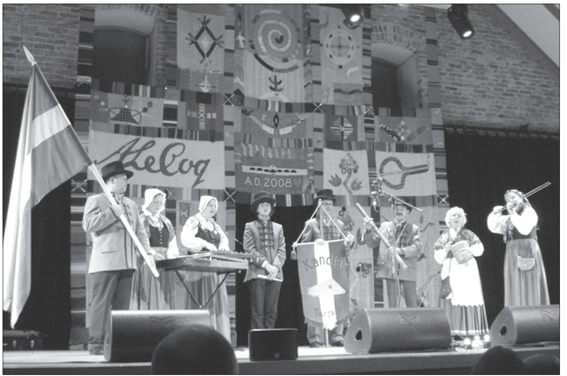
Gala koncertā Vilandē.

Piedalīšanās šajā festivālā, redzētais un dzirdētais folkloras kopas "Kāndla" dalībniekiem deva jaunus impulsus turpināt apzināt savu senču kultūrvēsturisko mantojumu. Kopā esot, mēs jutāmies līdzīgi savā garā un spītā, lai