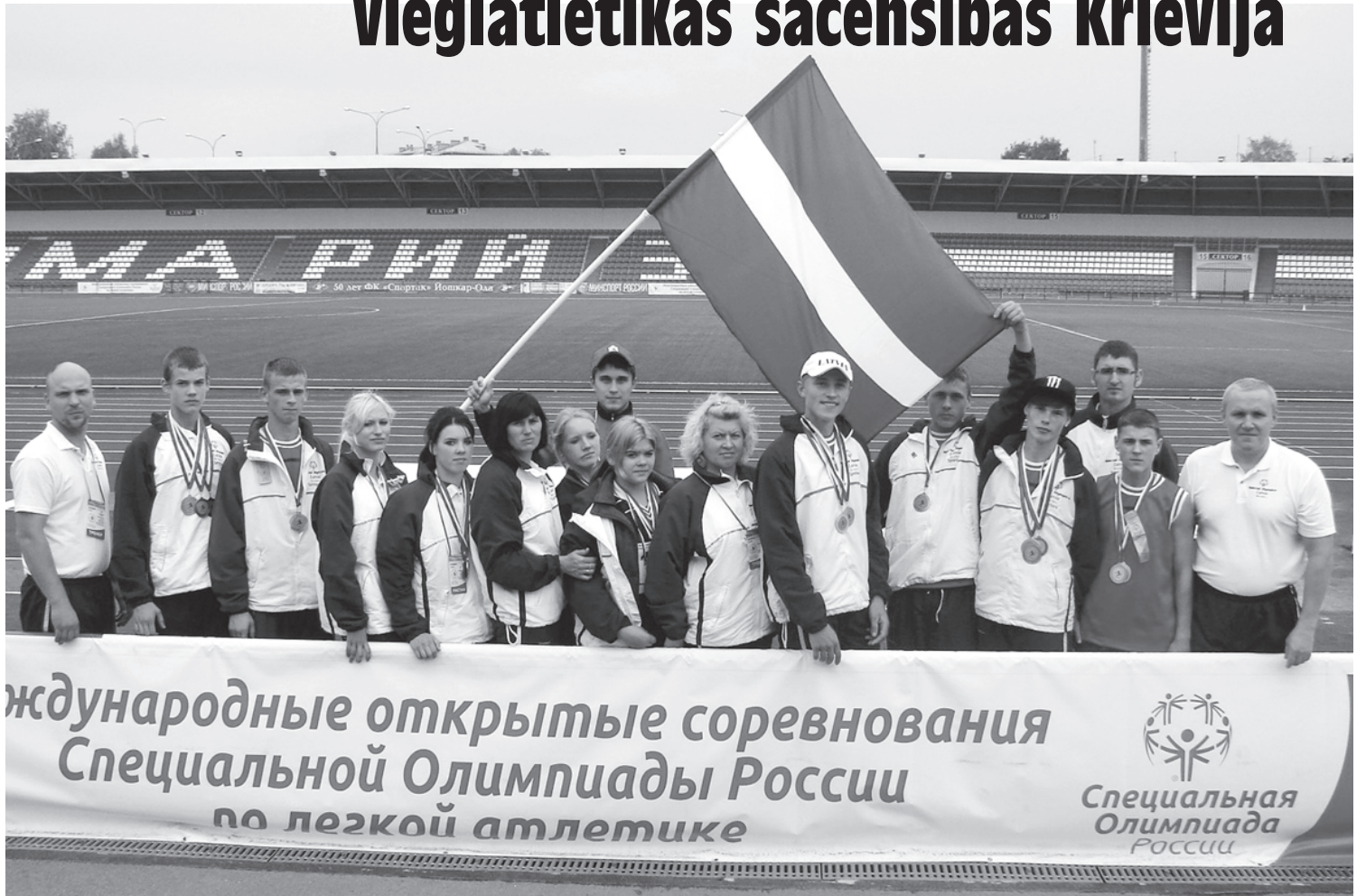
Latvijas izlases komanda Joškarolā.

Septembrī notika Krievijas vieglatlētikas sacensības Joškarolā, Marijelas republikā Krievijā. Tika uzaicināta Latvijas komanda, kuras sastāvā bija desmit sportistu, trīs treneri un divi delegācijas vadītāji. Papildu Krievijas apgabala komandām bija uzaicinātas Lietuva, Baltkrievija, Anglija, Kazahstāna, Serbija, Uzbekistāna, Turkmēnistāna, Ukraina, Horvātija – pavisam kopā 32 delegācijas. Latvijas komanda izcīnīja piecas zelta medaļas, sešas sudraba medaļas, divas bronza medaļas, kā arī zelta medaļas