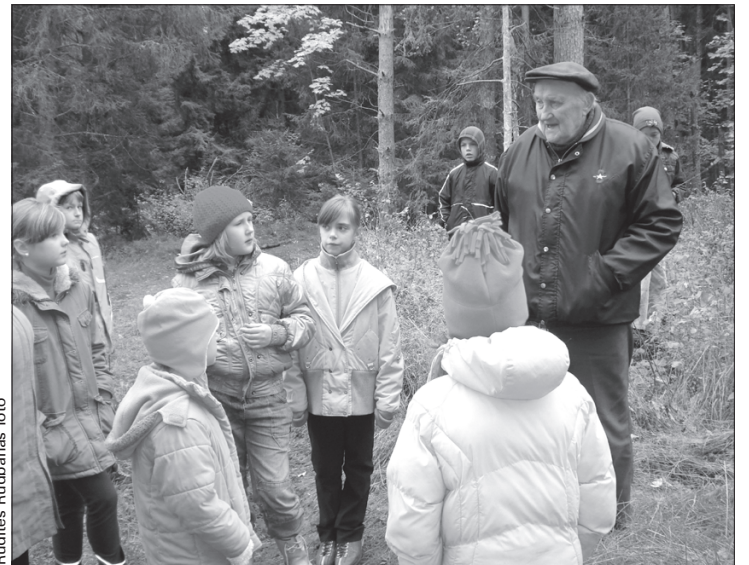
Te, mežā, bija noslēpta vācu armijas municija...