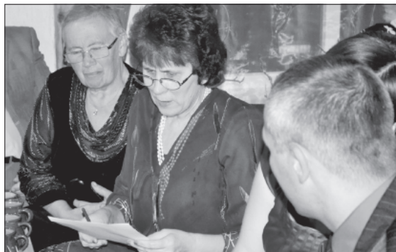
Pildām viktorīnu! Pa nopietnam!

Atsaucību guva arī viktorīna "Pus pa jokam, pus nopietni", kuru pildīja ar aizrautību visi galdiņi. Trīs labākie ieguva balvas. Bija prieks un gandarījums klausīties atmiņu stāstos un atkalredzēšanās gaviļēs. Izsaucām piecelties speciālistus,