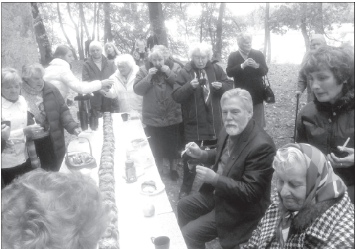
Arhibīskaps Brūveris pie 4,45 m garās ruletēs.

Rudens savās krāsās rotā Landzes baznīcas parku, zem kājām zeltītās lapas un saule silda