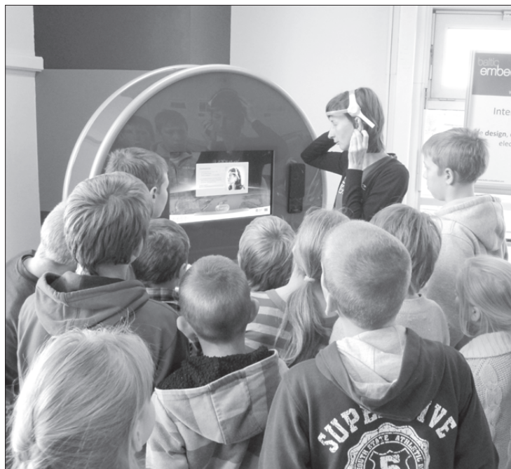
Viesojamies Ventspils augsto tehnoloģiju parkā.

Labo darbu nedēļas ideja ir pamanīt, ka tieši mūsu labie darbi varētu kādam palīdzēt. Svarīgi pamanīt, kam un kā. Dažiem bērniem tas lika padomāt, kā labāk paveikt savus ikdienas darbiņus, būt mazliet čaklākiem un uzmanīgākiem mājās, apciemot omīti, attālākus vecos ļaudis, piedāvāt palīdzību kaimiņiem, neaizmirst par saviem četrkājainajiem draugiem, bet daļai skolēnu radās doma- palīdzēt meža dzīvniekiem. Sazinājāmies ar Ventspils briežu dārza pārvaldnieku, uzzinājām, ka dzīvniekiem ziemas salā pārtikai nepieciešamas zīles, un skolēnu līdzpārvalde izsludināja ziļu lasīšanas nedēļu.