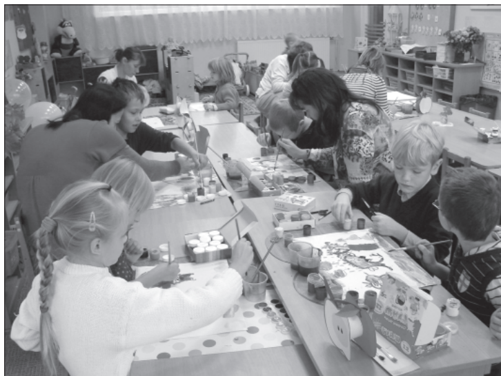
Spridīši zīmē "Dāvanu Lācītim".

Kukainišu grupas bērni, skolotājas un vecāki, sadalījušies vairākās darba grupās, veidoja kopīgu gleznu, par izejmateriāliem iz-