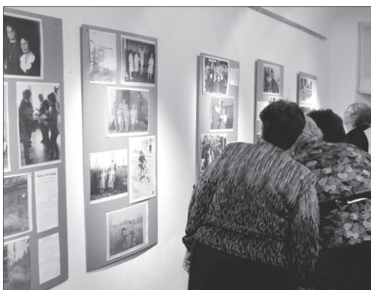
Izstāžu zāle ne mirkli nebija bez skatītājiem.