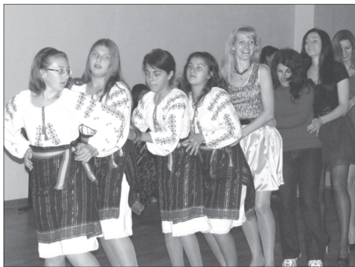
Kopējā deju solī.

Latvieši spēlēja pret turku zēniem, tomēr mūsējie nepiekāpās un uzvarēja, gan tikai ar viena punkta pārsvaru. Savukārt vakarā notika tik ilgi gaidītais kultūras vakars. Tajā katras valsts pārstāvji varēja iepazīstināt citus ar savai valstij un tautai raksturīgāko. Protams, ka latvieši gan dejoja, gan dziedāja. Arī turki, rumāņi un spāņi dejoja.