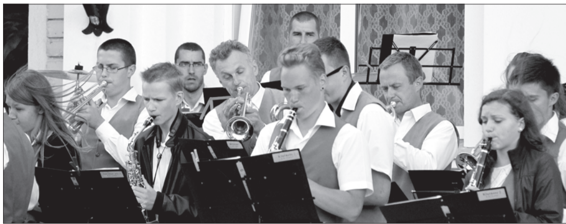
Uzstājas Uģāles pūtēju orķestra dalībnieki.