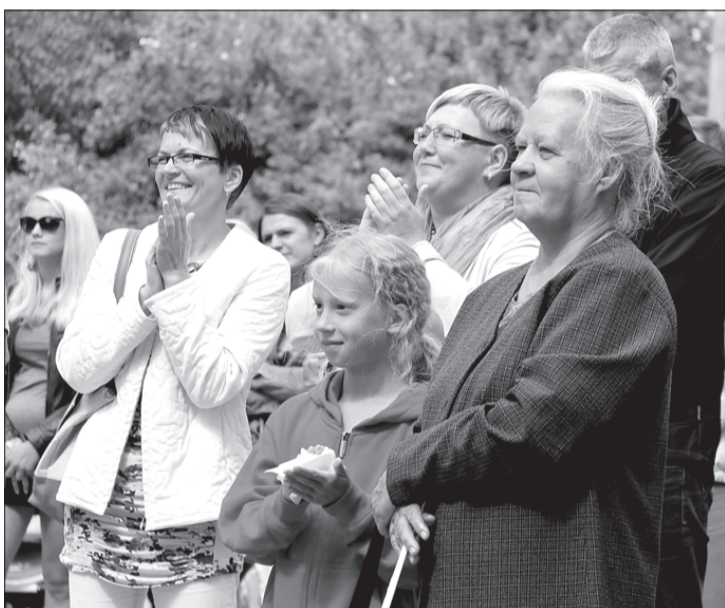
Skatītāju vidū bija daudz priecīgu seju.

20. jūlijā deviņpadsmito reizi pēc kārtas godinājām Uģāles pagastu. Svinējām Uģāles svētkus ar kultūras un sporta programmu visas dienas garumā. Šogad svētki bija veltīti Uģāles kā apdzīvotas vietas 760. gadskārtai.