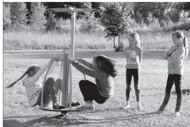
Tagad Ugāles bērnu laukumā ir vēl vairāk ko darīt.

Kopējās projekta izmaksas ir 9831,32 lats, publiskais finansējums – 8848,19 lats.