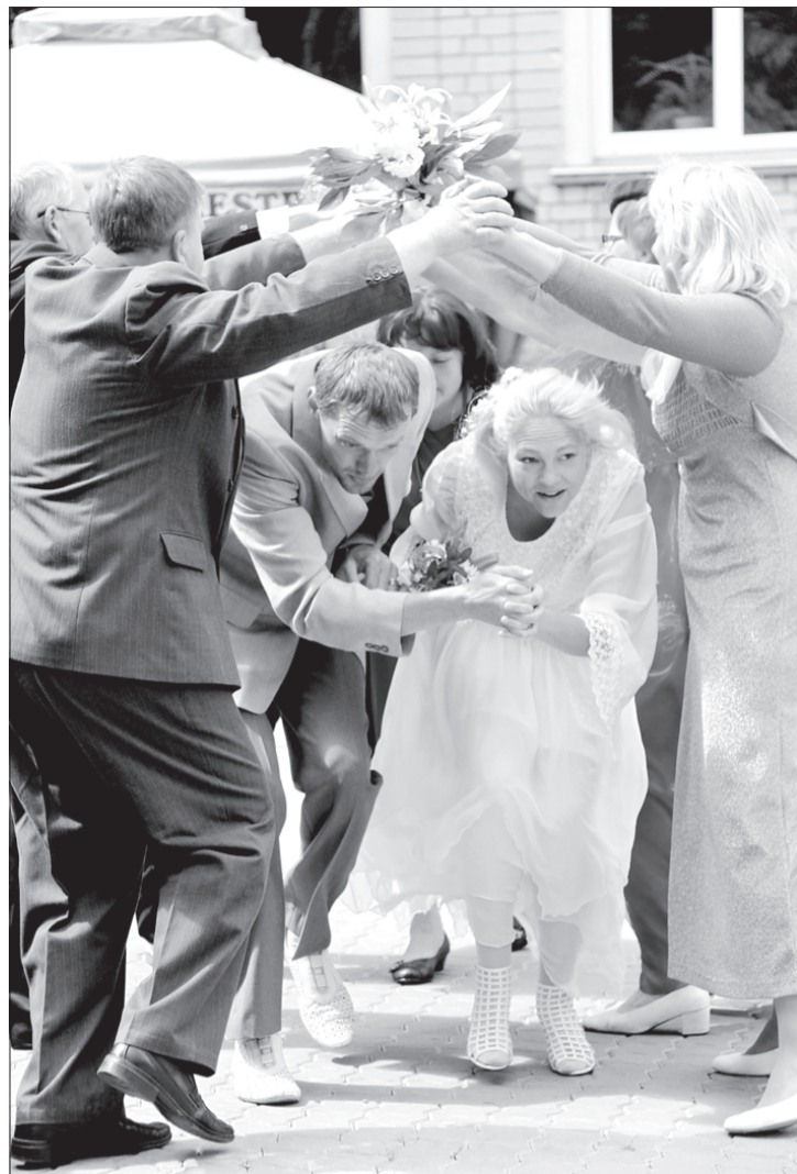
Laidzes amatiereteātra aktieri rāda "Kaimiņu būšanu".