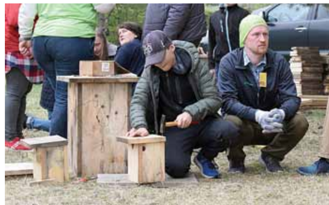
Putnu būrišu gatavošanas pieturā divu dienu laikā tapa simtiem jaunu mājvietu strazdiem, zīlītēm un pūcēm.