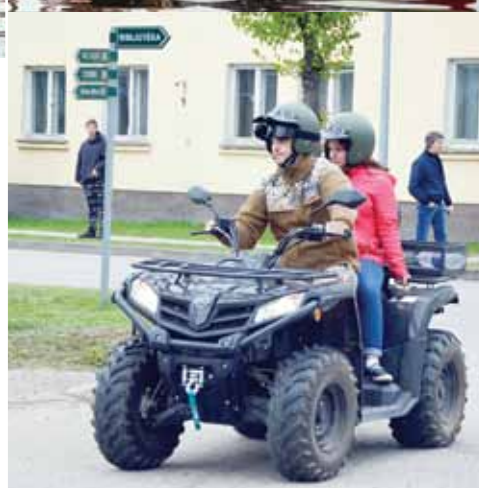
Zemessardzes 45. nodrošinājuma bataljona zemessargi interesentiem piedāvāja vizināties ar militāro transportu.