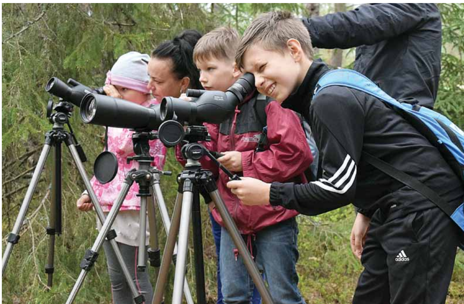
Talsu pamatskolas 2. klases zēniem patika pietura, kurā tālskati varēja vērot dzīvniekus mežā.

Divas dienas – piekdien un sestdien – Struņķukrogā pasākuma Meža ABC 53 pieturās meža nozares pārstāvji izglītoja par visu, kas notiek mežā, dažādās aktivitātēs iesaistot skolēnus, pieaugušos un ģimenes.