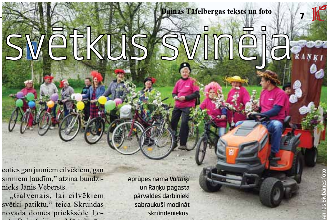
Aprūpes nama Valtaiki un Raņķu pagasta pārvaldes darbinieki sabraukuši modināt skrundeniekus.