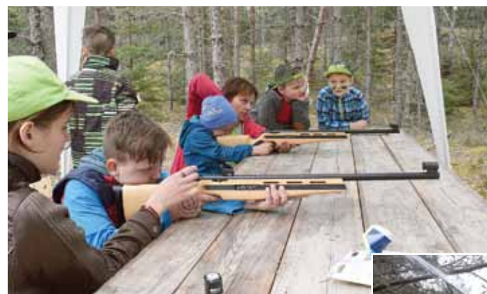
Daudzu zēnu viena no mīļākajām pieturām – šautuve, kurā ar īpašiem ieročiem jātrāpa mērķi.