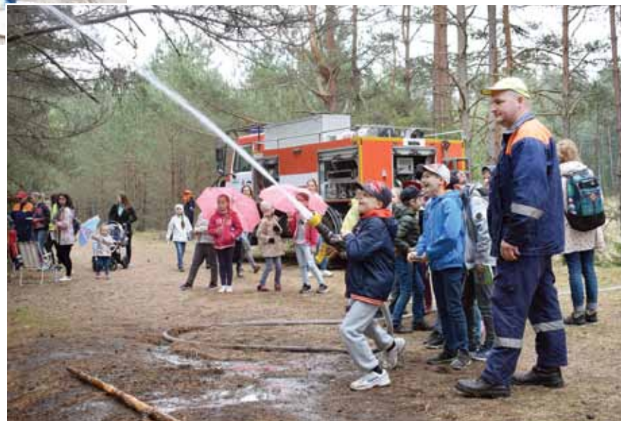
Antras Grīnbergas teksts un foto