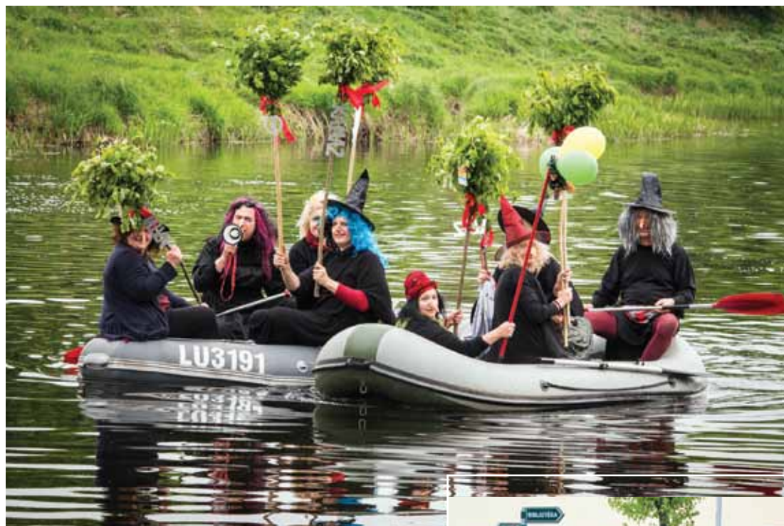
Laivu braucienā Lustīgi dzīvojam! , kas Skrundā ir svētku parādes vietā, krastam veiksmīgi pietuvojās visas sešas dalībnieku komandas, tostarp daiļās raganas jeb Skaistuma laboratorija .