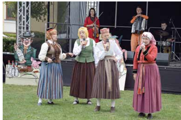
Koncertā Lustīgā ziņģu un danču andele satikās Liepājas aktrīšu kopa Atštaukas un latgalešu jautrā postfolkloras grupa Rikši , plēšot jokus uz visām pusēm.