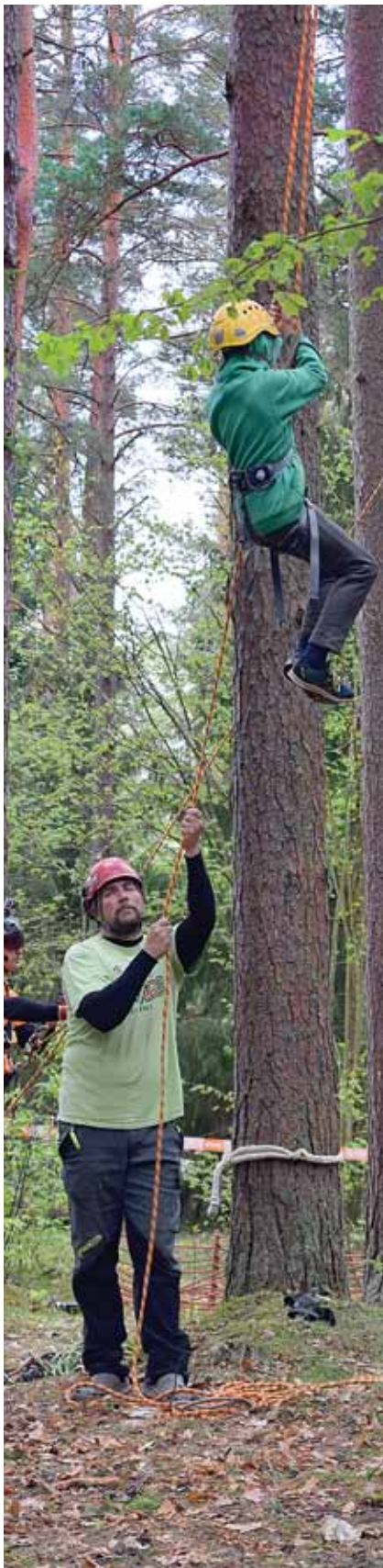
Garas rindas veidojās pie uzņēmuma Stihl pieturas – tajā apkārt notiekošo varēja vērot no priežu galotnēm.

Pēc aktīvas darbošanās ikviens varēja atpūsties pie ugunsкура un uzcept līdzī paņemtās desiņas vai doties uz āra restorānu, kur saimniekoja pavārs Raimonds Zommers.