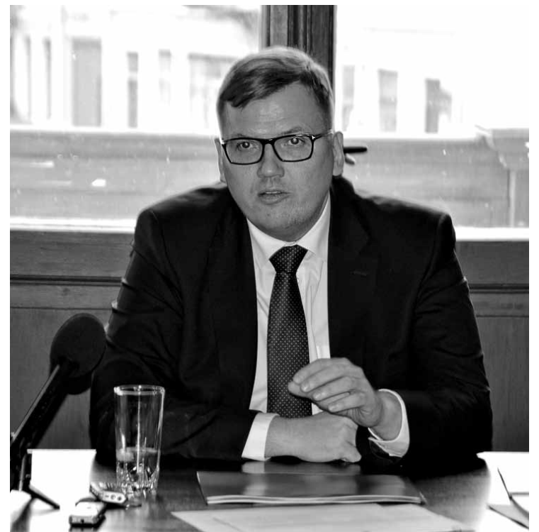
„Nozīmīgu funkciju pārdale reformas gaitā nenotiks. Lielās – izglītība, sociālā palīdzība un komunālās saimniecības nodrošināšana – paliks pašvaldībām,” uzsvēra vides aizsardzības un reģionālās attīstības ministrs Juris Pūce.

Kas notiks ar plānošanas reģioniem, kādas būs to funkcijas? „Koalīcijas partiju vidū valda vien-