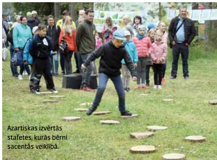
Azartiskas izvērtās stafetes, kurās bērni sacentās veiklībā.