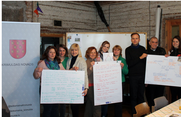
Ideju talkas rezultāti apkopoti

12. aprīlī Krimuldas baznīcas “Mācītājmājā” notika ideju talka, attīstot Kubeseles dabas un vēstures taku. Plānotais mērķis bija pārrunāt Kubeseles dabas un vēstures takas iespējamo labiekārtošanu un pieejamības veicināšanu projekta “Īpaši aizsargājamo dabas teritoriju un bioloģiskās daudzveidības saglabāšana un aizsardzība Kubeseles dabas takā”. Projekts tiek realizēts ar Latvijas Vides Aizsardzības fonda un Krimuldas novada domes finansiālu atbalstu.