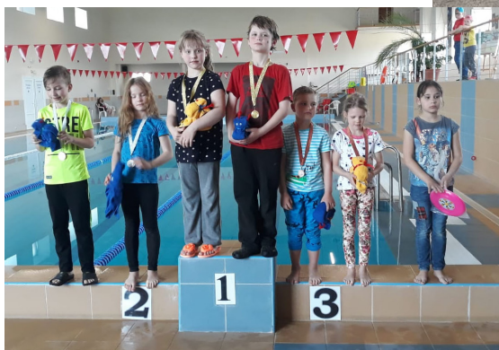
Peldēšanas sacensību uzvarētāji

piemēroti dažādām aktivitātēm. Domājam nākamgad šo tradīciju turpināt.”