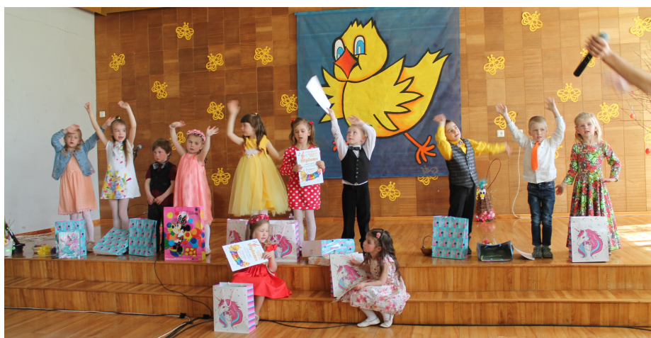
Konkursa saviesīgā daļa, kad uztraukumi pagājuši