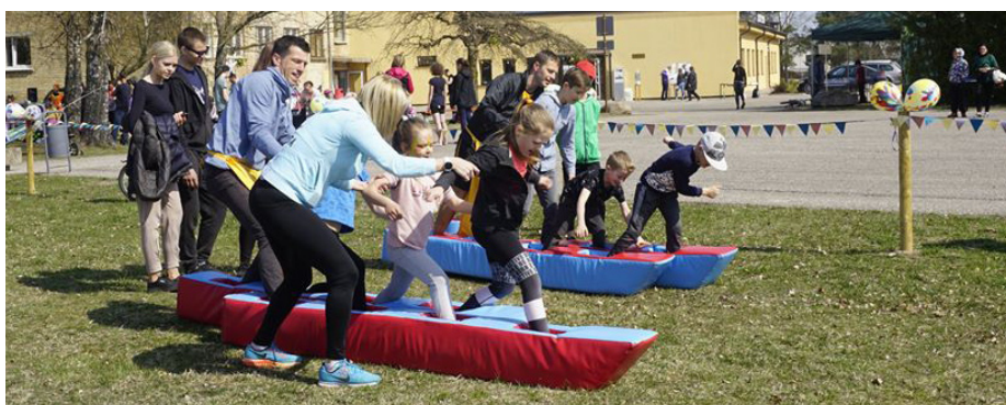
Nav vienkārši, bet jautri gan