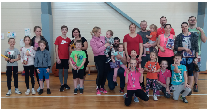
Ģimeņu sporta dienas dalībnieki