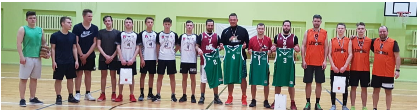
Komanda "Spārītes" spēlētāji ar izcīnītajām jaunajām strītbola formām ar konkurentu komandām

12. aprīlī Krimuldas vidusskolā notika strītbola 3. posms. Sacensībās tika noskaidrota komanda, kas tika pie jaunām strītbola formām.