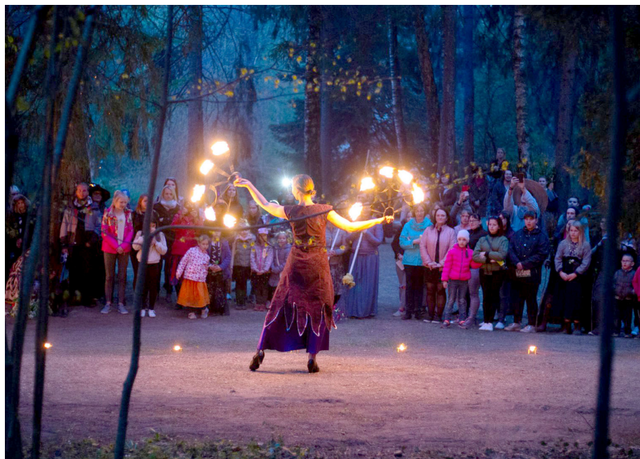
Pasākuma apmeklētāji vēro uguns šovu.

Pasākumu vadīja un apmeklētājus priecēja Lēdurgas folkloras kopa “Putni” Ilzes Kļaviņas vadībā. Vakara izskaņā Lēdurgas Dendroparka teritoriju piepildīja gaisma – vairāk kā divdesmit uguns stabi izgaismoja parku un ļāva pasākuma apmeklētājiem sajūst maģiskās nakts varenību. Lai gaismas ienešana šajos svētkos būtu vēl spilgtāka,