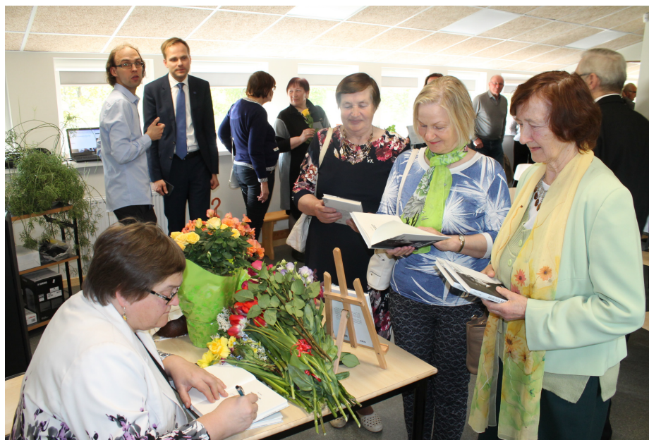
Saviesīgā daļa un rinda pēc rakstnieces autogrāfa