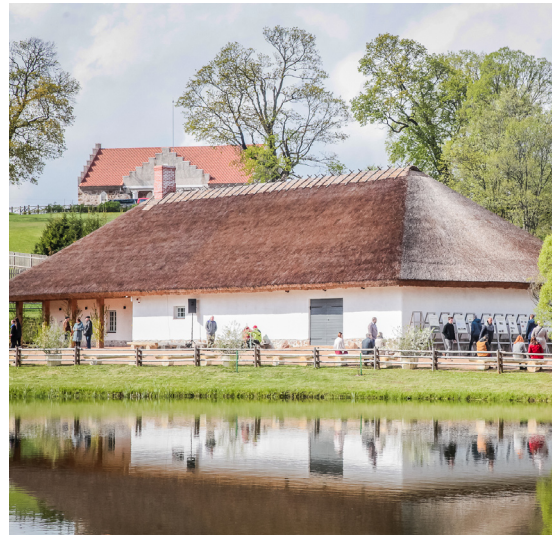
Pāri dīķim skatoties, var redzēt Klaušinieku māju un uzkalnā magazīnas ēku.