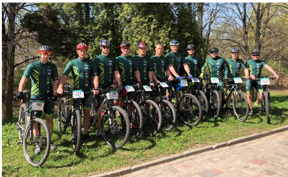
Krimuldas novada riteņbraukšanas komanda

“Trase bija diezgan ātra un tehniski vienkārša. Vienīgais traucēklis bija lielā cilvēku masa un puteklis, jo stratēģu no septiņā koridora. Uzstādījums bija nobraukt zem divām stundām, ko arī veiksmīgi izdarīju. Turp-