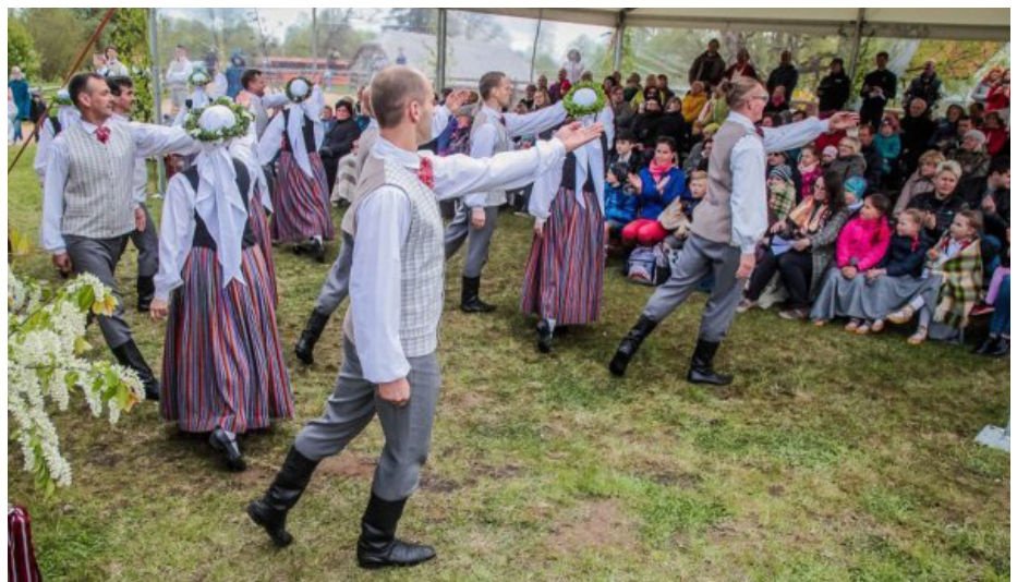
...kārtīgi izdancoties un uzlādēt ar enerģiju sevi un skatītājus.

iekļaujamies Eiropas kopienā līdzvērtīgi ar citām nācijām, stāvam paši uz savām kājām. Tas ir gods un arī atbildība. Man ir prieks, ka mums ir šī iespēja dzīvot