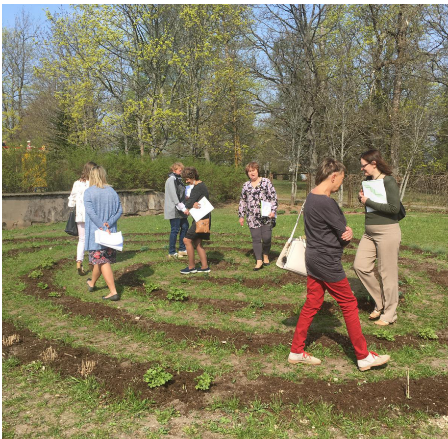
Atzinīgi tika novērtēts āra labirints, tā daudzfunkcionalitāte