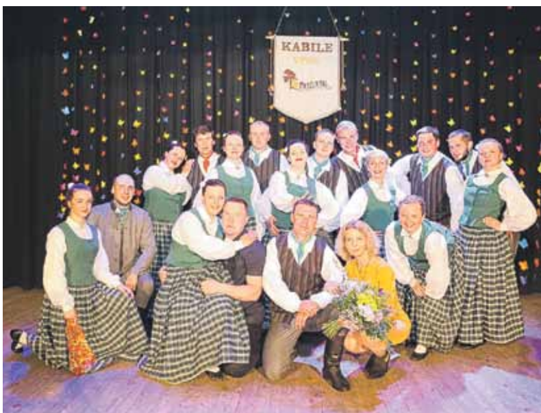
Kabiles Meždzirnas savā 10. gadskārtā.

Meždzirnas , tāpat kā vecākie kolēģi Kamēr vari , Kuldīgas novada deju skatītēs izcīnījuši ceļazīmi gan uz 2008., gan 2018. gada